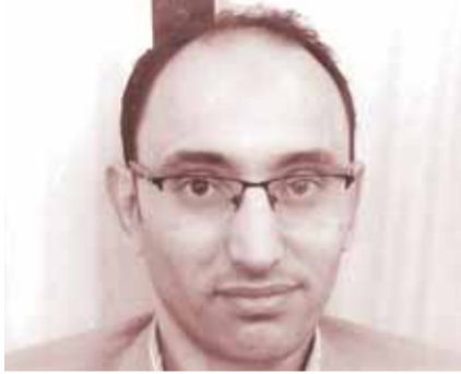
حفيد الإمام د. عبد الحلیم محمود