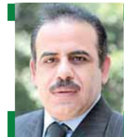
بقلم: عبد العزيز النحاس