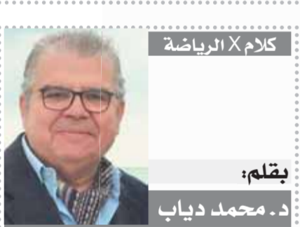
يقلم: محمد دياب