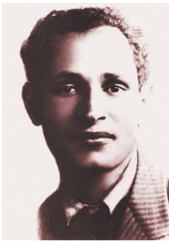
أول صورة في جواز السفر للإمام عبد الحلیم محمود