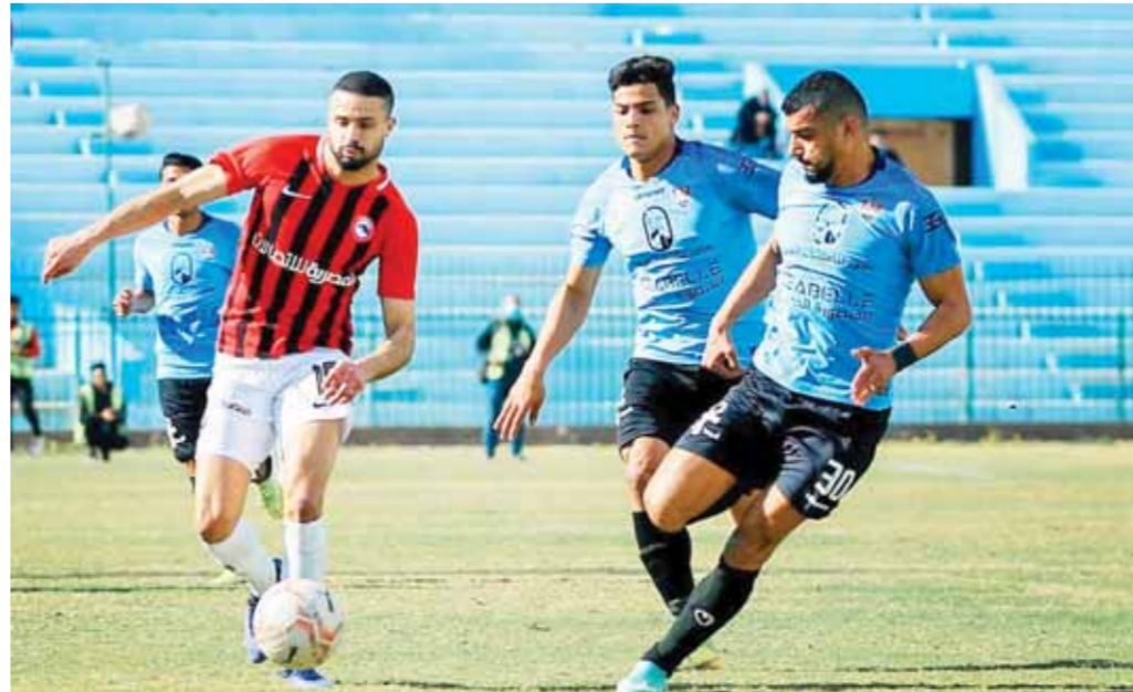
فيوتشر وغزل المحلة.. مباراة صعبة للفريقين