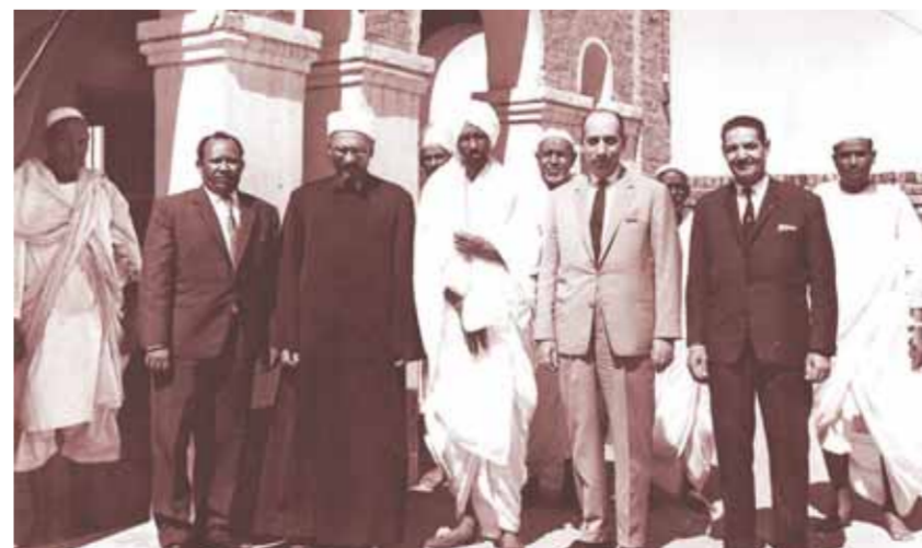
الإمام عبد الحلیم محمود شيخ الأزهر الأسبق في إحدى زيارته الخارجية