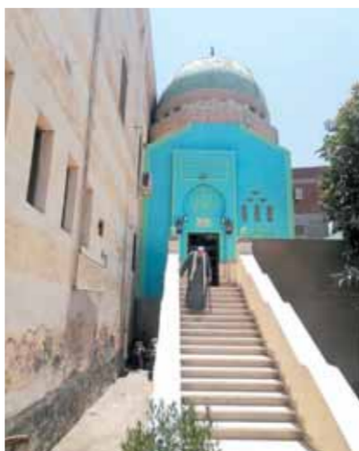
مقام الإمام العارف بالله الشيخ عبد الحلیم محمود