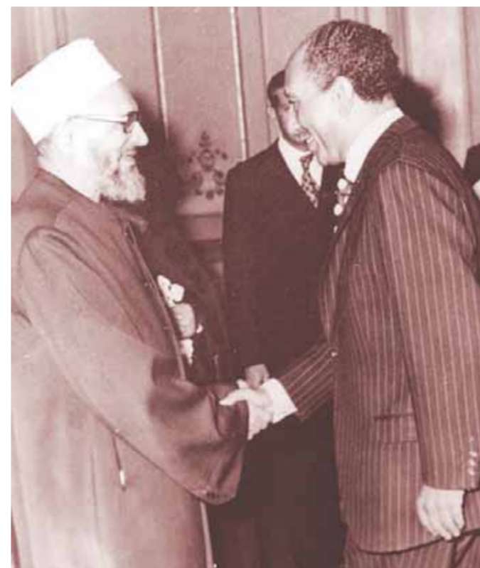
الإمام الأكبر عبد الحلیم محمود يصافح الرئيس الراحل أنور السادات