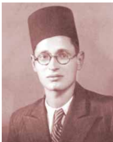
شيخ الأزهر الأسبق مرتدياً البدة والطرش

ويختتم حفيد حسين محمد عبد الحلیم محمود الحديث عن رحيل جده الإمام الأكبر قائلاً: لقد كانت حياة الشيخ رحمه الله جهاداً متصلاً من أجل صالح الإسلام والمسلمين.. وفي قمة نشاطه ورحلته المتتابعة لتفقد أحوال المسلمين شعر بالألم شديدة بعد عودته من الأراضي المقدسة، فأجرى عملية جراحية لقي الله بعدها في صبيحة يوم الثلاثاء الموافق ١٥ من ذي القعدة ١٣٩٧هـ - ١٧ من أكتوبر ١٩٧٨م تاركاً ذكرى طيبة ونموذجاً لما يجب أن يكون عليه شيخ الأزهر ليدفن في قريته «أبو أحمد» التابعة لمدينة بلييس بالشرقية، ونحن حريصون كل عام على إحياء ذكره السنوية.