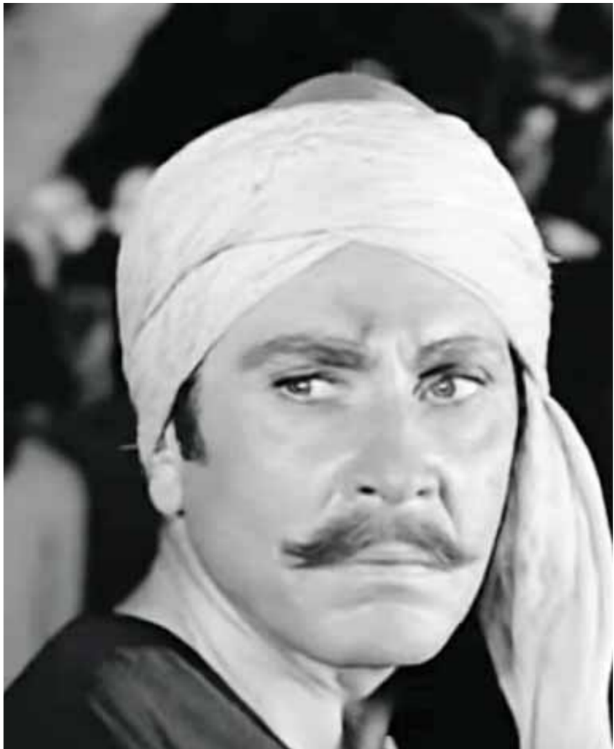
لمللم كعازف قانون فى أحد الملاهى الليلية حتى يستطيع مواجهة مسؤولياته تجاه أسرته وأبنائه وهن فى مرحلة الزواج. شخصية كانت أقرب للواقع فى تلك الفترة.