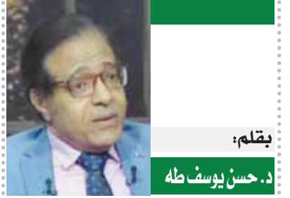
بقلم: د. حسن يوسف طه

يقول عباس حافظ عن مصطفى النحاس.. وكان مسلكه في وزارة المواصلات مسلك نزاهة رفيعة، إذ كان المعتاد قبل قيام وزارة الشعب الأولى أن يتقاضى كل وزير أربعين جنيهًا بمناية «بدل سيارة»، فلما جاءت الوزارة السعدية وقف النحاس بين زملائه يقول «إنني أفلحكم مالا، ولكنني متنازل عن مبلغ الأربعين جنيهًا التي تدفع لنا» فلم يكن من الوزراء إلى أن استجابوا له، واحتذوا حذوه، فالتقى المبلغ الميزانية إلى أن جاءت الوزارة الزبورية فاستلمته «يقصد وزارة أحمد زيوار باشا».. كان هذا هو أول عهد بالمناصب الوزارية.. ويدلل عباس حافظ على قوة شخصيته رغم حداثة عهده بالوزارة قائلا.. «ورغم ذلك لم يكن مصطفى يصانع أو يخجل أو يخشى سطوة أحد من الإنجليز، أو يسكت عن إساءة من ناحيتهم، أو خطأ يقترفه كبير رغم بل كان الوزير الخريص على كرامته، الحفيظ لهيبة منصبه وسلطته، فقد قرأ وهو وزير