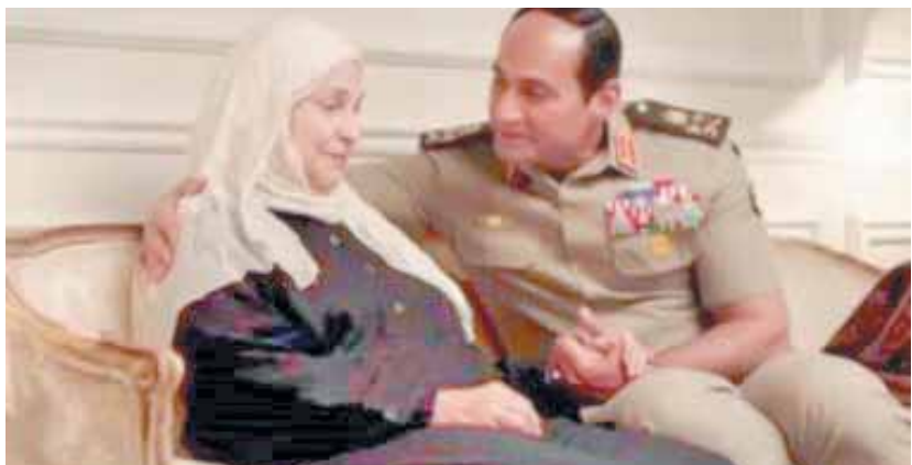
نادية رشاد في مشهد من مسلسل «الاختيار»