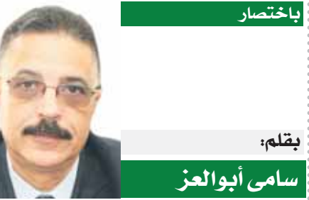
بقلم: سامي أبو العز

يضعون القانون من ثم هم لديهم حصانة من تطبيقه عليه، لعل هؤلاء والذين يسيرون على دربه لا يخافون من القانون، فإن تطبيق القانون على الجميع يمنح الشخص الشعور بالراحة والطمأنينة، وعدم تطبيقه هكذا ينشر الخوف والتخوف بين أفراد المجتمع، فكم من متعب على المال العام ولم يقترب القانون منه، ويقولون عبراتهم المشهورة هو كان في حد قبلنا في هذا المكان تحسب، هذه العبارة تسرب الشك في نفوس السطاء لأنهم بالفعل لم يصادفهم حبس أي من المعتدين على المال العام... ما أكثرهم. لم تصد أحدا!