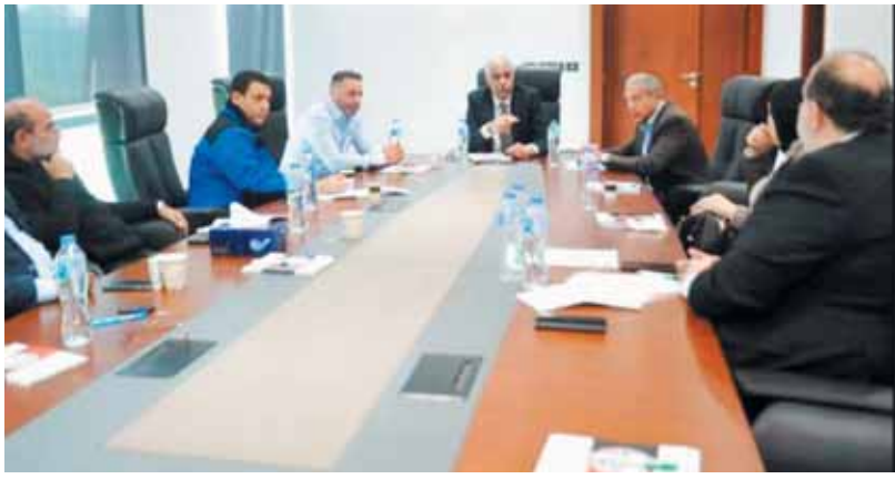
مجلس إدارة اتحاد الكرة