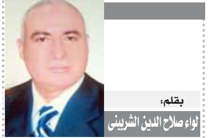
بقلم: لواء صلاح الدين الشريفي