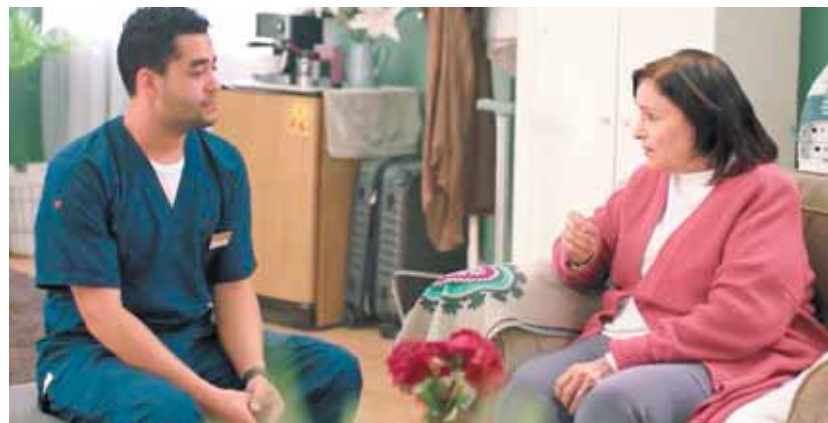
مسلسل «مباراة زوجية»