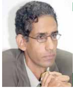
بقلم: طارق تهامي

التيهمن، أو أن أحبك في الحال إلى مجلس تاديب وانصرف المستر فرسكوي حائراً لا يدري ماذا هو صانع إزاء هذا الوزير الجديد الذي لا يضع إنجليزته موضع الاستثناء، ويعامله كمرووس من عرض المرؤوسين سواء بسواء.. ولكن لم يلبث أن خطر له خاطر، فعمد إلى تنفيذ، وذلك هو أن يزور صديقاً إنجليزياً مثله يشتغل بالمحاماة، راجياً إليه أن يقصد المستر فرسكوي، فلما حضر قال له إنني صديقه هذا بما جرى، ذهب الصديق إلى النحاس باشا، فدخل عليه وسطل الأمر له، فقال له مصطفى باشا إنني أعجب لك كيف