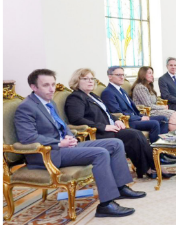
الرئيس عبد الفتاح السيسي يستقبل وزير الخارجية الأمريكي أنتوني بلينكن

في قطاع غزة، وتبادل المحتجزين، وإنفاذ المساعدات الإغاثية اللازمة لإنهاء المعاناة الإنسانية بالقطاع. وأوضح الرئيس ما تقوم به مصر من جهود هائلة، في ظروف ميدانية صعبة، في قيادة عملية تقديم وتسليم وإدخال المساعدات الإنسانية إلى غزة، بالتنسيق مع المؤسسات الأممية والإغاثية ذات الصلة، مؤكداً أهمية الدور المحوري الذي تقوم به وكالة غوث وتشغيل اللاجئين الفلسطينيين (الأونروا) على هذا الصعيد. وأكد الرئيس ضرورة تنفيذ القرارات الدولية والأممية المعنية بالأزمة، واتخاذ خطوات جادة تجاه التسوية العادلة والشاملة للقضية الفلسطينية، بما يضمن استقراراً مستداماً في المنطقة.