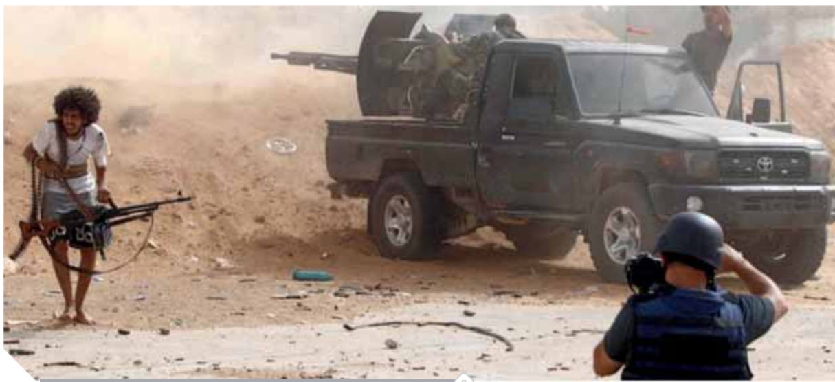
جانب من الاشتباكات فى ليبيا

وأعلن الرئيس التركى، رجب طيب أردوغان، مساء أمس الأول، بدء نشر جنود أترك فى ليبيا استناداً إلى الضوء الأخضر، الذى منحه البرلمان التركى قبل أيام لحكومته. وكان الأمين العام للأمم المتحدة، أنطونيو غوتيريش، حذر تركيا، الجمعة الماضى، من إرسال قوات عسكرية إلى ليبيا، معتبراً أن أى دعم أجنبى للأطراف المتحاربتين فى ليبيا لن يؤدى إلا إلى تعميق الصراع فى هذا البلد. ومن شأن إرسال قوات تركية إلى ليبيا تصعيد النزاعات التى تعانىها هذه الدولة منذ سقوط نظام معمر القذافى فى ٢٠١١، وهى نزاعات تلقى أصداء إقليمية.