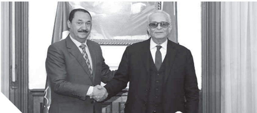
المستشار بهاء الدين أبوشقة والنائب بدوى النويشى