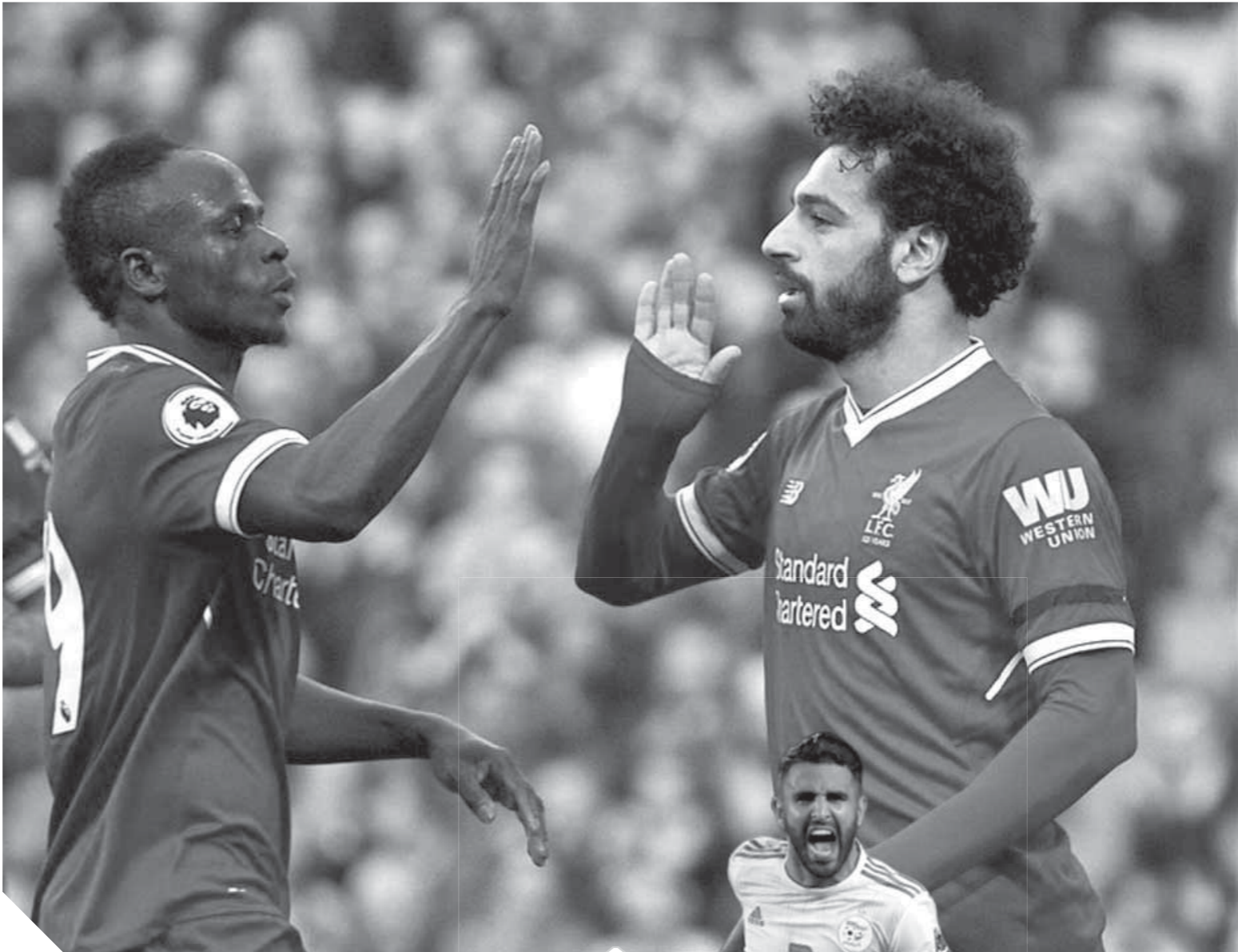
ساديو مانى يتنافس محمد صلاح على جائزة أفضل لاعب

ويعد إنجاز الكان حصيلية محرز فى سياق التتويج القارى بعد أن حصد كل الألقاب المحلية مع مانشستر سيتي فى مواجهة ثنائى ليفربول الإنجليزى محمد صلاح وساديو مانى. كما أن محرز حصل على نفس الجائزة خلال عام ٢٠١٥، والذى صنع فيه المجد مع ليدستر سيتي، حيث حقق المفاجأة وفاز الثالاب بقيادة النجم الجزائرى بلقب البريميرليج وحصل وقتها على لقب أفضل لاعب بالبريميرليج.