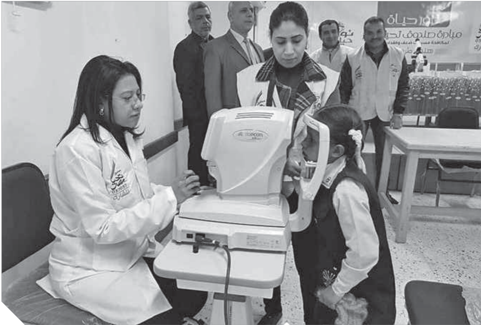
فحص الأطفال فى مبادرة، نور حياة،