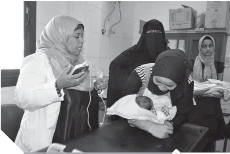
المبادرات الصحية شملت جميع أبناء الشعب المصرى

وفى هذا السياق، قال محمود أبوالخير، عضو لجنة الصحة بمجلس النواب، إن مبادرة الرئيس عبدالفتاح السيسى، بشأن إنهاء قوائم الانتظار، أفتدت عشرات الآلاف من المرضى بإبائها قوائم الانتظار للمرضى، خاصة العمليات الحرجة والأمراض المزمنة، ما خفف من معاناة آلاف المواطنين من البسطاء ومحدودى الدخل، وهذا يسهم فى تحسين الوضع الصحى فى مصر ورفع كفاءة المنظومة الصحية وهو ما ظهر جلياً أيضا فى حملة ١٠٠ مليون صحة. وأشار عضو لجنة الصحة بمجلس النواب، بنجاح المبادرة، التى تهدف لتخفيف المعاناة عن المواطن المصرى وتقديم الخدمة بكفاءة للقضاء على قوائم الانتظار، مؤكداً وجود نتائج ملموسة لهذه المبادرة فى جميع المحافظات، والقضاء على نسبة كبيرة من قوائم الانتظار. وأضاف «أبوالخير» أن مبادرة ١٠٠ مليون صحة استطاعت أن تضع قائمة للأمراض فى مصر، ومعرفة نسب المرضى فى كل محافظة والفئة العمرية والمهن التى يعمل بها المرضى وغيرها من المعلومات التى يمكن الاستفادة منها فى الأبحاث الطبية للوقاية والأمراض وحصلت الحملة على إشادة من منظمة الصحة العالمية بنجاح المبادرة وهو ما يعتبر إنجازاً جديداً للدولة، وهناك العديد من الدول تعمل حالياً على دراسة التجربة المصرية لتطبيقها فى الدول التى تعاني من انتشار الأمراض.