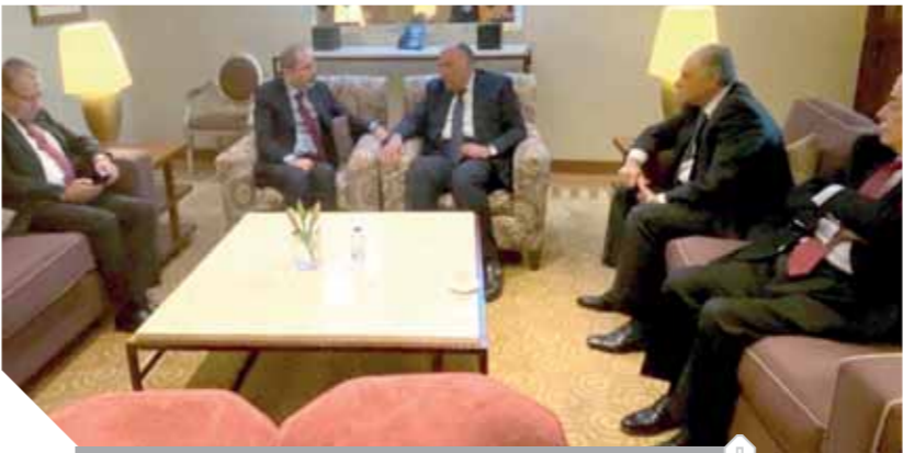
لقاء «شكرى» ونظيره الأردنى على هامش الاجتماع

من أجل خلق آلية وكيان يجمع هذه الدول، يمكنها من أن تتعامل مع هذه التحديات التى تواجهها عبر هذه الممرات المائية، وتعزيز آفاق التعاون بين الدول، ودور إقامة الكيان فى تعزيز الأمن والاستقرار والتجارة والاستثمار فى المنطقة. واتفقت ٧ دول عربية وإفريقية مطلة على ممرى البحر الأحمر وخليج عدن فى الرياض،