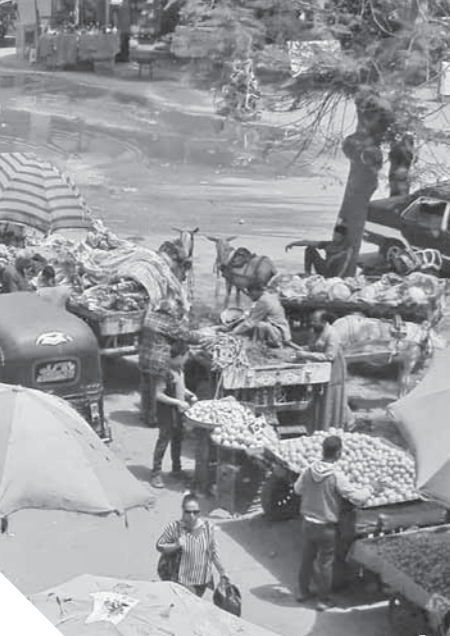
الباعة الجائلون يفتشرون الشوارع

كارثة.. الباعة تركوا المحلات واقتروشوا الشوارع