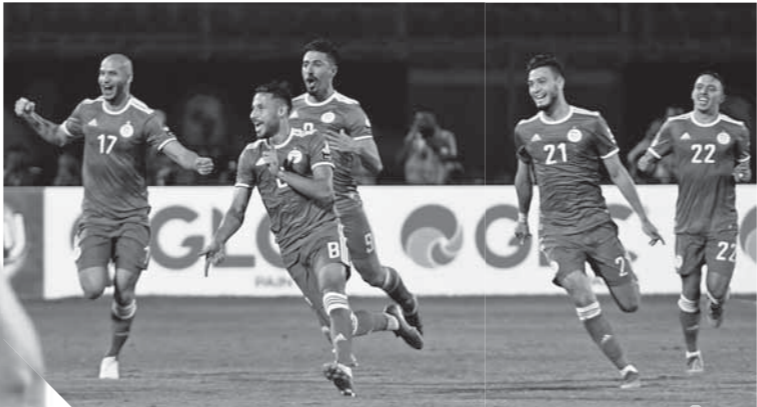
منتخب الجزائر بطل افريقيا

وتدل أرقام جمال بلماضى فى ٢٠١٩، على مستوى هذا المدرب المميز،