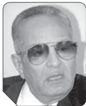
بهاء الدين أبوشقة