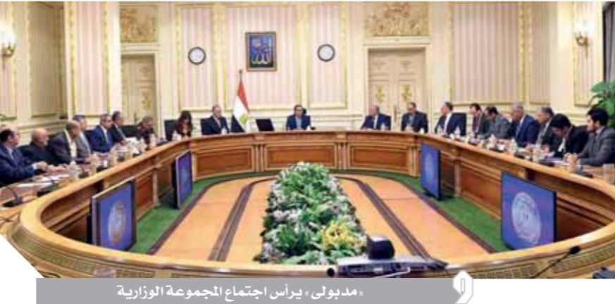
«مدبولى» يرأس اجتماع المجموعة الوزارية