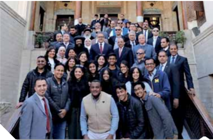
بعض الزوار مع وزير السياحة والآثار

وأشار وزير السياحة والآثار، إلى أن ذكرى دخول العائلة المقدسة مصر، تحمل أهمية تاريخية ودينية كبيرة لدى المصريين، كما أنها تعد من التراث الدينى العالمى الذى تتفرد به مصر عن سائر بلدان العالم، وبفضلها تبوأت الكنيسة القبطية المصرية مكانة دينية خاصة بين الكنائس المسيحية فى العالم، لارتباطها بهذه الرحلة المباركة لأرض مصر الغالية على مدار أكثر من ثلاثة أعوام ونصف، باركت خلالها العائلة أكثر من ٢٥ بقعة فى ربوع مصر.