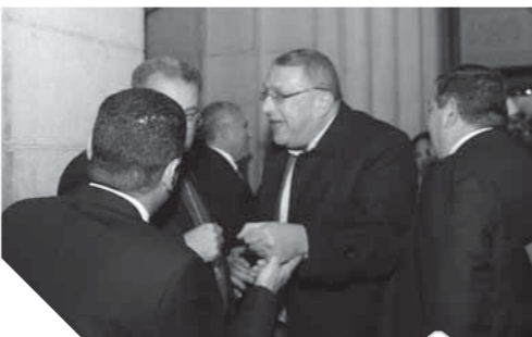
.. وحسين منصور