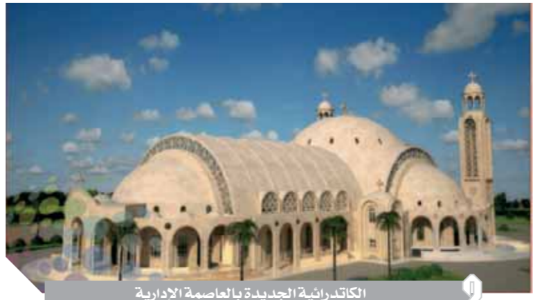
الكاتدرائية الجديدة بالعاصمة الإدارية

أعلن المركز الإعلامى لمجلس الوزراء أن الموقف التفيدى للكنائس بمدن الجيل الرابع تضمن افتتاح كاتدرائية ميلاد المسيح بالعاصمة الإدارية الجديدة وتفيد ٦ كنائس بمدينة حدائق أكتوبر، بينما يجرى تنفيذ ٨ كنائس بمدن «المنصورة الجديدة، العلمين الجديدة، غرب قنا، العبور الجديدة، أكتوبر الجديدة، غرب أسيوط». ورصد فيديوجراف، أصدره المركز أمس، تخصيص ٤١ قطعة أرض لبناء الكنائس بالمدن الجديدة خلال الفترة من ٢٠١٤ حتى ٢٠١٩، وإلى جانب هذه الخطوات، بالإضافة إلى إحلال وتجديد ١٨ كنيسة وملحقاتها بمحافظة المنيا بعد إلحاق ضرر بها بتكلفة تقديرية ٤٠,٤ مليون جنيه.