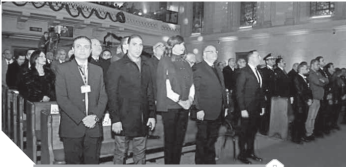
محافظ القاهرة خلال احتفال الأرمن الأرثوذكس