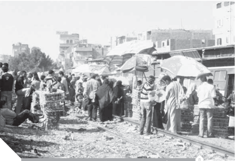
أسواق غشوائية على قضبان السكة الحديد