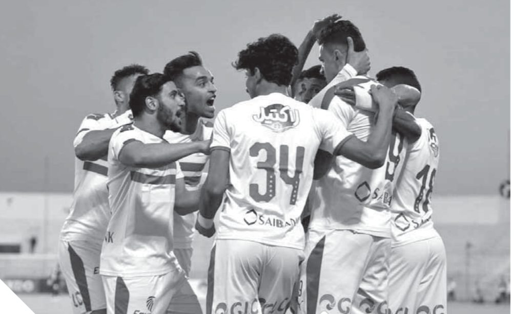
فرحة لاعبي الزمالك بالفوز الصعب على طنطا