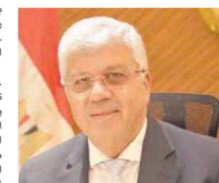
د. أيمن عاشور

وأشاد السفير شريف كامل، سفير مصر لدى المملكة المتحدة بموضوع المنتدى، مؤكداً أن التعليم العالى والبحث العلمى فى مصر، وذلك فى ضوء الحاجة إلى ربط مهارات الخريجين بسوق العمل المحلى والإقليمى والدولى. كما تناولت العروض التى قدمها نواب وزير