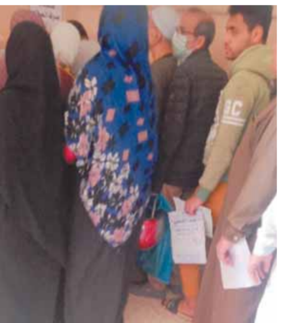
تكس المرضى بالتأمين الصحى بينها