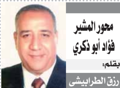
محور المشير فؤاد أبو ذكري بقلم: رزق الطرايشي