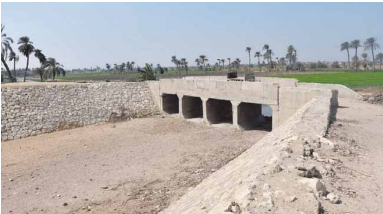
مخزات السيول بالفيوم

الولادات الموجودة بها وقياس كفاءتها التشغيلية، والتأكد من جاهزيتها والعمل على صيانتها بشكل دوري وتوفير الوقود اللازم لها بشكل كافٍ، والعمل على الاستفادة من التجربة السابقة خلال