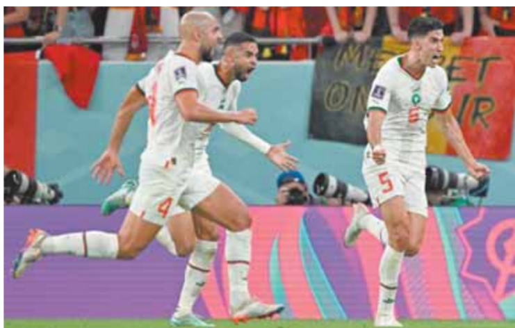
المنتخب المغربي في اختبار صعب امام اسبانيا

بونو، بجانب باقي كتيبة نجومه على رأسهم حكيم زياش، وسفيان أمرابط، ورومان سايس ونايف أكرد وأشرف حكيمي. ويسعى لويس إنريكي، المدير الفني لمنتخب إسبانيا، لتحقيق الفوز على حساب المغرب والتأهل إلى ربع النهائي. ويعتمد الماتادور الإسباني على كتيبة من النجوم أيضاً على رأسهم الهداف، ألفارو موراتا، بجانب رودريجو وبيدري وجايمي سيرجيو بوسكيتس. ويسعى منتخب البرتغال بقيادة مدربه فرناندو سانتوس، لتحقيق الفوز على حساب سويسرا، من أجل التأهل إلى دور الثمانية. ويسلم منتخب البرتغال بقيادة لوجو كريستيانو رونالدو، بجانب بعض اللاعبين المميزين مثل برونو فرنانديز وجواو فيليكس وبرناردو سيلفا في مواجهة سويسرا بقيادة مدربه مورات ياكين.