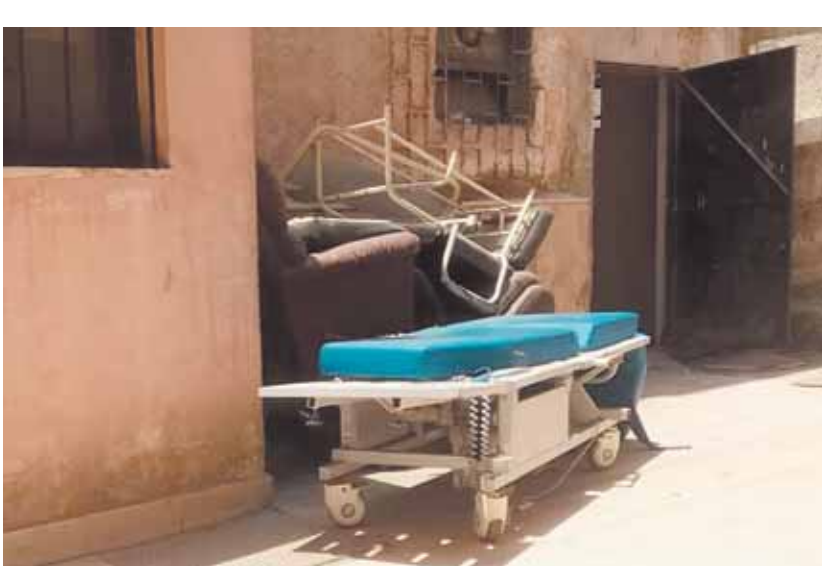
أجهزة حديثة تحولت إلى روبايكيا