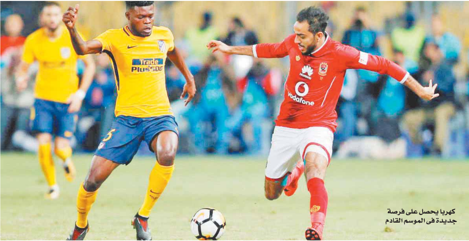
كهربا يحصل على فرصة جديدة في الموسم القادم