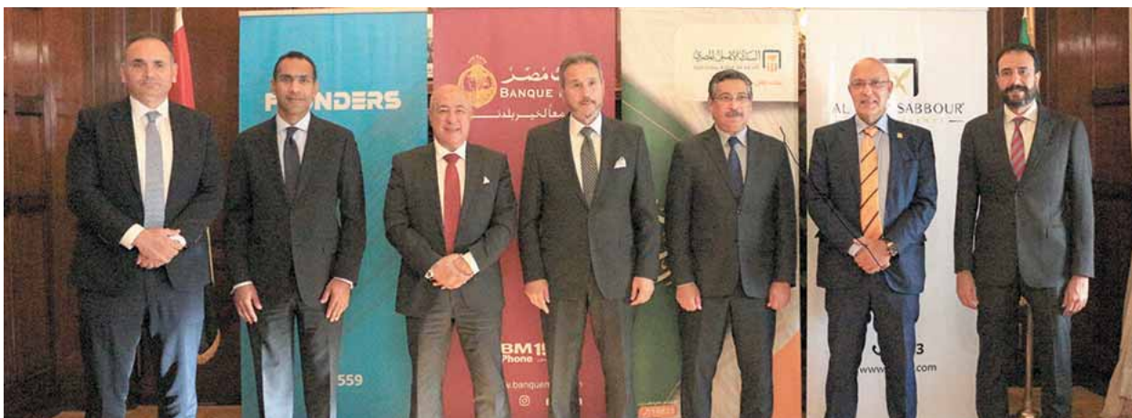
قيادات البنوك والشركات خلال إطلاق المرحلة الأولى