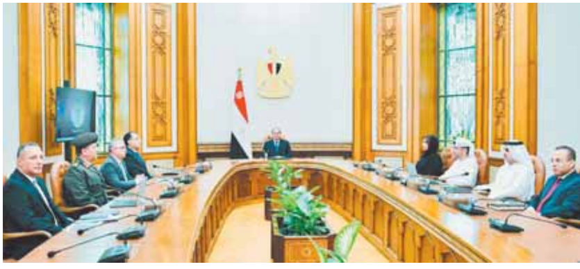
«السيسي» خلال استقبال الرئيس التنفيذي لمجموعة موانئ أبوظبي: