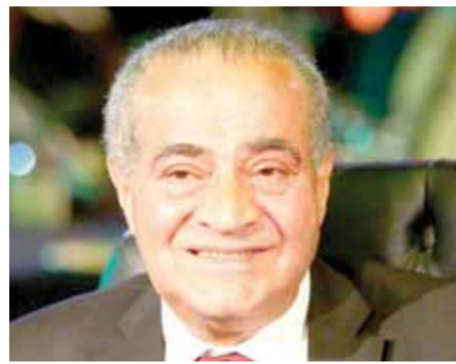
د. وجدى زين الدين

الإشرافية بالمصانع بمتابعة أعمال وزن وتسليم القصب وبعد خصم الشوائب، كما قرر الوزير صرف علاوة استثنائية لطن البنجر وفقاً للزراعات التقليدية الخاصة بالتعاقد مع المزارعين لموسم ٢٠٢٤ لصالح مصانع إنتاج السكر من البنجر وهي الدلتا- الدقهلية- النوبارية- الفيوم- السكر والصناعات التكاملية المصرية- النيل- الإسكندرية- الشرقية- القناة. وشمل القرار صرف ١٩٠٠ جنيه لطن عن توريد محصول البنجر خلال الفترة من ١ مارس حتى ١٥ مارس ٢٠٢٤ حيث تتضمن (١٥٠٠ جنيه سعراً أساسياً و٤٠٠ جنيه علاوة للطن)، وصرف ١٧٥٠ جنيه لطن عن توريد محصول البنجر خلال الفترة من ١٦ مارس حتى ٣١ مارس ٢٠٢٤ وتتضمن (١٤٠٠ جنيه سعراً أساسياً