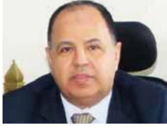
د محمد معيط

الأنظمة الرقمية المتطورة تسهم في تعزيز الحوكمة بالمنافذ الجمركية، على نحو يمكننا بالتعاون مع الجهات المعنية بالدولة من الكشف عن الكيانات الوهمية، وقد نجحت الإدارة المركزية لمكافحة التهرب الجمركى في تحرير ٥١ محضرا لمصانع وشركات وهمية، بقيمة ١٧,٥ مليار جنيه ضريبة جمركية مستحقة، بعدما تبين قيامها باستيراد مواد خام ومعدات بغرض الاتجار وليس التصنيع للتحويل على قواعد الاستيراد، وحصولهم على الإعفاءات والتيسيرات المقررة لاستيراد مستلزمات الإنتاج.