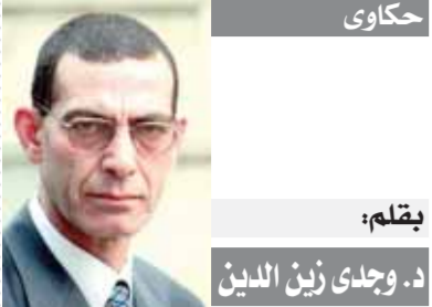
حكاوى بقلم: د. وحدى زين الدين

وتمكن في القضاء والدبلوماسية كما قادت من قبل حرب أكتوبر المجيدة. وحول دوره في مفاوضات ما بعد الحرب أشار العقيد حلمى زكى إلى أنه بعد نصر أكتوبر المجيد بدأت المفاوضات لاستعادة سيناء، وعقب اتفاقية كامب ديفيد ١٩٧٨ تم الاتفاق مع الجانب الإسرائيلي على استعادة سيناء، وكتبت سعيداً جداً لاختياري ضمن مجموعة ١٥ وهو