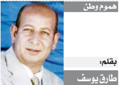
هجوم وطن بقلم: طارق يوسف