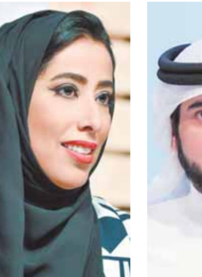
أحمد بن محمد

من التميز، يعود بالنفع على المجتمع ويخدم مصالحه، مؤكداً ان الهدف الأسمى للجائزة هو تعزيز دور الإعلام في تمكين الإنسان العربي من تحقيق الريادة في ركب التطور العالمي. وصرح ضياء رشوان، رئيس مجلس إدارة جائزة الإعلام العربي تقبيل الصحفيين في مصر، أن دبي تواصل دفع حدود التميز إلى مستويات أرقى في مسيرة استشراف المستقبل.. وجائزة الإعلام العربي ما هي إلا انعكاس لهذه الرؤية الطموحة التي تقف وراء هذا التميز الفريد في التنمية، وأنت منى غانم المرعي، رئيسة نادي دبي للصحافة أمين عام جائزة الإعلام العربي، على المستوى الرفيع الذي جاءت عليه أغلب المشاركات، ضمن مختلف الفئات، مؤكداً ان هذا الكم من الأعمال الجيدة، ينشر بقدرته قطاعات الإعلام المختلفة في المنطقه على بلوغ مستويات جديدة من التميز، والجائزة بدورها تمهد الطريق أمام كل إعلامي صاحب فكر خلاق ورؤية مبدعة، للوصول إلى أرفع منصات التكريم المهني في المنطقه.