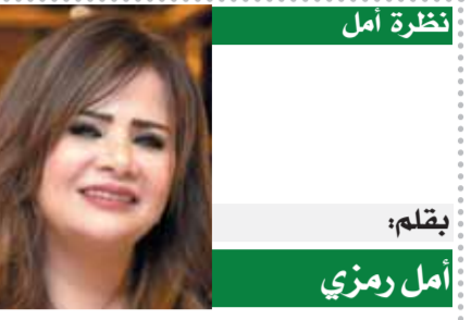
نظرة أمل بقلم: أمل رمزي