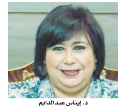
د. إيناس عبدالدايم محتواو الفن، متابعة أن فعالياته تضم مجموعة من الألوان الإبداعية الجادة التي تتوافق مع خطط تحقيق العدالة الثقافية وتسهم في تنفيذ