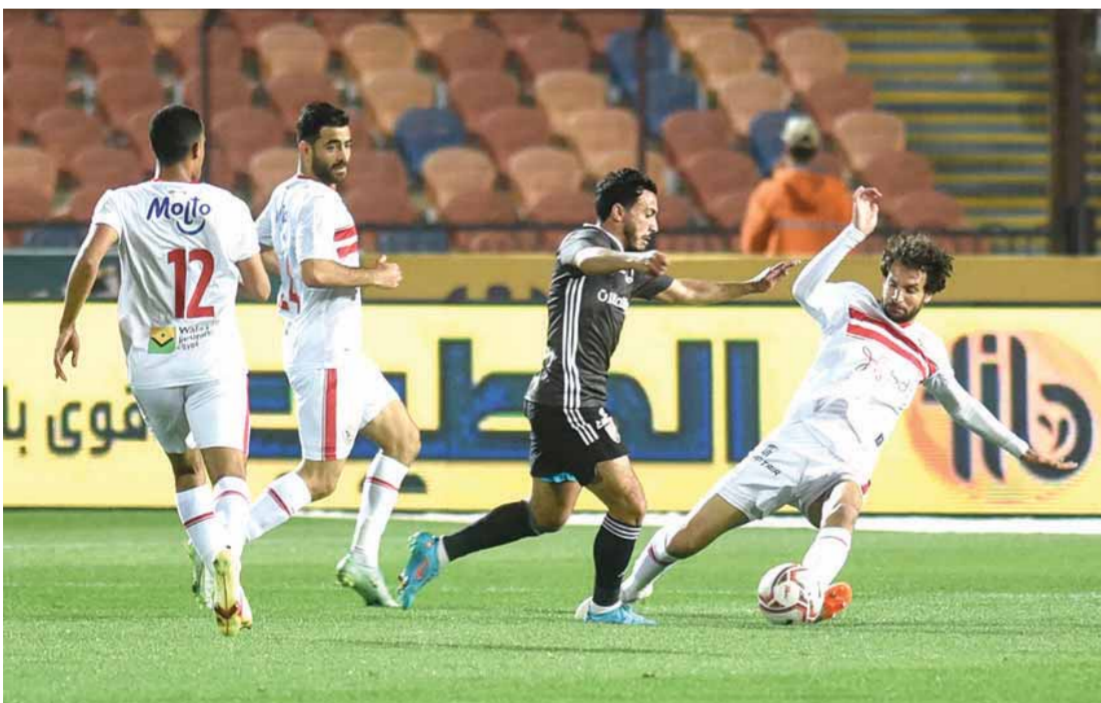
الزمالك يصارع الجودة في الدوري

مضروبة تحقيق الفوز من أجل المنافسة بقوة للدخول في المربع الذهبي. ويحتل فريق البنك الأهلي المركز السابع بمسابقة الدوري برصيد ٢٧ نقطة بينما يحتل مصر المقاصة المركز الأخير برصيد ١٥ نقطة.