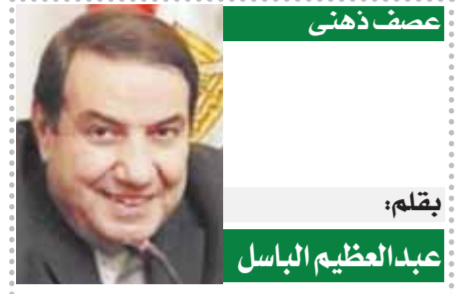
عصف ذهني بقلم: عبد العظيم الباسل

أثناء احتفاله بعيد ميلاده الخامس والخمسين، توفي لاعب كمال الأجسام البرازيلي الشهير، فالدير سيجاتو، الذي يوصف بأنه «الهالك» أو «العماق» البرازيلي، بعد أن حقق نفسه بزيت لتسمية العضلات. وحقق «سيجاتو» نفسه على ما يبدو بجرعة زائدة من عقار تكبير العضلات، مستخدماً بطل كمال الأجسام السابق والممثل في هوليوود وحاكم كاليفورنيا السابق أرنولد شوارزنيغر، وكان سيجاتو، البالغ من العمر ٥٥ عاماً، يحقق نفسه بعقار «السينتول»، على مدى سنوات، فأصبح يتمتع بعضلات هائلة، وأصبح يشبه إلى حد كبير، البطل في سلسلة أفلام «الهالك العجيب» أو «العماق الأخضر». ووفقاً لصحيفة الديلي ميل البريطانية، قال سيجاتو في العام ٢٠١٦ إنهم يدعونني بلقب الهالك العجيب وشوارزنيغر وأنا أحب ذلك، لقد شأفت عضلاتي ذات الرأسين لكنني ما زلت أريد أن أكون أكبر وأضخم.