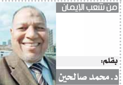
من شلعب الأيمان

«شهر رمضان الذى أنزل فيه القرآن هدى للناس وبينات من الهدى والفرقان فمن شهد منكم الشهر فليصمه ومن كان مريضاً أو على سفر فعدة من أيام أخر يريد الله بكم اليسر ولا يريد بكم العسر ولتكملوا العدة ولتكبروا الله على ما هداكم ولعلكم تشكرون» صدق الله العظيم «البقرة ١٨٥»