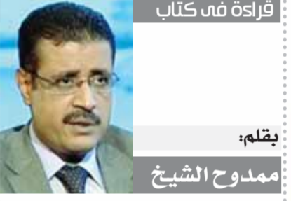
قراءة فى كتاب

● إن هناك بعض الأحاديث التى وردت فى السنة الصحيحة عن فضل التوحيد منها: ● عن أنس رضى الله عنه برهفه: سمعت رسول الله (ﷺ) يقول: «قال الله: يا ابن آدم، إنك ما دعوتنى ورجوتنى، غفرت لك على ما كان قبلك ولا أبالي، يا ابن آدم، لو بلغت ذنوبك عنان السماء ثم استغفرتنى، غفرت لك ولا أبالي، يا ابن آدم، إنك لو أتيتنى بقراب الأرض خطايا ثم لقيتني لا تشرك بي شيئاً، لأيتت بك بقرابها مغفرة». ● فى عبادة رضى الله عنه قال: قال رسول الله (ﷺ): «من شهد أن لا إله إلا الله وحده لا شريك له، وأن محمداً عبده ورسوله، وأن عيسى عبد الله ورسوله، وكلمته أنشأه إلى مريم وروح منه، وأن الجنة والنار حق أدخله الله من أى أبواب الجنة الثمانية شاء». ● قال النبي (ﷺ): «من لقى الله لا يشرك به شيئاً دخل الجنة، ومن لقيته يشرك به دخل النار». ● عن أنس رضى الله عنه قال: قال رسول الله (صلى الله عليه وسلم): «يا ابن آدم إنك لو أتيتنى بقراب الأرض خطايا ثم لقيتني لا تشرك بي شيئاً ما كنت لأغفرها». ● جابر بن عبد الله رضى الله عنها عن النبي (صلى الله عليه وسلم) أنه قال: «من مات لا يشرك بالله شيئاً دخل الجنة». ● سأل أبو هريرة رضى الله عنه، قال: يا رسول الله، من أسعد الناس بشفاعتك يوم القيامة؟ قال (ﷺ): «أسعد الناس بشفاعتى يوم القيامة: من قال لا إله إلا الله، خالصاً من قلبه، أو نسه».