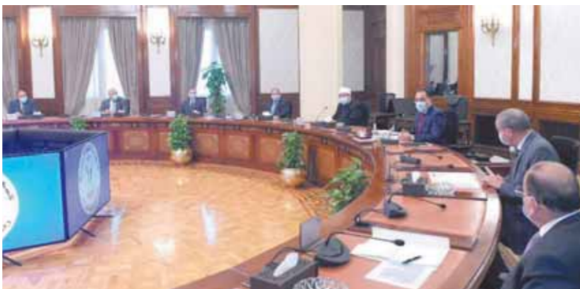
«مدبولي» يترأس الاجتماع الرابع للجنة مواجهة تأثير الأزمة العالمية الراهنة على السلع الاستراتيجية

من جانبه، أكد وزير التموين والتجارة الداخلية