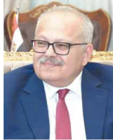
د. محمد الخشت

التصنيف يقيس أداء الجامعات بواسطة مؤشرات الويب والمؤشرات الخاصة بالبحث العلمى من خلال مواقعها الإلكترونية