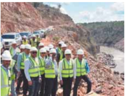
سد نيريري بسواحل مصرية

العسكري والتسليح والتدريبات المشتركة بين مصر والعديد من دول شرق إفريقيا. كما قالت الصحفية إن حماس الرئيس السيسي نحو العمل الدؤوب والمستمر نحو القارة الإفريقية لم يكن منفرداً بل دفع كل مؤسسات الدولة المصرية أن تعمل معاً لتحقيق الأهداف العليا وذات الأبعاد المستقبلية وبعيدة المدى بين مصر وإفريقيا، فعلى سبيل المثال وليس الحصر أبرزت «أفريقيا ريبورت» الدور التجاري الذي تلعبه مصر بقوة، وكذلك أدوار شركات القطاع الخاص والمتخصصة في مجالات التشييد والبناء، حيث سجلت التقارير حجم التجارة المتبادلة بين مصر والأسواق الإفريقية ٧ مليارات دولار حتى نهاية ٢٠٢٢، والتي من المتوقع أن يصل إلى ١٠ مليارات دولار بنهاية ٢٠٢٥ طبقاً لتصريحات وزيرة التجارة والصناعة الدكتورة نيفين جامع، فضلاً عن حوض مصر تجارب توليد الطاقة الشمسية والمجالات الزراعية، والتي تستخدم عليها اتفاقية التجارة الحرة «كوميسا» التي تعتبر مصر من مؤسسيها على مستوى القارة. وفي إشارة قوية إلى بناء مصر سد بوليوس نيريري في تنزانيا والمنتظر افتتاحه وتشغيله خلال العام الحالي، أكدت الصحفية نقطة التفوق المصري الذي من المنتظر بروزه بوضوح عقب تشغيل السد لتكون مصر صاحبة كود «كيف نعمل في إفريقيا».