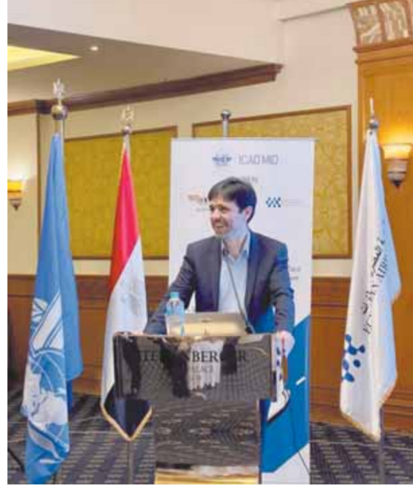
مصر تستضيف المؤتمر الإقليمي لنظم إدارة حركة الطائرات بالمطارات

وخلال جلسات المؤتمر قدم ممثل سلطة الطيران المدني المصري عرضاً توضيحياً للحلقة الوطنية للملاحه الجوية ومدى تطبيق مصر لكافة المتطلبات الدولية من خلال تلك الحلقة.. كما استعرض ممثل الشركة المصرية لخدمات الملاحه الجوية تجربة الشركة في تشغيل نظام A-SMGCS ودوره في ضمان سلامة خدمة الملاحه الجوية والحركة الأرضية داخل مطار القاهرة الدولي.. وقام ممثل شركة ميناء القاهرة الجوية بتقديم عرض توضيحي لخبرات مطار القاهرة الدولي في تطبيق النظم المتقدم في مراقبة وإدارة الحركة على أرض المهبط كواحد من أوائل المطارات في منطقة الشرق الأوسط الذي يقوم بتطبيق هذا النظام المتطور وتم استعراض تجهيزات مطار القاهرة التي تضمن تفعيل هذا النظام المتقدم بما يضمن سلامة التشغيل المطلوبة أثناء فترات الرؤية المتدهورة، مؤكداً استعداد شركة ميناء القاهرة الجوية لنقل الخبرات والتدريب والإشراف على تطبيق النظم المتقدم لمطارات دول الشرق الأوسط وأفريقيا. وأعربت الوفود المشاركة عن شكرها وتقديرها لجمهورية مصر العربية ممثلة في وزارة الطيران المدني على استضافة المؤتمر والتنظيم المتميز الذي ساهم في نجاح المؤتمر وخروجه بصورة تليق بمكانة مصر.. وعلى هامش المؤتمر تم تنظيم جولة سياحية للوفود المشاركة في المؤتمر لزيارة المواقع الأثرية