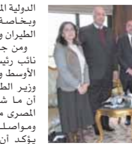
وزير الطيران وقيادات الوزارة خلال لقاء رئيس الأليات بمنطقة الشرق الأوسط وأفريقيا