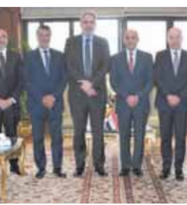
وزير الطيران وقيادات الوزارة خلال لقاء رئيس الأليات بمنطقة الشرق الأوسط وأفريقيا