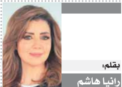
بقلم: رانيا هاشم

وزارة التموين منوط بها حماية الناس من هذا الجشع الذى يمارسه التجار سواء كانوا جملة أو تجزئة. ارحموا الناس من هذا الغلاء الفاحش وكفاهم تعديلاً على مدار عقود طويلة من الزمن، قبل ثورة ٣٠ يونيو، ولدى الفتنة الكاملة أن كل هذه الإجراءات من الحماية الاجتماعية التى تقوم بها الحكومة لمت دوراً مهماً داخل الأسواق، ولكنها تحتاج إلى المزيد رحمة لحال الناس. wagdyzeineldeen@yahoo.com