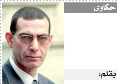
بقلم: د. وحدى زين الدين

من مديونيات أم تسويات بتسديد أجزاء من هذه المديونيات، والواضح أن كل الأندية سددت جزءاً من المديونيات وليس المديونية بالكامل، فلماذا رفض المسؤولون في الاتحاد الحصول على شيك بجزء من المديونية لدى الزمالك؟ رابعاً: ما الموقف إذا تمسك الاتحاد بموقفه وقام الزمالك باللجوء إلى الفيفا لتسجيل اللاعبين، خاصة أنه قام بوضع الأسماء على السيستم قبل غلق الباب. هل نحن في حاجة إلى المزيد من وضع الرياضة المصرية في صورة جديدة من أنواع النزاع الكورى. بعد أن أصبحت كرة القدم المصرية مائة دسمة للأزمات سواء في الفيفا أو المحكمة الرياضية الدولية؟ ألم يكن من الأفضل أن يصدر اتحاد الكرة بياناً منذ اللحظة الأولى بوضع فيه الأمر بصورة متكاملة حتى يقطع الباب على اجتهاادات البعض وبث الفتنة بين الجماهير؟ ألم يكن من الأفضل أن يقول الاتحاد في بيانه صراحة: هل من حق الزمالك تفعيل قيد اللاعبين على السيستم فور دفع المديونية، أو قطع الطريق على أى اجتهاادات والتأكيد على عدم حق الزمالك في قيد اللاعبين حتى ولو سدد المديونية للاتحاد؟ ما حدث هو مزيد من تجاهل اللوائح، ومزيد من إثارة الفتنة بين الجماهير، ومزيد من إثارة اللغط بسبب ضيق الخبرة داخل المؤسسات الرياضية، ومزيد من التخبط وشتم الرياضة المصرية في الخارج.. استقيموا بريحكم الله.