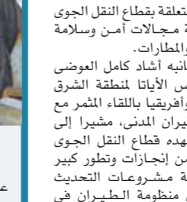
وزير الطيران وقيادات الوزارة خلال لقاء رئيس الأليات بمنطقة الشرق الأوسط وأفريقيا

وخلال اللقاء ناقش الجانبان سبل تعزيز التعاون والتنسيق الدائم بين مصر والإمارات وسبل الاستفادة من الخبرات المصرية وخاصة في مجال المراقبة الجوية التي حققت نجاحاً كبيراً في تنظيم وإدارة الحركة الجوية بالمجال الجوي المصري خلال قمة المناخ COP27 وهو ما كان محل إعجاب وتقدير بمنظومة المراقبة الجوية في مصر محلياً وإقليمياً ودولياً.