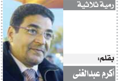
بقلم: أكرم عبد الغنى