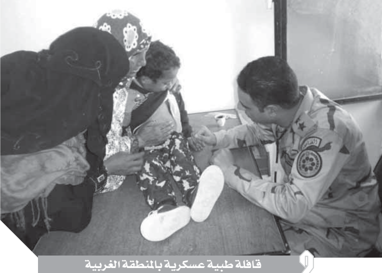
قافلة طبية عسكرية بالمنطقة الغربية