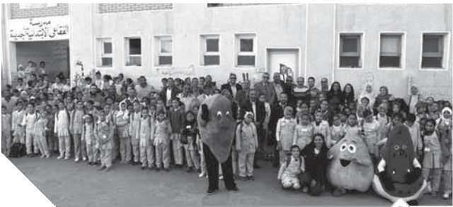
جانب من الطلاب المشاركين