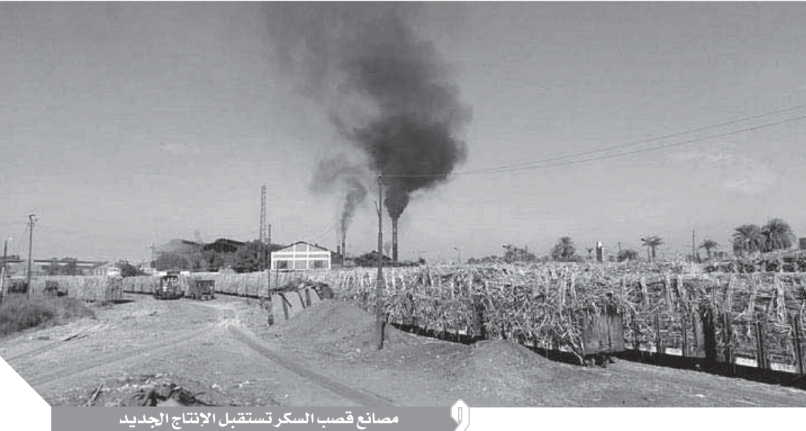
مصانع قصب السكر تستقبل الإنتاج الجديد

الجدير بالذكر أن مصنع نجع حمادى يعد من أكبر المصانع إنتاجاً لسكر داخل المحافظة، يليه مصنع قوص، ويقوم مصنع نجع حمادى بتغطية مراكز شمال محافظة قنا المنزرعة بقصب السكر، وهى مراكز نجع حمادى الوقف وفرشوط وأبو تشت والقرى التابعة لها، فى حين يخدم مصنع سكر قوص مراكز جنوب محافظة قنا، وهى مركز قوص وقفت وقادة والقرى التابعة لهما، كما يغطى مصنع سكر دشنا، مناطق شرق النيل بوسط المحافظة.