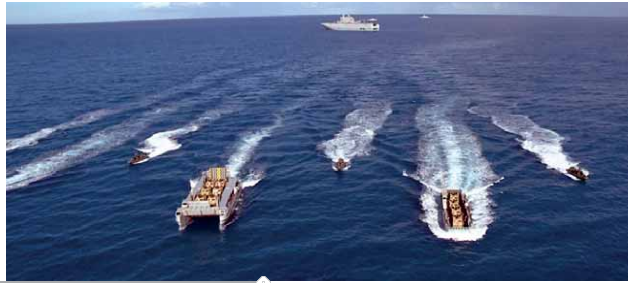
مناورة بحرية بمجموعات قتالية شملت حاملة مروحيات وغواصات وزوارق وصواريخ