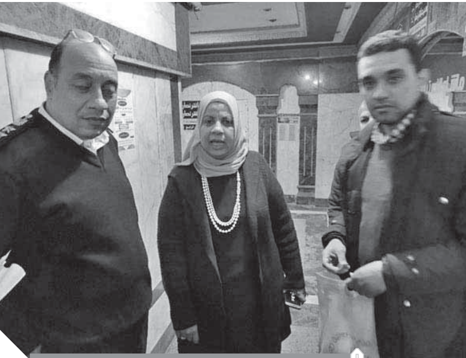
تشجيع المركز الطبى للنساء والولادة بالفيوم

وفى حالة المخالفة الأولى تضبط العربة وتغريم صاحبها ٥٠٠ جنيه، وفى حالة المخالفة الثانية تضبط العربة ويتم مصادرتها لصالح الوحدة المحلية لمركز ومدينة إدفو، وقامت إدارة السياحة والنقل الباطى بالوحدة بالتنسيق مع مكتب شئون البيئة بتحرير عدد ٥٧ محضر بيئة إلقاء روث الخيول بعيدا عن الأماكن المخصصة لذلك وبالطريق العام مما تسبب فى تلوث البيئة مخالفين القانون رقم ٤ لسنة ١٩٩٤ فى شأن حماية البيئة ولائحته التنفيذية.