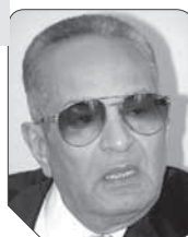
بهاء الدين أبوشقة