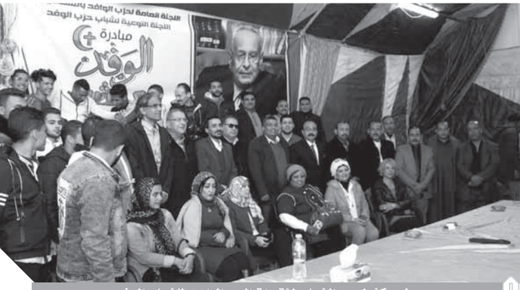
حضور كثيف من الشباب لمؤتمرات اليوم الواحد للشباب الوفدى