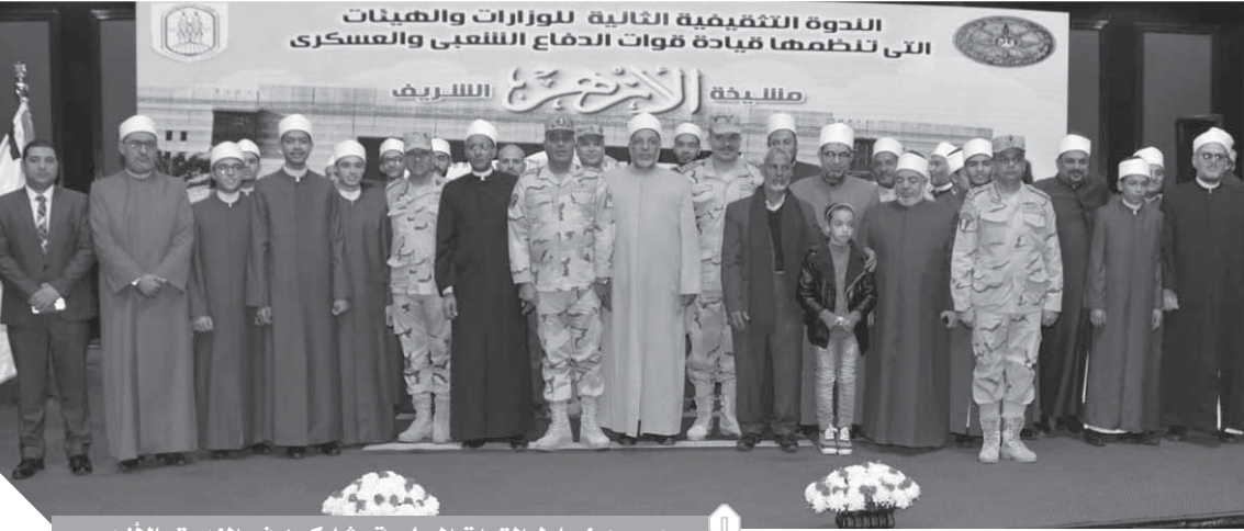
عدد من ضباط القوات المسلحة يشاركون في الندوة بالأزهر

كتب: محمد صلاح وأبو زيد كمال وسامية فاروق: