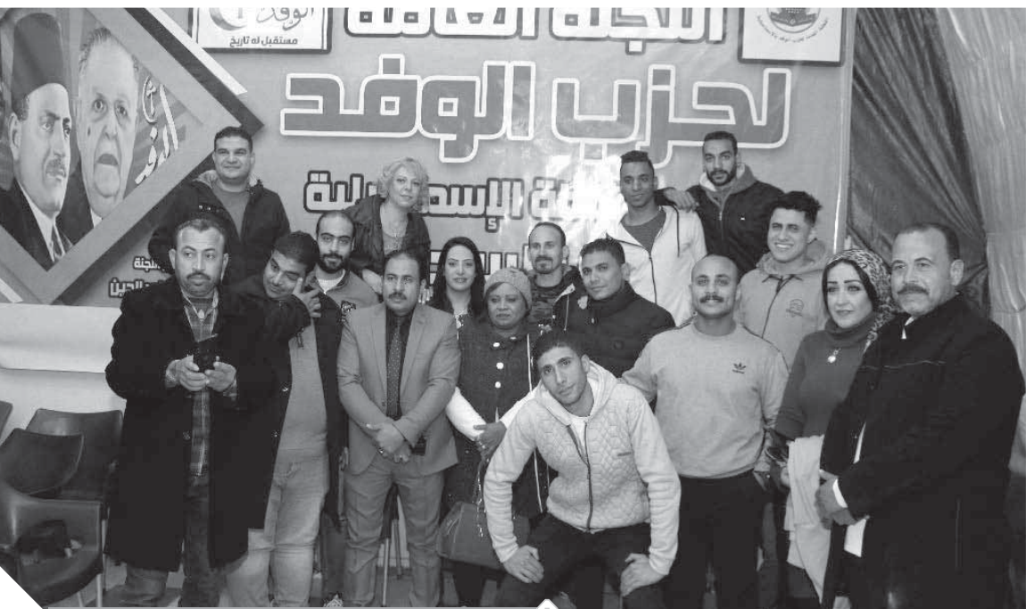
جانب من الشباب

وأضافت «عصام» أن لجنة الشباب قامت أيضًا بتشكيل لجنة للثقافة والفنون من أجل دعم المواهب الشابة، وهذا هو دور بيت الأمة وهو دعم الشباب والمرأة فى كافة المجالات ولتيسد السياسية فقط؛ لذلك حزب الوفد يتواجد وبشكل قوى فى الشارع الإسماعيلادى.