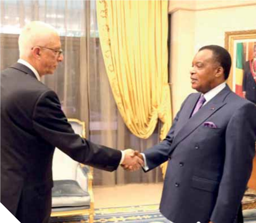
رئيس الكونغو خلال تسلمه رسالة خطية من الرئيس السيسى

وحذرت مصر من مغية أى تدخل عسكرى تركى فى ليبيا وتداعياته، وأكدت أن مثل هذا التدخل سيؤثر سلباً