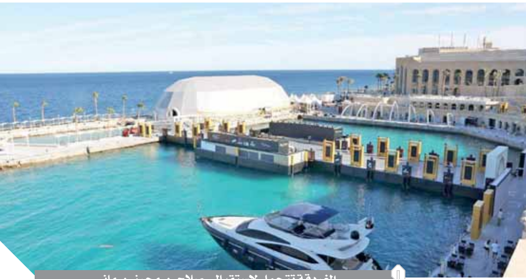
الغردقة تتجمل لاستقبال «صلاح»، «محرز»، و«مانى»