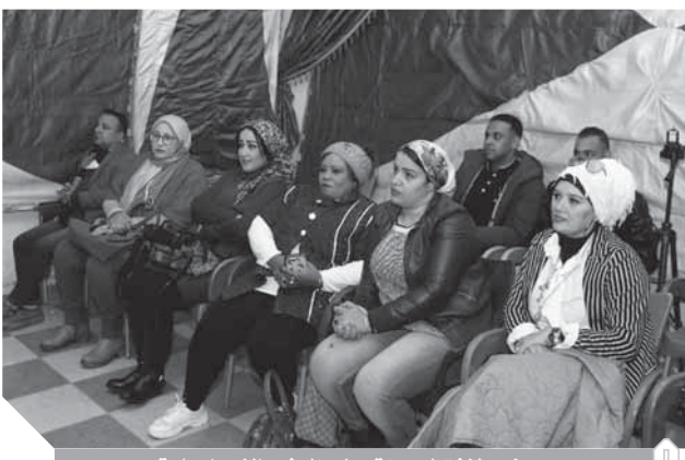
حضور لافت لسيدات حزب الوفد بالإسماعيلية