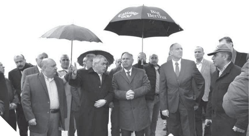
وزير النقل يتجوله في ميناء الإسكندرية