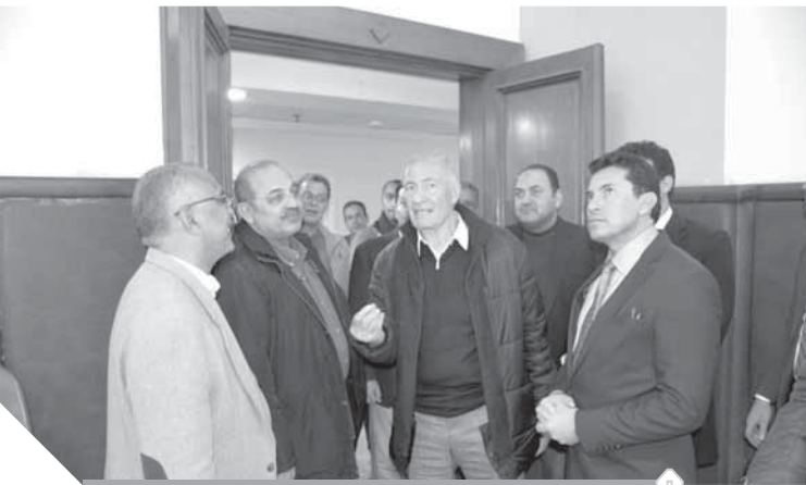
وزير الرياضة و حسن مصطفى يتفقدان المركز الأولمبى

كما أكد الدكتور أشرف صبحى على التسبب والمتابعة مع اللجنة الأولمبية المصرية والاتحادات الرياضية للأطمئنان على جاهزية جميع لاعبي المنتخبات القومية لمختلف البطولات، وتوفير كل المتطلبات اللازمة لهم، واستضافة تدريباتهم ومعسكراتهم فى المنشآت الرياضية التابعة للوزارة.