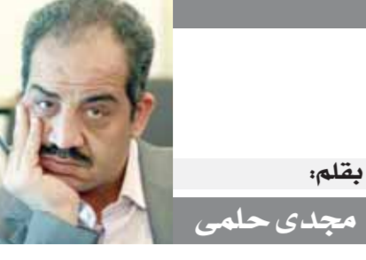
يقلم: مجدى حلمى

مما ٧٥ سنة كانت قد غرست فيها روح المقاومة منذ نعومة أظفارها.. فهي مثل الكثير من الأمهات الفلسطينيات اللاتي يربين أبنائهن على أنهم مشروع شهيد، مؤكدة: «نحن لا نهاب الموت لكن ما يؤلني بعدى عن أهلي.. فلم أعلم عنهم شيئاً ولو كنت موجودة معهم فسأكون أفضل حتى لو استشهدت معهم.. كفيها من الفلسطينيات تحرس فدوى على التواصل مع غيرها من السيدات الفلسطينيات المقيمات في مصر، لاملطماناً على أحوال ذويهم في فلسطين، حتى قالت لها إحدى صديقاتها إن عائلتها