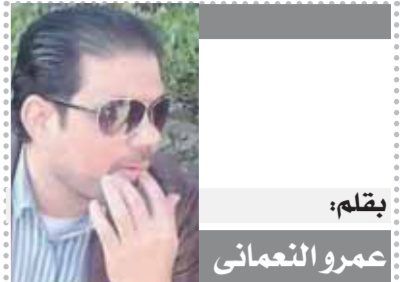
بقلم: عمرو التمامي