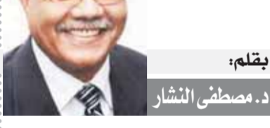
بقلم: د. مصطفى النشار