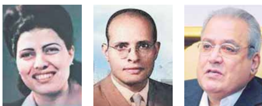
سميرة موسى جمال حمدان جابر عصفور

والعربية أيضاً عرفاناً بجهوده في تأسيس المركز القومي للترجمة، الجائزة الثانية «الدراسات الإنسانية والعلوم الاجتماعية» باسم «جائزة جمال حمدان للترجمة» في مجال الدراسات الإنسانية والعلوم الاجتماعية، وجاء اختيار اسم العالم الكبير جمال حمدان لكونه أحد أهم أعلام الجغرافيا في القرن العشرين، الجائزة الثالثة «الثقافة العلمية وتيسيط العلوم» باسم «جائزة سميرة موسى للترجمة» في مجال الثقافة العلمية وتيسيط العلوم، وذلك للاحتفاء بأول عالمة ذرة مصرية، كما تم تخصيص ثلاث جوائز تمنح للمترجمين الشباب بالترتيب التالية (المركز الأول): خمسة وعشرون ألف جنيه، المركز الثاني: خمسة عشر ألف جنيه، المركز الثالث: عشرة آلاف جنيه) وذلك بدلاً من جائزة واحدة لإتاحة الفرصة لأكثر عدد من المترجمي الشباب للتقدم وزيادة فرص التميزين منهم في الفوز وأيضاً تعديل شرط السن إلى أربعين عاماً.