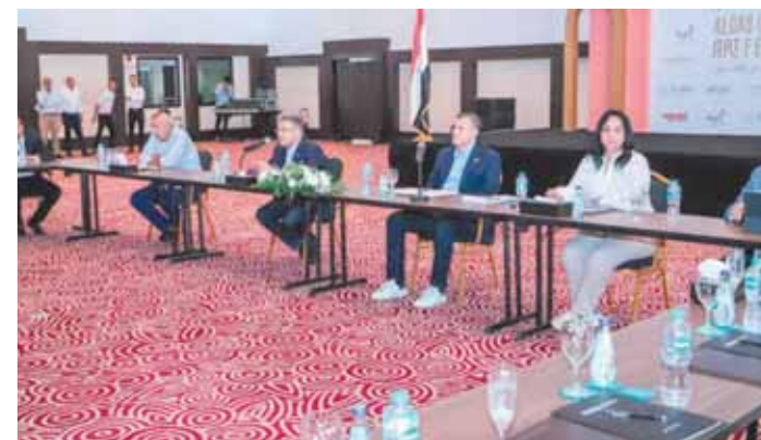
وزير السياحة خلال لقائه مع جمعية مسترمي البحر الأحمر