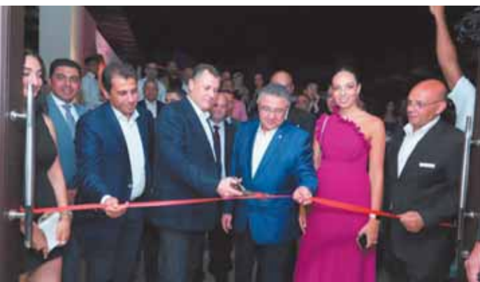
خلال افتتاحه للمهرجان الدولي للفنون