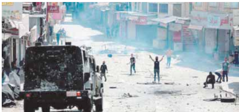
الضفة على موعد مع انتفاضة ثالثة.. مواجهات دامية بين الفلسطينيين والمستوطنين في محيط الحرم الإبراهيمي

ووصف قاضي قضاة فلسطين مستشار الرئيس الفلسطيني للشؤون الدينية والعلاقات الإسلامية محمود الهباش ما يجري في الأراضي الفلسطينية بأنه تصعيد خطير يسيء من خلاله الاحتلال إلى توظيف الدم الفلسطيني في الانتخبات الإسرائيلية لكسب أصوات الناخبين في مجتمع يتحول أكثر نحو التوحش والإرهاب والرغبة العارمة في القتل والتدمير.