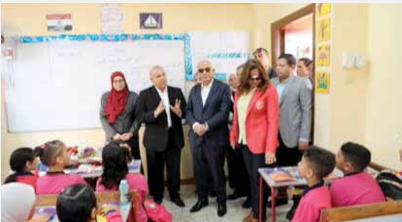
الدكتور رضا حجازي يتابع انتظام الدراسة

بهما في المدرسة ويحفظ بسجل زيارات الموجهين في مكتب مدير المدرسة وتضمنت التعليمات عدم السماح لإدارة المدرسة لغير الزائرين بكتابة تقرير الزيارة ولا يسجل إلا في ذات يوم الزيارة وعدم السماح بكتابة زيارتين في صفحة واحدة بالسجل الموحد مع توقيع المعلمين على الزيارة بالمعلم. وتقوم التوجيهات الفنية للمواد الدراسية بالإدارات التعليمية بمتابعة تنفيذ الجيد للتقويم الشامل وقياس مستوى التلاميذ ونواتج التعلم وتنفيذ خطة الدراسة وتفعيل الأنشطة المصاحبة للمواد الدراسية ومتابعة التقويمات الشفوية والأعمال التحضيرية للتلاميذ وتقويمات قياس المستوى والبرامج العلاجية للطلاب الضعاف. والمسابقات الفنية والثقافية وأوائل الطلاب ووضع الحلول