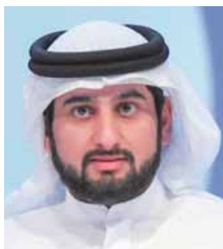
الشيخ أحمد بن محمد

والتكنولوجيا وتعزيز الثقة بوسائل الإعلام الإخبارية، وإعادة تشكيل المشهد السياسي في المنطقة، وصناعة الإعلام.. هل لها مستقبل، ومستقبل القلم العربي، ومستقبل الإعلام في عصر الميتافيزيقا.. ويتناول المنتدى التجربة المصرية الرائدة في مجال الصحافة، وأثرها عربياً وملاحم مستقبلها في جلسة بعنوان «مستقبل الصحافة المصرية..» ويعرض للمشهد الصحافي الخليجي في جلسة «الإعلام العربي ٢٠٢٢- وجهه نظر خليجية..» وجلسة «تمكين الإعلام العربي.. فرص ناشئة» وجلسة «مستقبل المنصات الرقمية» و«إعلام لبنان: من العصر الذهبي إلى آين».. وجلسة «الدراما على عرشها..» والتغير المناخي ودور