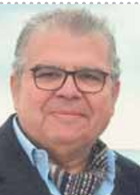
يقلم: محمد دياب

في سياق متصل، دخل نادي طلائع الجيش في الصورة، وبدأت تحركات من مجلسه للمطالبة بالمشاركة في الكونفيدرالية الأفريقية بدلا من الكاف فرصة لتحديد موعد القرعة مع نهاية شهر أغسطس الجاري، وقتها ستضخ الصورة بالنسبة للأندية المصرية، أما في حالة إجراء القرعة منتصف الشهر الجاري، سيكون هناك فرصة أيضاً بوضع اسمى الناديين المصريين «نادى مصرى ١» و«نادى مصرى ٢»، دون تسمية، حتى يتم تحديدهم بنهاية الشهر، مع كتابة تعهد من الاتحاد المصري بعدم تكرار الأمر في الموسم الجديد.