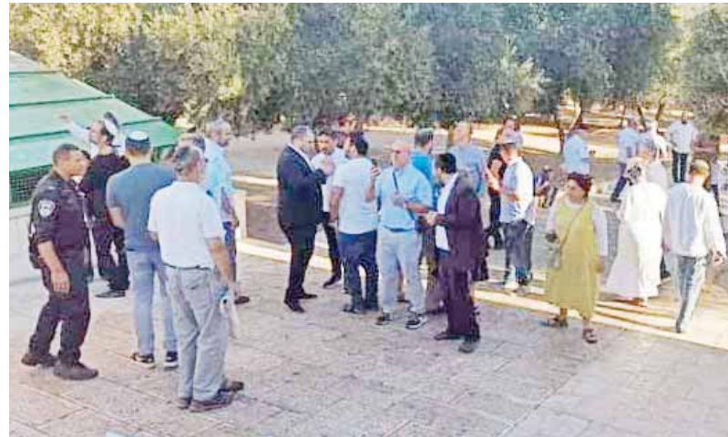
اقتحام المستوطنين للمسجد الأقصى

الاحتلال يرصد ١٤٨ مليون دولار لتطوير منظمة الليزر لاعتراض الصواريخ ويفلق غرزة