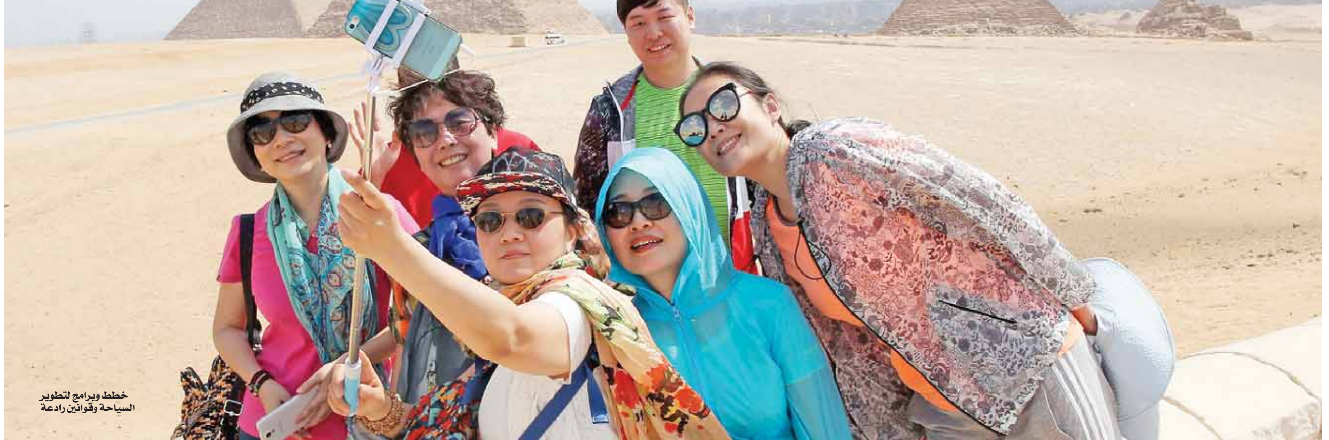
خطوط وبرايم لتطوير السياحة وقوانين رادعة