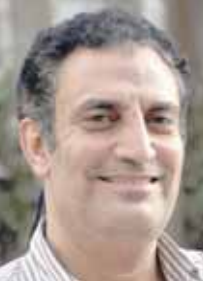
يقلم: صبري حافظ

أقر مجلس إدارة النادي الأهلي برئاسة محمود الخطيب، عملية انتقال إدارة كرة القدم وأنشطتها إلى شركة كرة القدم بشكل رسمي مع مطلع شهر سبتمبر المقبل. وتأخرت هذه الخطوة لشهرين كاملين بسبب التأخر في الحصول على بعض الموافقات الحكومية والإجراءات التي عطلت هذه الخطوة بعض الشيء، ولكنها تمت بشكل نهائي بعد جلسة مطولة دارت بين مجلس الأهلي ومجلس إدارة شركة كرة القدم برئاسة رجل الأعمال ياسين منصور. ومن المنتظر أن يحسم ياسين منصور بشكل رسمي منصب المدير الفني لريكاردو سواريش المدير الفني للفرق الاحمر عقب نهاية الموسم الحالي. ورغم أن الأهلي يتعاقد مع سواريش منذ عدة أسابيع فقط إلا أن شركة كرة القدم ستحسم تعيين المدير الفني بعدما فشل سواريش في تقديم أوراق اعتمادته خلال الفترة الماضية. وعقد محمود الخطيب رئيس النادي الأهلي، والذي سيكون منسقا بين إدارة القلعة الحمراء وشركة الكرة جلسة مطولة مع سواريش وحصل على بعض التقارير الفنية الخاصة بتقييم لاعبي الفريق والخطط المطلوبة على التعاقد مع ٥ صفقات واستقرت شركة كرة القدم على المهمة وعلى رأسها ٢ سوبر سينم إعلانها مع بداية تولى المهمة وعلى رأسها ٢