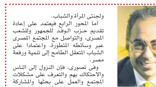
بقلم: د. هانى سرى الدين