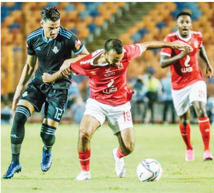
الأهلى وبييراميدز في صراع على مقعد الأبطال

بدورى الأبطال. ومع مد باب القيد الأفريقي لنهاية الشهر، وعدم تحديد موعد القرعة حتى الآن، سيكون لدى الكاف فرصة لتحديد موعد القرعة مع نهاية شهر أغسطس الجاري، وقتها ستضخ الصورة بالنسبة للأندية المصرية، أما في حالة إجراء القرعة منتصف الشهر الجاري، سيكون هناك فرصة أيضاً بوضع اسمى الناديين المصريين «نادى مصرى ١» و«نادى مصرى ٢»، دون تسمية، حتى يتم تحديدهم بنهاية الشهر، مع كتابة تعهد من الاتحاد المصري بعدم تكرار الأمر في الموسم الجديد.