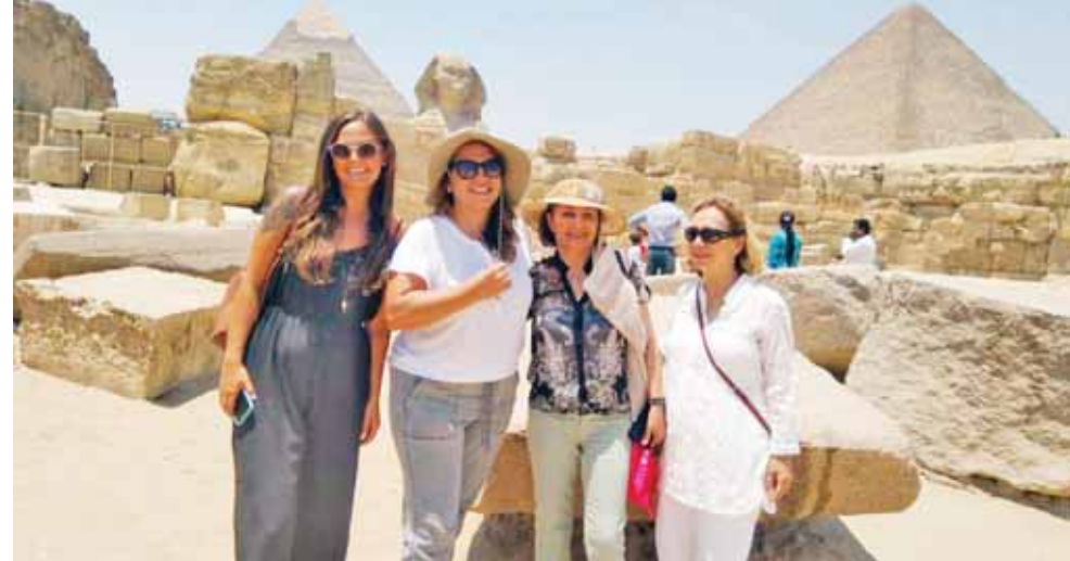
مطالبات بزيادة إجراءات السلامة والأمان لمواجهة المضايقات والاستغلال