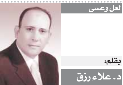
بقلم: لعل وعسى