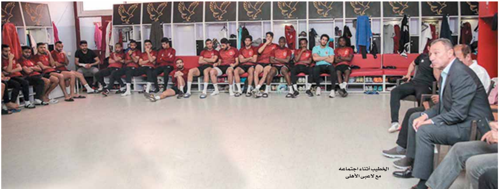
الخطيب أثناء اجتماعه مع لاعبي الأهلي