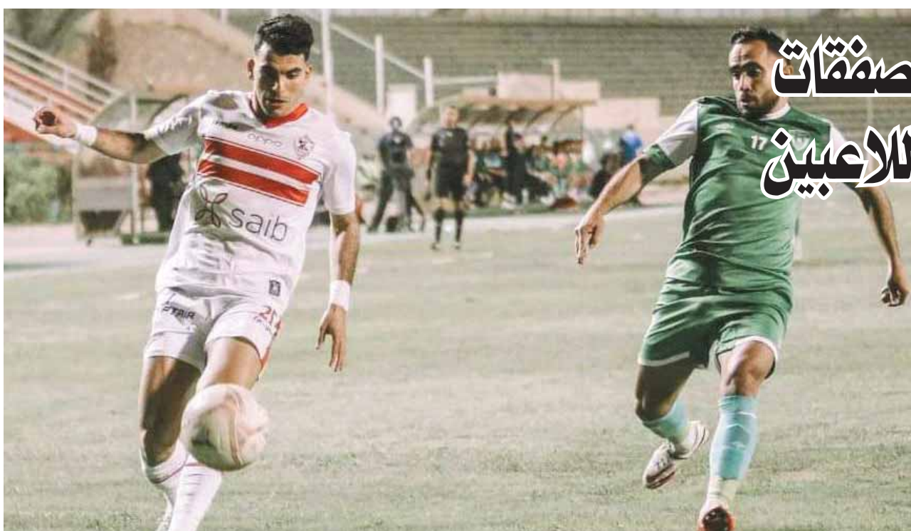
الزمالك يسير بخطى جيدة فى الدورى

رئيس المنتدى الاستراتيجى للتنمية والسلام