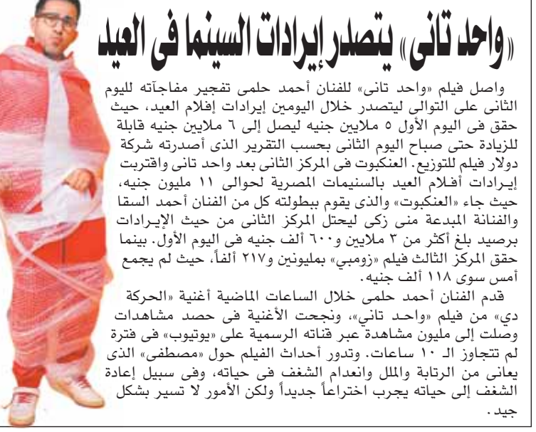
«واحد تانى» يتصدر إيرادات السينما فى العيد

كتبت - نجوى عبدالعزيز: أمرت النيابة العامة بحبس متهم ٤ أيام على ذمة التحقيقات لاتهامه؛ بالتعرض لآثى بأمور وتلميحات جنسية بالإشارة والقول والفعل، بقصد الحصول على منفعة جنسية منها، وتقديمه إلى محاكمة جنائية عاجلة. وكانت وحدة الرصد والتحليل بإدارة البيان بكتب النائب العام، قد رصدت مقطعاً مصوراً لهم يعرض بمواقع التواصل الاجتماعى ظهر فيه خلال ارتكابه الجريمة باحدى وسائل التفرح، وبالتزامن مع تداوله تقدمت المجنى عليها ببلاغ تضمرت فيه