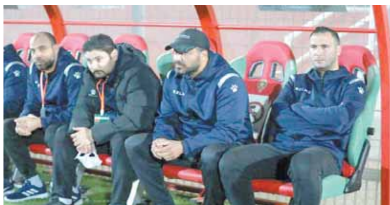
الجهاز الفنى للمصرى على كف عصريث