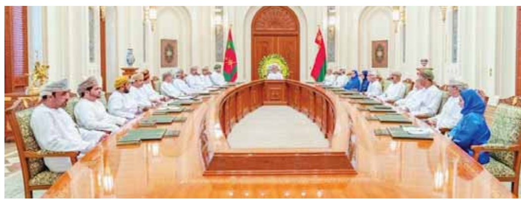
لقاء السلطان هيثم بن طارق مع أصحاب وصاحبات الأعمال من المشروعات الصغيرة والمتوسطة