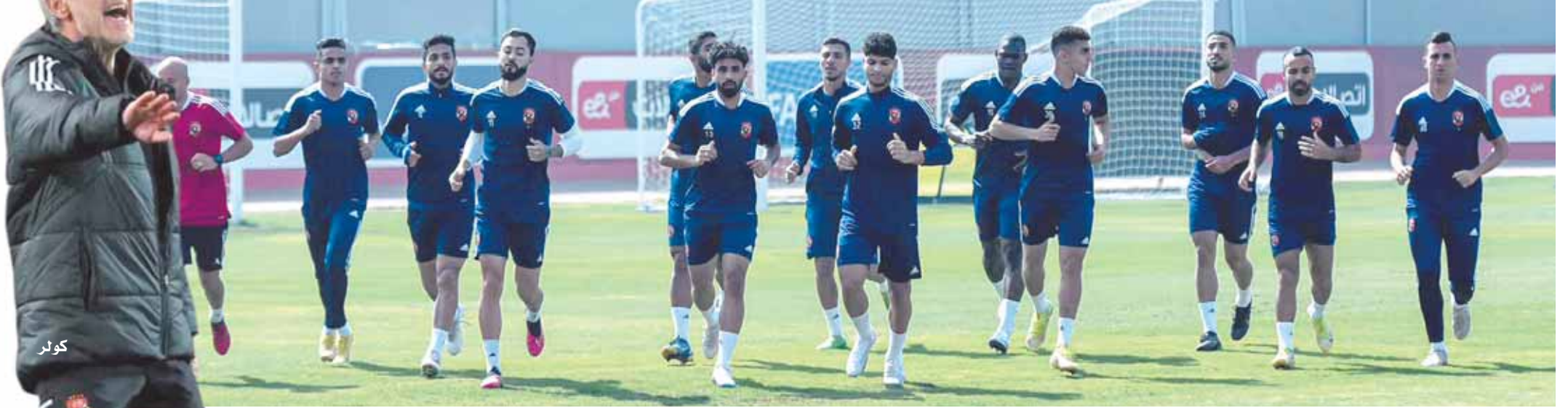
الأهلى جاهز لمواجهة القطن

«كولر» يتحدى الغيابات.. ورسائل «الخطيب» تشعل حماس اللاعبين