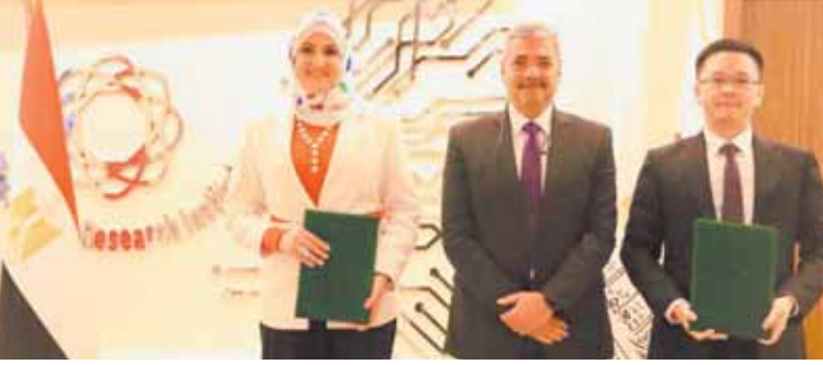
جانب من توقيع الاتفاق