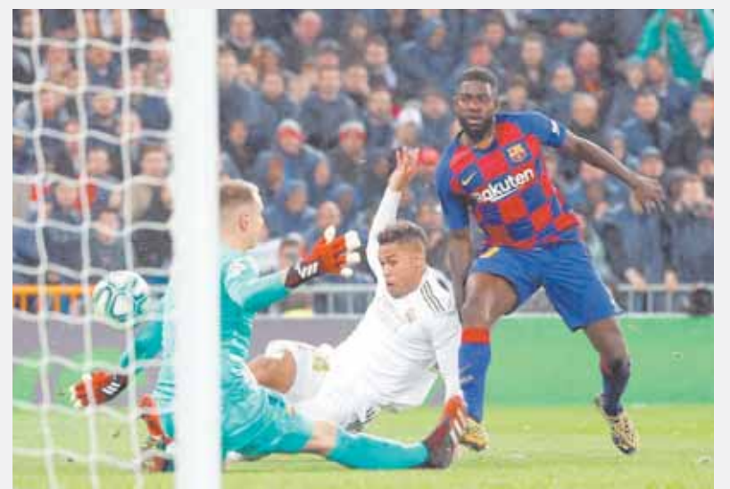
هدف برشلونة في مرمى الريال

وزاد: «من المفاجئ أن نرى برشلونة يلعب بهذه الطريقة، لكنهم تعلموا الدفاع بشكل جيد للغاية، ونحن فقدنا الكثير من الكرات. وأكد لوكا مودريتش لاعب وسط ريال مدريد أن برشلونة لا يستحق الانتصار، وقال في تصريحات نقلتها صحيفة «موندو ديبورتيفو» الإسبانية: «اعتقد أننا كنا أفضل، لكننا خسرن في النهاية.. نأمل في تصحيح الأمور خلال مواجهة الإياب».