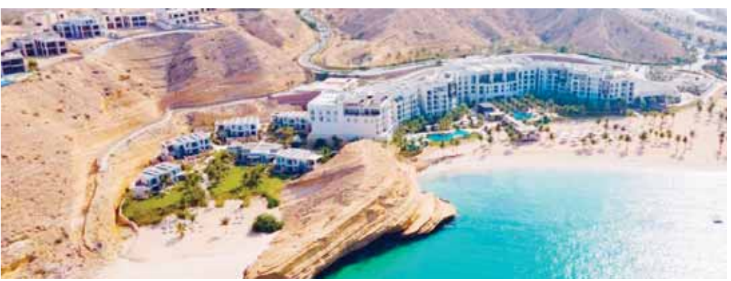
شراكة القطاع الخاص تعزز خطط تقدم سلطنة عمان