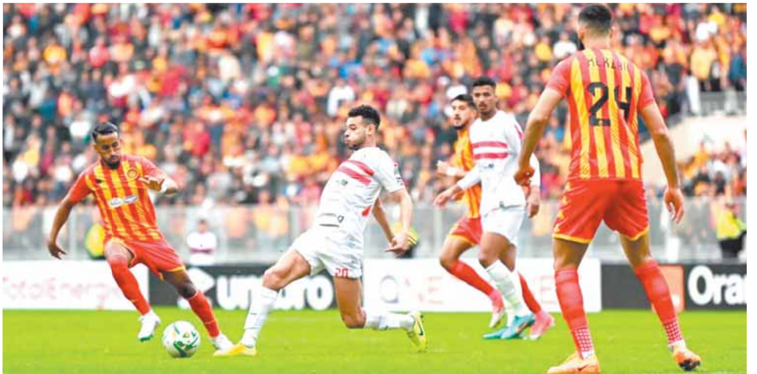
الزمالك طلب حضوراً جماهيرياً مكثفاً لمباراة الترجي