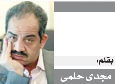
بقلم: مجدى حلمي