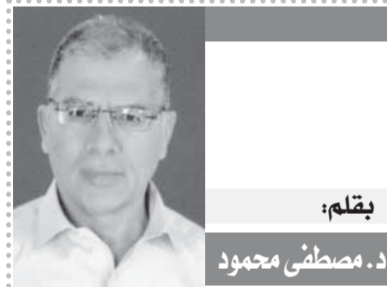
بقلم: د. مصطفى محمود