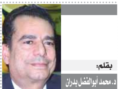
بقلم: د. محمد أبو الفضل بدران