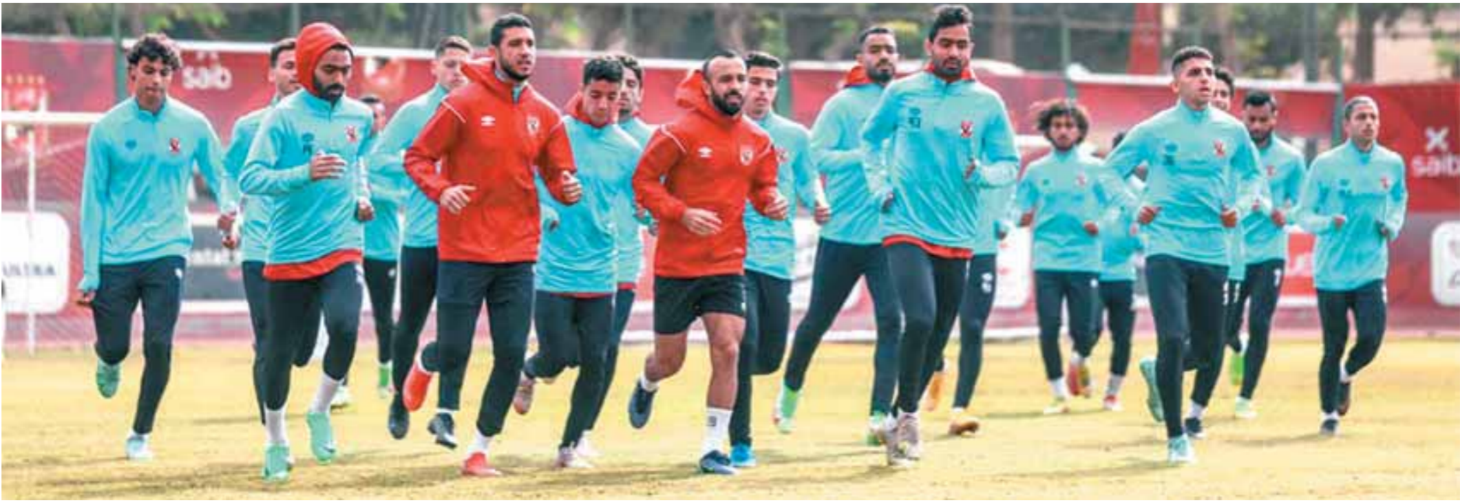
الأهلى يخوض مرانته استعداداً لمواجهة مونتيري