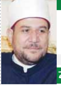
بقلم: د. محمد مختار جمعة