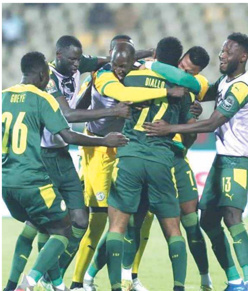
احتفال لاعبي السنغال بالتأهل لنهائى أمم أفريقيا

بالتأهل للمباراة النهائية متمنياً حصد اللقب القارى مع أسود التيرانجا. وأوضح أنه يحقق الفوز باللقب القارى مع زملاءه بغض النظر عن هوية منافسهم القادم فى النهائى مؤكداً أن الجميع لديه الحافز لتحقيق الفوز بكأس الأمم.