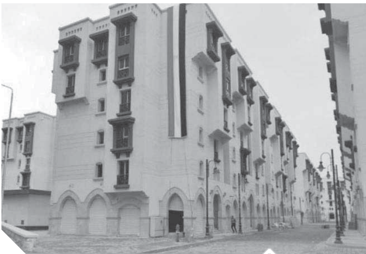
تطوير تل العقارب وتحويلها إلى روضة السيدة زينب

فى واحدة من أخطر العشوائيات وهى «غيط الغنب» سابقاً، وذلك قبل أن تتحول لنموذج جيداً ونقطة حضارية هى الأولى من نوعها بحيث تحولت هذه المنطقة بفضل إرادة الدولة