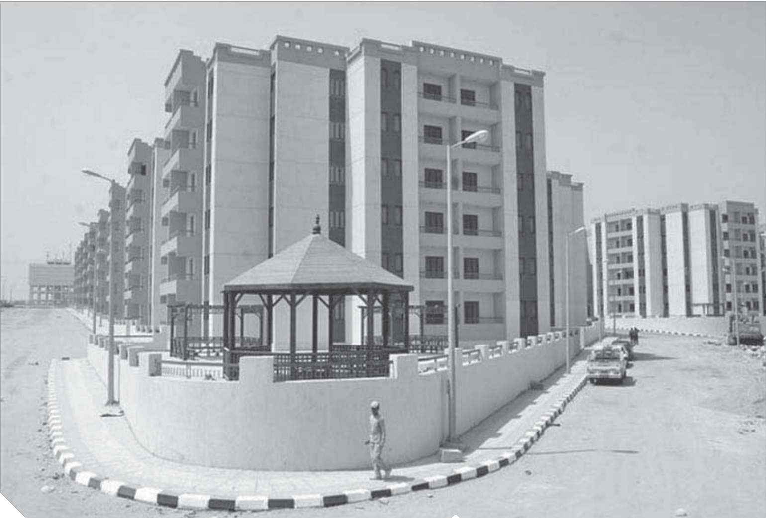
مبان حديثة على أعلى طرز لساكن العشوائيات