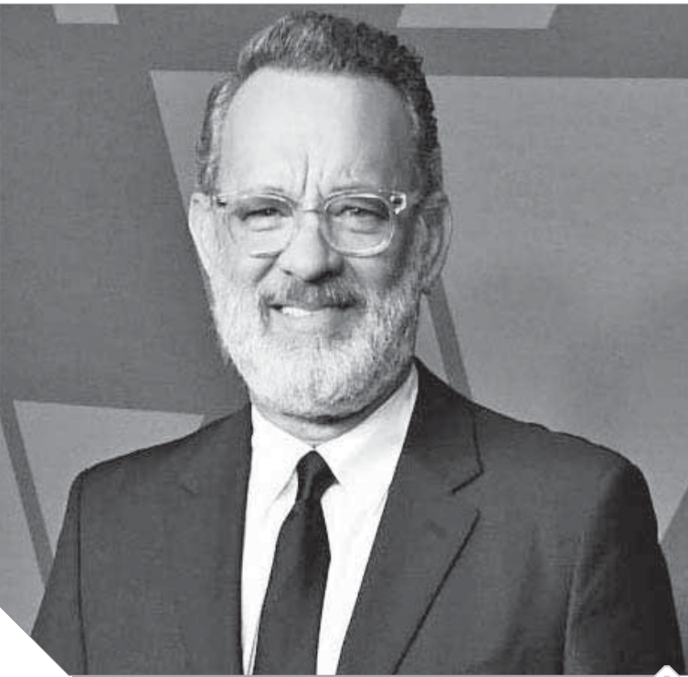
الممثل الأكثر تواضعا في العالم توم هاتكس

الإنساني، وله العديد من التجارب والمواقف التي جعلت حياة أناس عاديين وبسطاء أفضل، لأنه لم ينس أبدا أنه قادم من بيئة متواضعة وبسيطة، فهد يد العون والخير والمساعدات لكثير من الفقراء والجمعيات الخيرية، بجانب مواقفه المشهودة، فبينما كان يصور مشاهد أحد الأفلام، عجزت عروس وولدها عن الوصول إلى الكنيسة بسبب مُمَدَّات التصوير، فواقف التصوير تماما ورافقهما حتى وصلا إلى هناك، ومرة أخرى