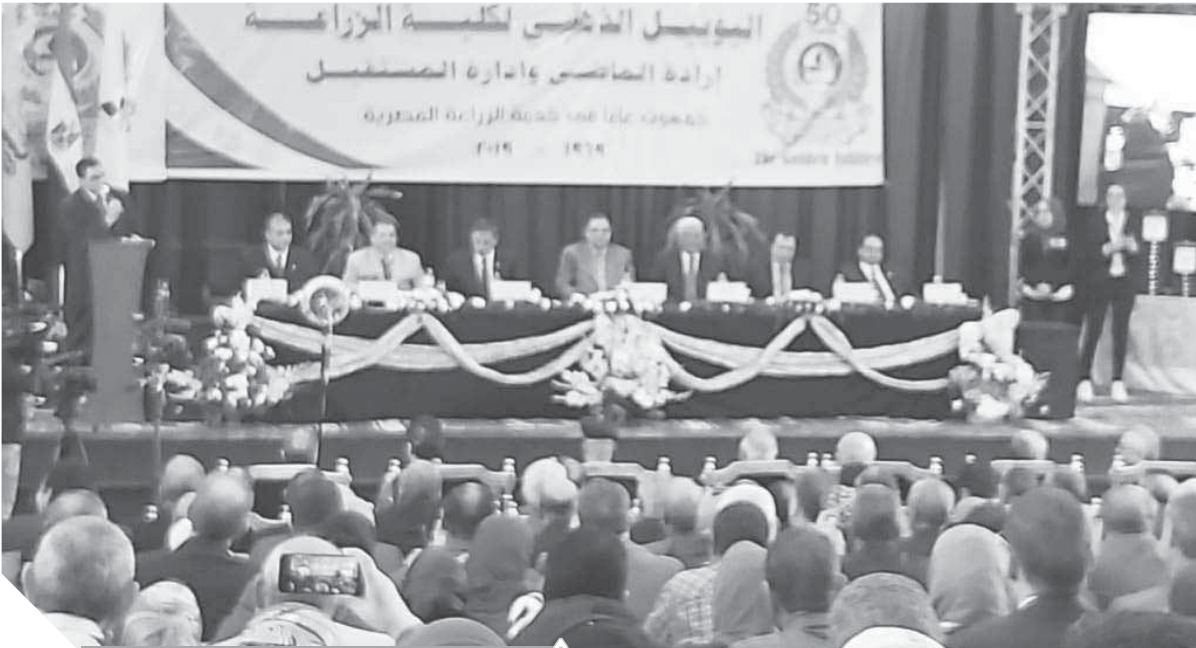
جانب من الاحتفالية

مارس وأبريل ٢٠١٦ لسن الستين والورثة، ومعاشر شهور مارس وأبريل ومايو ويونيه ٢٠١٦ للزملاء المحولين على البنوك وأوضح أنه سيتم إرسال المبالغ إلى فروع النقابة بالمحافظات وإلى البنوك خلال الأيام القليلة المقبلة.