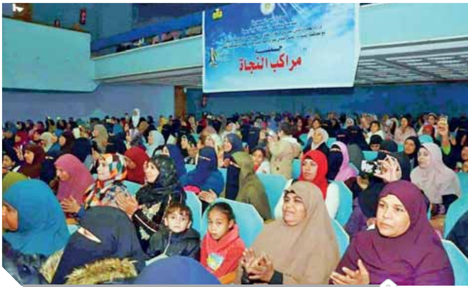
المشاركون في مبادرة مراكب النجاة

الهجرة غير الشرعية وتأهيل وتدريب الشباب، انطلقت المبادرة أولا بمحافظة الفيوم تحديدا قرية تطون بمرکز أطسا، التى تعد من القرى الأكثر تصديرا للهجرة غير الشرعية، حيث تعرض أكثر من ١٦٠ شابا من القرية للغرق.