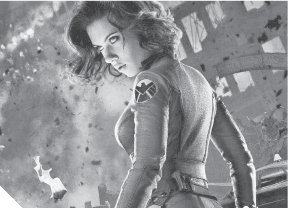
فيلم Black Window بطولة جاك جادون