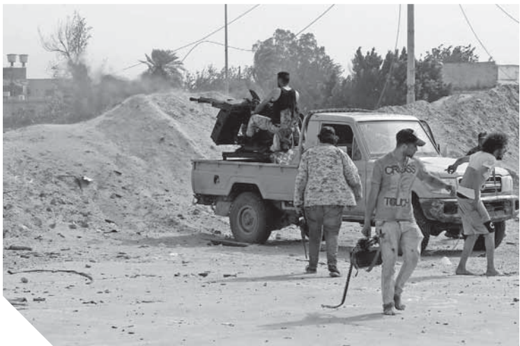
التدخل التركى يشعل الحرب فى ليبيا