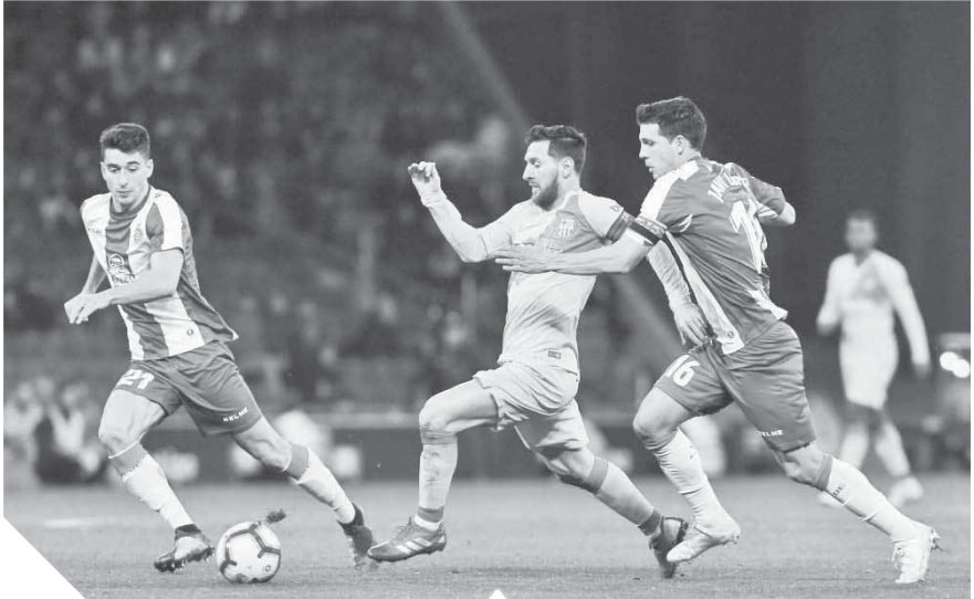
برشلونة يواجه اسبانيول

الخامسة، خارج الديار.. وفى السابعة والنصف يواجه مانشستر يونايتد نظيره ولفرهامبتون، وفى نفس التوقيت يواجه ليستر سيتى فريق ويجان أثلتيك الذى يلعب له المصرى سام مرسى.