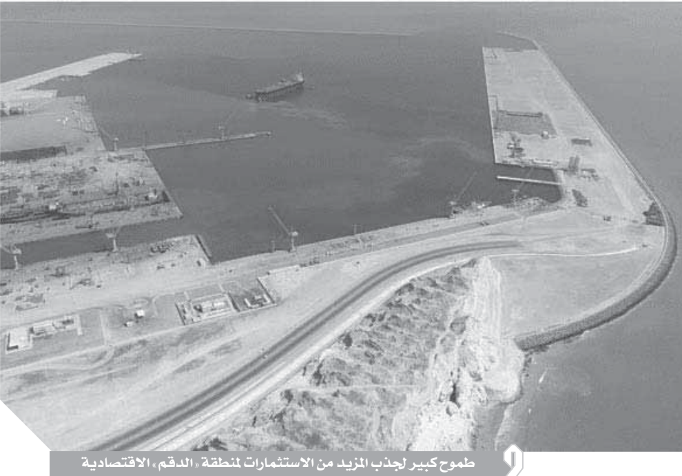
طموح كبير لجذب المزيد من الاستثمارات لمنطقة «الدقم» الاقتصادية

ومن يشائر خير العام الجديد أيضاً، وفي أول شهر يناير الجاري، كان أول قرار للسلطان قابوس بالتصديق على الميزانية العامة للدولة للسنة المالية ٢٠٢٠، والذي أوضح أن جملة الإيرادات المقدرة للموازنة العامة للدولة خلال العام الجديد حوالي ١٠,٠ مليار ريال عماني بزيادة بلغت ٦٪ عن الإيرادات المقدرة للعام الماضي، وتم احتساب الميزانية الجديدة على أساس سعر النفط ٥٨ دولاراً للبرميل. وقد شهد عام ٢٠١٩ العديد من الإنجازات المتنوعة في سلطنة عُمان، ساهمت تلك الإنجازات بشكل كبير في مواصلة مسيرة