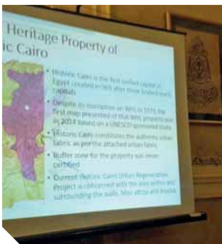
جانب من ندوة مناقشة مشروع الإحياء العمرانى للقاهرة التاريخية

احتفل محرك البحث «جوجل» أمس الجمعة، بذكرى ميلاد العالم المصرى الراحل نبيل على الذى رحل عن عالمنا قبل أربعة أعوام. وزينت واجهة الصفحة العربية من جوجل صورة رسمية للعالم المصرى الراحل الذى ولد فى ٣ يناير عام ١٩٢٨ فى القاهرة. وجاءت الصورة وسط كلمة «جوجل» باللغة الإنجليزية، وأرفقت أيضا بتصميم لجهاز حاسوب، وقال «جوجل»