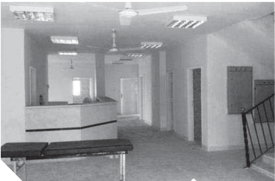
تجهيزات الطبية داخل الوحدة