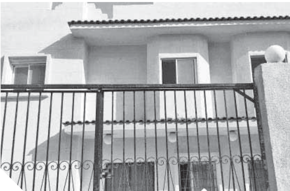
الوحدة الصحية عزية تيل مغلقة

المواطن في الوحدة الصحية. وقال الأهالي إننا نذهب إلى مستشفى كفر الشيخ العام ونقطع مسافة ٥ كيلومترات، ما يعرضنا للخطر ومضاعفات اللحالة المصابة. وطالب أهالي القرى بحصر جميع احتياجات الوحدات الصحية بالتعاون مع مسئولى الصحة في محافظة كفر الشيخ، لدعم هذه الوحدات، وتنظيم حملات مكثفة على الوحدات الصحية لضبط الأداء ومتابعة سير العمل، ومجازاة المقصرين ضماناً لتقديم خدمة طبية تليق بأهالي القرى وأديمتهم.