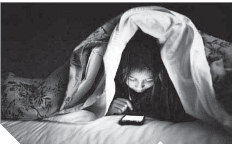
استخدام الهاتف ليلا يسبب امراضا خطيرة

أكثر من غيرهم للإصابة بالاكئاب والاعتلالات النفسية، وأوضحت الدراسة أن الجسم الطبيعي يجب أن يكون نشطا أثناء النهار وخاملا أثناء الليل، وليس العكس «وهو ما ورد بالطبع في القرآن الكريم والذي سبق نتائج هذا البحث منذ أكثر من ١٤٠٠ سنة»: «وَجَعَلْنَا نَوْمَكُمْ سُبَاتًا. وَالْأَضْوَاءَ الْمُنِيعَةَ مِنْهَا تِلْغِ الْخَ نِ سَاعَاتِ النَّهَارِ لَا تَزَالُ مَعْتَدَةً، وبهذا تخدع المخ وتسبب كل الأضرار سالفة الذكر.