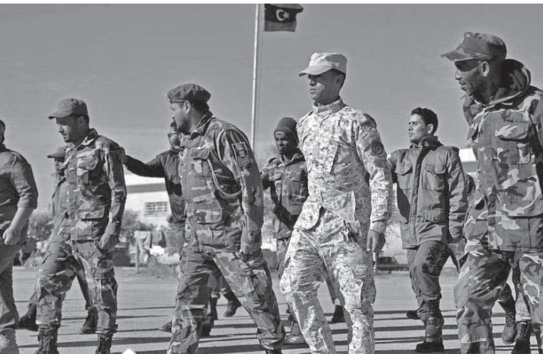
التدخل التركى يشعل الحرب فى ليبيا

وأضاف أن الجانبين تبادلوا الرؤى حول مستجدات الأوضاع الإقليمية، حيث استعرض شكرى الموقف المصرى إزاء التطورات المتسارعة على الساحة الليبية، معرباً عن إدانة مصر لقرار البرلمان التركى بتمرير المذكرة المقدمة من الرئيس التركى بنقوضه لإرسال قوات تركية إلى ليبيا، وما يمثل ذلك خلال الاتصال أهمية مواصلة التشاور من تصعيد خطير يهدد الأمن والسلم ويزيد من تعقّد الأوضاع فى ليبيا. كما أكد الجانبان مصرحاً المتحدث الرسمى باسم وزارة الخارجية، بأن الوزيرين تطلعا خلال الاتصال إلى سبل دفع أوجه التعاون الاستراتيجى بين مصر والولايات المتحدة فى شتى المجالات، بما فى ذلك قضية محاربة القضاء على الإرهاب.