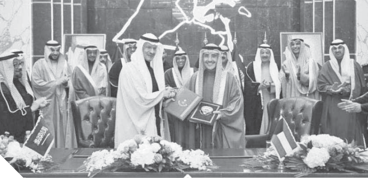
اتفاق تاريخي بين السعودية والكويت

واعتبر مجلس الوزراء الكويتي الاتفاقية مع السعودية «إنجازاً تاريخياً». وذكر نائب رئيس مجلس الوزراء وزير الداخلية وزير الدولة لشؤون مجلس الوزراء، أنس الصالح، أن مجلس الوزراء الكويتي أعرب عن «التقدير البالغ والعظيم للحلقة التاريخية بتوقيع البلدين الشقيقتين، للاتفاقية التي عدتها «تجسيدا للعلاقات الأخوية المميزة والخاصة التي تؤكد إيمان قيادتي وشعبي البلدين الشقيقتين بوحدة الهدف والمصير عبر التاريخ الممتد لسنين من التلاحم والترابط». وأضاف الصالح أن مجلس