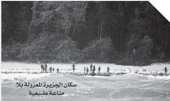
سكان الجزيرة المحزولة بالا مناعة طبيعية