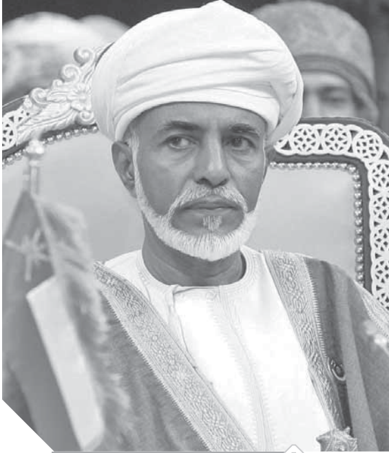
السلطان قابوس بن سعيد سلطان عُمان في حالة مستقرة