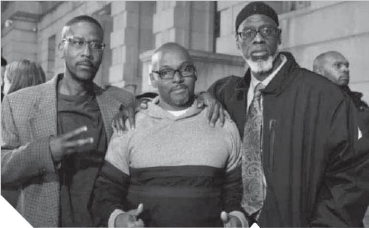
المتهمون خرجوا شيخوخا من السجن

الحكومة بولاية بالتيمور، وفقا لما نشرته فوكس نيوز، إلى أن تميززا عسيريا - سبب لون بشرتهم - تمت ممارستها ضد المتهمين لإدانتهم، وكشفت أن الشرطة والادعاء العام دربا مراهقين آخرين للإدانة بشهادات زور لإدانة الأطفال الآخرين المتهمين، كما تم إخفاء أقوال شهود والتلاعب في أدلة قضياد إدانة المتهم آخر في مقتل الطفل داكى، أنها براءة طلي انتظارها وربما لم تكن في الحسبان، وقال المتهمون: ما الفائدة قضياد أغلب أفراد أسرنا في هذه السنوات وماتت الأمهات والأباء حزنا علينا من سبوعوضنا عن كل هذا؟!