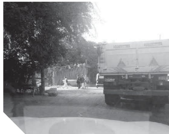
القاذورات والجاري تحاصر المنازل

ويخصص تراخيص البناء للمباني المتاخمة للأحوزة العمرانية، وبالتالي فإن الوحدة المحلية لن تزيل المباني المخالفة المتاخمة للكتلة العمرانية ويمكن لأصحاب تلك المباني التقدم للوحدة المحلية التابع لها العقار وتقديم مستندات الترخيص