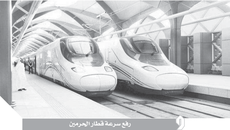
رفع سرعة قطار الحرمين

وحددت اللجنة مجموعة من المعايير الفنية الواجب توافرها في الصور التي سيتم التقاطها من أعلى من داخل المملكة، واشترطت أن يتم التقاط الصور من مكان مرتفع، ما يحقق متطلبات مسمى المعرض