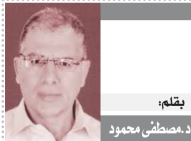
يقلم: د. مصطفى محمود

تلك المعايير التي يعاني منها مجتمعنا منذ سنوات طويلة. كلنا ينادي بالشفافية والنزاهة والمحاسبة لكن عندما تدق هذه الشفافية والمحاسبة أبواب مكاتبنا نرفضها، نريد تطبيقها على الآخرين أما نحن فلا وألف لا. تماما مثل الذين يصدعوننا بالدفاع عن حقوق الإنسان في أقسام الشرطة ثم إذا ما تعرضوا لعذبات سرقة مثلا يطالبون بدهس كل مبادئ حقوق الإنسان مقابل استرداد أشياءهم Mahmod abdelazem @yahoo.com