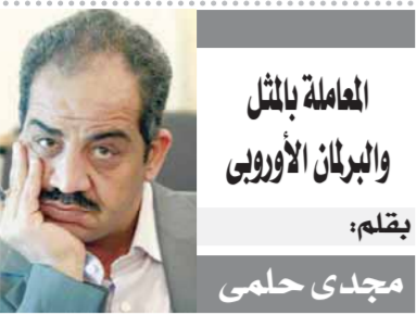
المعاملة بالمثل والبرلمان الأوروبي يقلم: مجدي حلمي

شهد الأسبوع الماضي جدلا كبيرا حول قرار البرلمان الأوروبي حول وضع حقوق الإنسان في مصر.. وهو قرار روتيني ضمن عشرات القرارات التي يصدرها البرلمان حول أوضاع حقوق الإنسان في الدول الموقعة مع الاتحاد الأوروبي اتفاقيات شراكة بمختلف مستوياتها. ولأن القرار أشبه بكل القرارات التي أصدرها البرلمان الأوروبي منذ توقيع اتفاقية الشراكة مصر مع اختلاف بعض الوقائع من سنة لأخرى إلا أنها تظل توصيات غير ملزمة للدول الأوروبية ذات العلاقات الجيدة مع مصر.