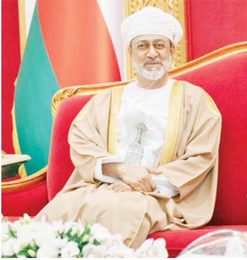
السلطان هيثم بن طارق سلطان عمان

وأشارت الوكالة في تقرير تصنيفها الائتماني لسلطنة عُمان الذي أصدرته مؤخراً إلى أن رفع التصنيف الائتماني جاء نتيجة التحسن الملحوظ في الأداء المالي للدولة، وتحسين أداء ميزان المدفوعات وذلك بفضل الإجراءات المالية التي اتخذتها الحكومة في إطار الخطة المالية متوسطة المدى وارتفاع أسعار النفط، متوقعة بأن يشهد الأداء المالي للدولة مزيداً من التحسن خلال العام الحالي إلى جانب تحسن مركز صافي الأصول في العام المقبل. وتوقع الوكالة ارتفاع عائدات سلطنة عُمان خلال العامين القادمين، واستمرار الميزانية العامة للدولة والحصص الجارية مع تحقيق فوائض مالية حتى عام ٢٠٢٤، ما سيؤدي إلى تعزيز مستويات الاحتياطات المالية للدولة، وتحقيق فائض مالي بنحو ٥.٨ بالمائة من الناتج المحلي الإجمالي خلال هذا العام، كما توقع أن يحقق الحساب الجاري فائضاً مالياً بنحو ٥.٢ بالمائة من الناتج المحلي الإجمالي مقارنة بعجز بلغ نحو ٤.٩ بالمائة و١٦.٥ بالمائة خلال عامي ٢٠٢١ و٢٠٢٠.