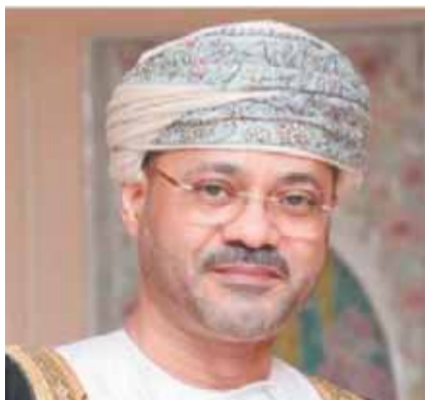
بدر بن حمد

المكانة التي طبعت علاقاتنا كانت كما نلمح بين الحديث هو الأمن والتحضر والرفي. كذلك، ستبقى علاقاتنا تستمد من الحضارة روحها ومن الآخرة عروتها ومن العروبة هويتها. ذلك ما أمنا به في سلطنة عمان وسنبقى إن شاء الله مؤمنين به ومصبرين، كما قال جلالة السلطان قابوس - طيب الله ثراه -: «لقد ثبت عبر مراحل التاريخ المعاصر أن مصر كانت عنصر الأساس في بناء الكيان والصف العربي، ولم تتوان يوماً ما في التضحية من أجله والدفاع عن قضايا العرب والإسلام وإنها لجديرة بكل تقدير».