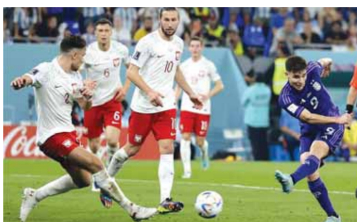
جانب من مباراة الأرجنتين وهولندا في دور 32 لكأس العالم

ليونيل ميسي بجانب كتيبة النجوم دييالا ودي ماريا ورودريجو دي بول وغيرهم من العناصر المميزة بينما يحلم منتخب أستراليا بقيادة