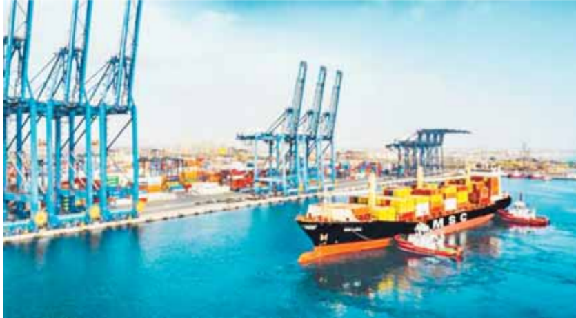
المنطقة الحرة بصلافة من المشروعات الاستراتيجية في عُمان