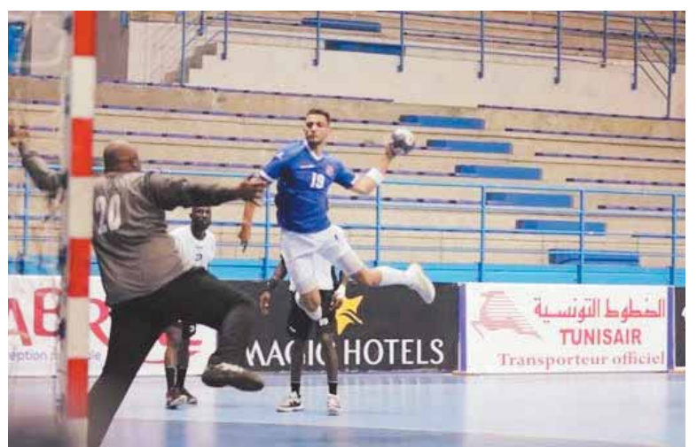
الأهلـى يسعى للفوز على كينشاسا

ويسعى الأهلـى بقيادة مديره الفنى الإسبانى دانيال جورودو أيضاً لتحقيق الفوز بعد التغلب على كينشاسا بعدما خاض مباراتين ضد فلاورز البنينى وعين تبوتا الجزائرى.