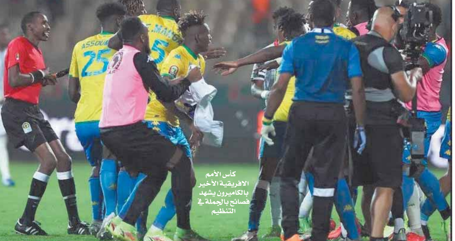
كأس الأمم الإفريقية الأخير بالكامبيرون يشهد فصاحم بالجملة فى التنظيم

وعانت النسخة الماضية من أزمات تنظيمية بالجملة وهو ما أشتك منه عدة منتخبات أثناء تنظيمها فى الكامبيرون وهو الأمر الذى يتسبب به وجود ٢٤ منتخبا وهو عدد كبير من المنتخبات التى تشارك فى البطولة القارية. وواصلت البطولة مسلسل الغموض بعد تأجيل نسخة ٢٠٢٢ إلى شهر يناير ٢٠٢٤ بدلاً من شهر يونيو المقبل بسبب ظروف الطقس فى كوت ديفوار وهو الأمر الذى يضع النجوم المحترفين فى أوروبا فى صدام مع أندية القارة العجوز. وفشل مونتسيبي بشكل واضح فى علاج أزمات البطولة القارية التى ما زالت مستمرة رغم وعود الملياردير الجنوب إفريقى فى تنظيم بطولة على أعلى مستوى.