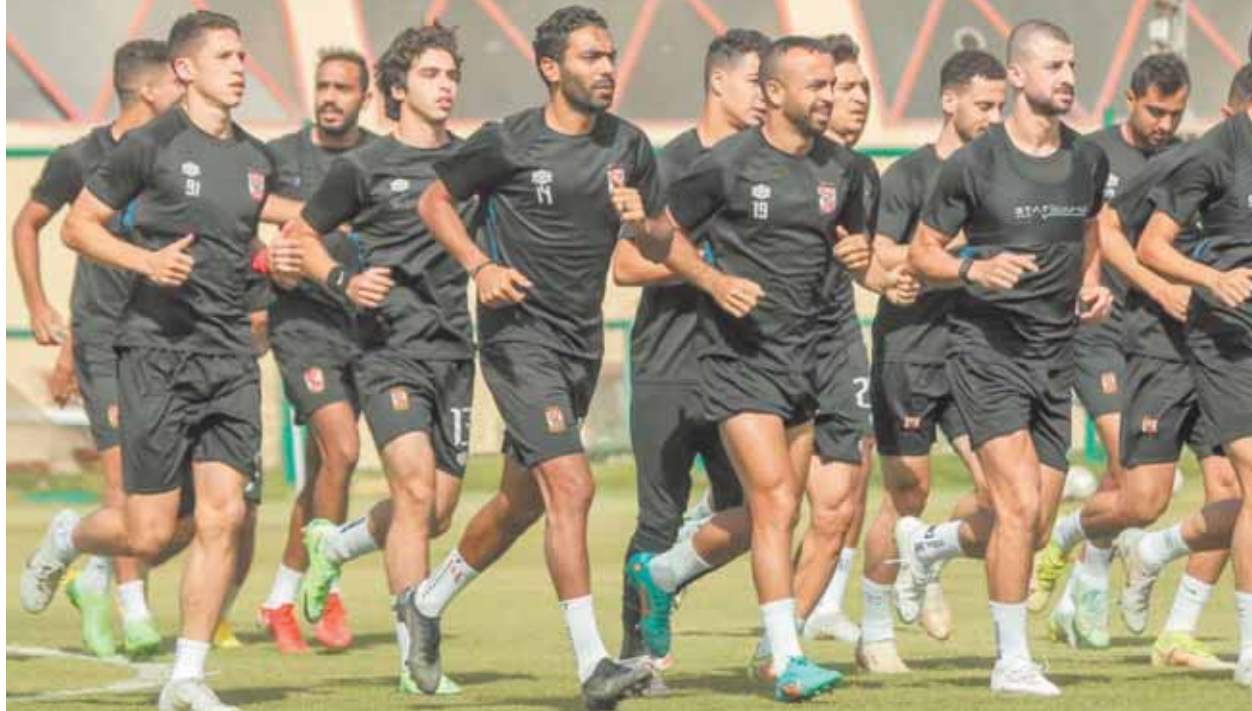
جديدة فى التدريبات استعداداً للقاء الاتحاد المنستيري