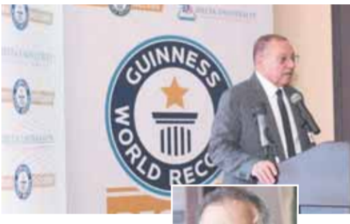
العالمية. ووجه رئيس الجامعة الهندسة لأسرة كلية الهندسة على الجهد الكبير المبذول للنهوض بالكلية والارتقاء بها، وأنها لتصل على الاعتماد الأمريكي، وإشادة هيئة الاعتماد الأمريكية بامكانات كلية الهندسة الأكاديمية والتكنولوجية، وقدرتها مناهجها ومعاملها على المنافسة مع أرقى الجامعات الأمريكية والأوروبية.