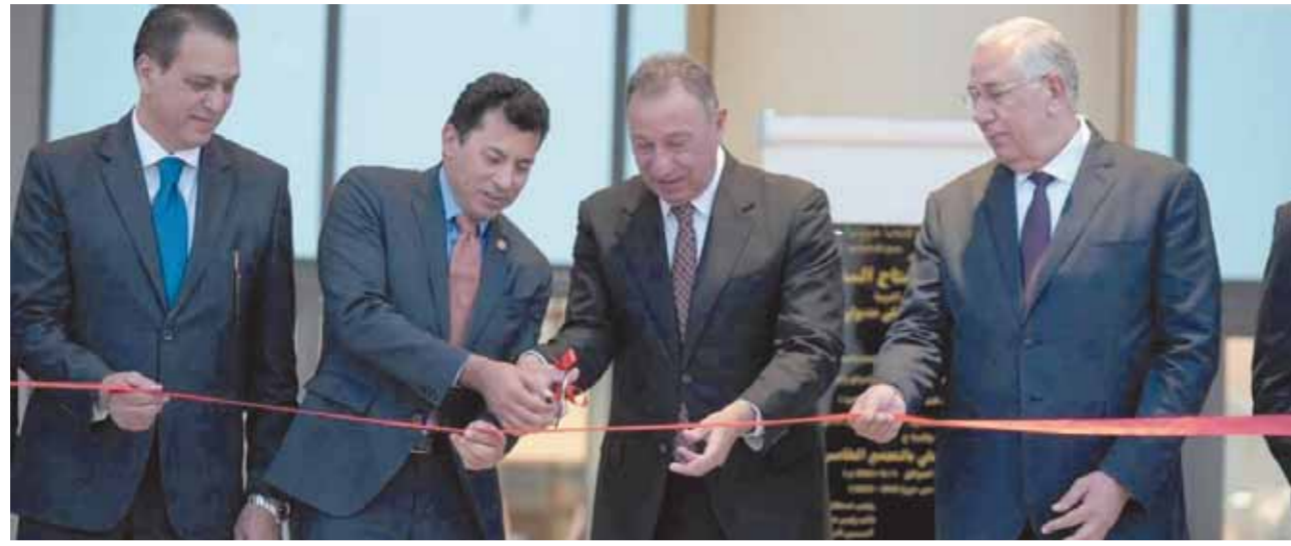
الخطيب يقص شريط افتتاح الفرع الرابع بحضور وزير الرياضة

مع ثلاثى خط الهجوم بيرسى تاو وحسين الشحات ومحمود عبد المنعم كهرابا. على صعيد آخر، عاشت جماهير النادي الأهل وأعضاءه احتفالاً تاريخياً بافتتاح الفرع الرابع فى التجمع الخامس بحضور الدكتور أشرف صبحي، وزير الرياضة، وجمال علام، رئيس اتحاد الكرة، ومجدى أبو فريخة، رئيس اتحاد السلة، وفرج عامر، رئيس نادى سموحة. وحضر أيضاً العديد من رموز القلعة الحمراء، على رأسهم حسن حمدى وحسن مصطفى وطاهر ابو زيد، بجانب العديد من نجوم الفريق السابقين خلال مواسم ماضية.