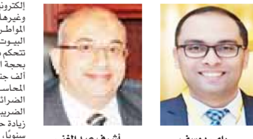
اشرف عبد الغنى رامي يوسف

باستثناء الأضلام الأجنبية المستوردة بالدولار فقط، كما لا توجد رسوم إضافية للثامن على الحياة، حيث تم تطبيق ١٪ فقط زيادة فى قيمة القسط على التأمينات الأخرى والشركة تتحمل ٥٠٪ وتخضع من الوعاء الخاضع لضريبة ويتحمل المؤمن له الـ ٥٠٪ الأخرى، بالإضافة إلى زيادة رسوم التزلج على الجليد وحفلات الغناء والديسكو من جنيه إلى ٢٠ جنيهاً كحد أدنى. وأكد المستشار رامي يوسف، مساعد وزير المالية للسيااسات والتطوير الضريبى، أن التعديلات التى وافق عليها مجلس النواب بشأن رسوم تنمية موارد الدولة، تفرّض على السلع الضرورية، لاستخدام حصيلتها لدعم الفئات الأكثر احتياجاً، وأوضح أن السلع المفروضة عليها رسوم ليست هامة للشرعية الأكبر من المواطنين، لأن تجميعها بالنسبة للمواطنى محدودى الدخل بل تقتصر على بعض المنتجات غير الأساسية كالكاكافيار والسميون فيمبه، وتستههدف تحصيل نحو ٥ مليارات جنيه، تساعد الدولة فى سد جزء من عجز الموزنة، واستمرار الوفاء بالتزاماتها نحو التوسع فى الحماية الاجتماعية للفئات الأولى بالرعاية، وشدد على أن الدولة قدمت حزمة من الإجراءات الحماية والدعم الاجتماعى لفئات الأولى بالرعاية خلال الفترة الأخيرة، مشيراً إلى أن الضرائب فى العنصر والمصدر الرئيسى لموارد الدولة، وهذا ليس فى مصر فقط، ولكن أيضاً موجود فى دول أخرى، والدول تسير فى كل الطرق الأخرى لزيادة موارد الدولة. وأكد مساعد وزير المالية، أن قانون تنمية موارد الدولة له مزايا عديدة، مثل رفع حد الإعفاء على الفائتات على الصحة، ووضع ٥٪ حافز للمواطن إذا كان المواطن يقدم فواتير