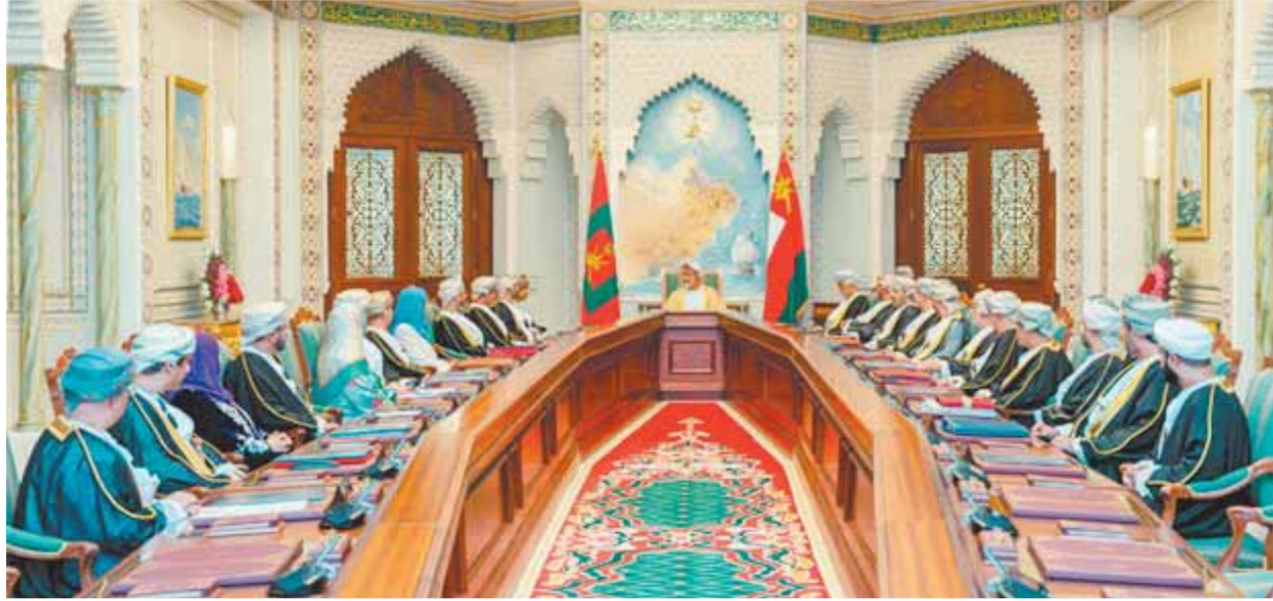
السلطان هيثم بن طارق يترأس اجتماع مجلس الوزراء

تخفيض ١٥٪ من إجمالي قيمة فاتورة الكهرباء وأشاد فيصل بن راشد بن جابر الجابري، الرئيس التنفيذي للهيئة الإذاعية للاستشارات الهندسية بتلك التوجهات باستمرار تطبيق نسبة تخفيض ١٥٪ من إجمالي قيمة فاتورة الكهرباء حرصاً منه على تخفيض الأثار المتوقعة على المواطنين خلال فترة الصيف، حيث تترتد نسبة الاستهلاك بسبب استخدام أجهزة التكييف لفترة أطول واجهادها، وقال: سنرى خلال الأشهر القادمة مبادرات أكبر في دراسة وإيجاد حلول بديلة لتوفير استهلاك الطاقة عبر الابتكار في تطوير مواصفات خاصة للمباني الخضراء، وكيفية تصنيها في منطقة عمان، وتصنيف الأجهزة المستخدمة ومدى فاعليتها وجودتها للتقليل من استهلاك الكهرباء وحفض الفواتير بصورة مستدامة.