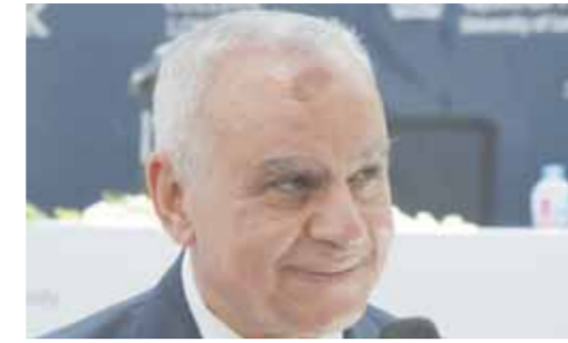
محمود هاشم والى تقدم من خلال كليتها ومؤسساتها العديد من البرامج الدراسية المتميزة، ومنها ١٢ تخصصاً متميزاً فى الاقتصاد، والعلوم السياسية، والعلوم الإدارية، والتعمول، وغيرها من العلوم

الاجتماعية مقدمة من كلية لندن للاقتصاد والعلوم السياسية LSE، والمصنفة رقم ٢ عالمياً على مستوى جامعات العالم فى العلوم الاجتماعية، وقد حصل منها ١٨ عالما على جائزة نوبل. إلى جانب ٧ برامج فى هندسة وعلوم الحاسبات وتعلم الآلة والذكاء الاصطناعى وتطوير الويب والهاتف المحمول والحوسبة المادية وإنترنت الأشياء والواقع الافتراضى وتطوير الألعاب وتجربة المستخدم، وجميعها تخصصات جديدة وفريدة من نوعها، حيث