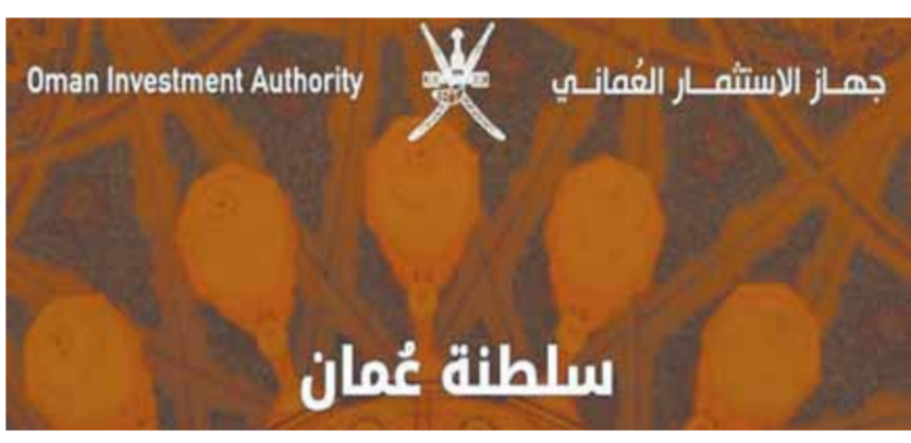
جهاز الاستثمار العماني

عن أسس الشكر وأجل عبارات التقدير على ما فعله السلطان هيثم بن سلطان توجيهاته السامية بتعزيز الأمن الغذائي وتنمية المحافظات. وأضاف فيصل بن راشد بن جابر الجابري، الرئيس التنفيذي للهيئة الإذاعية للاستشارات الهندسية بتلك التوجهات باستمرار تطبيق نسبة تخفيض ١٥٪ من إجمالي قيمة فاتورة الكهرباء حرصاً منه على تخفيض الأثار المتوقعة على المواطنين خلال فترة الصيف، حيث تترتد نسبة الاستهلاك بسبب استخدام أجهزة التكييف لفترة أطول واجهادها، وقال: سنرى خلال الأشهر القادمة مبادرات أكبر في دراسة وإيجاد حلول بديلة لتوفير استهلاك الطاقة عبر الابتكار في تطوير مواصفات خاصة للمباني الخضراء، وكيفية تصنيها في منطقة عمان، وتصنيف الأجهزة المستخدمة ومدى فاعليتها وجودتها للتقليل من استهلاك الكهرباء وحفض الفواتير بصورة مستدامة.