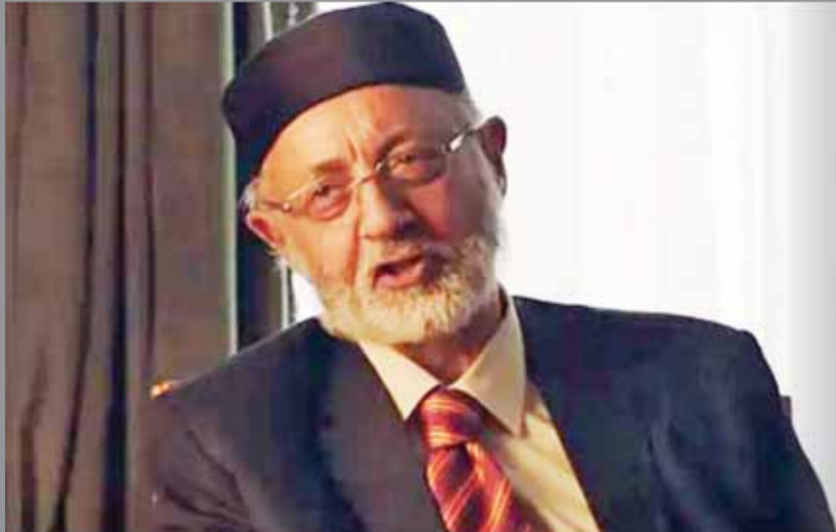
أجرت الحوار: دينا دياب