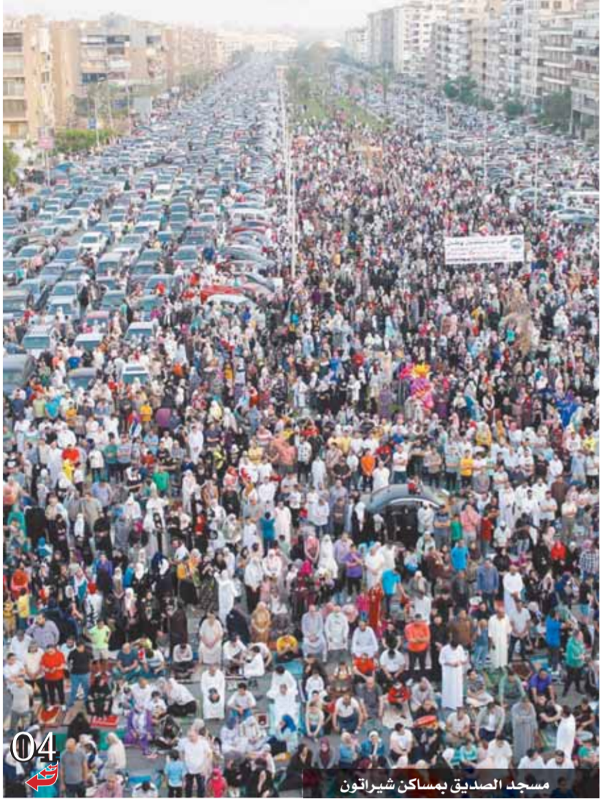
مسجد الصديق بمسكن شيراتون