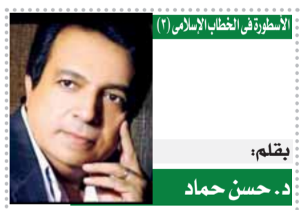
بقلم: د. حسن حماد