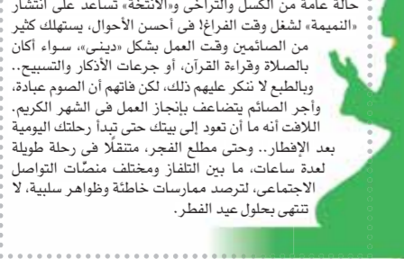
بقلم: الشيخ أحمد ربيع