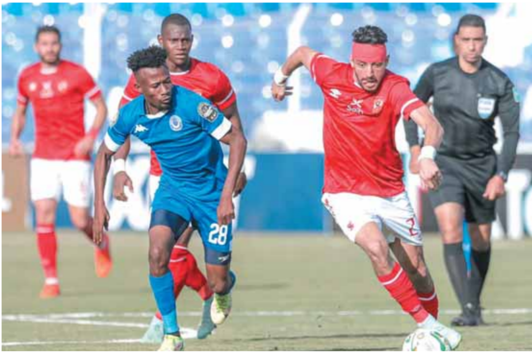
الأهلي يسعى لعبور عقبة الهلال