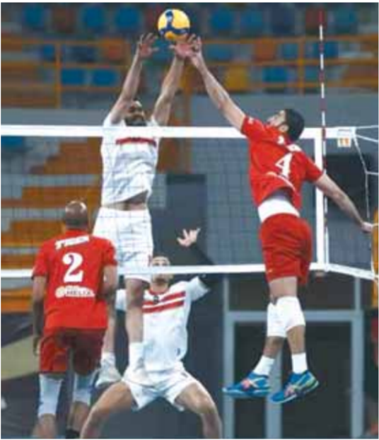
انتصار طائرة الزمالك على الأهلي