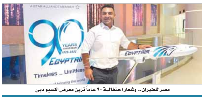
مصر للطيران.. وشعار احتفالية ٩٠ عاماً تزين معرض اسكودوبى

طائرة مصر للطيران في استقبال زائري الجناح المصري وتوزيع الهدايا والمفاجآت