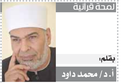
بقلم: أ.د/ محمد داود