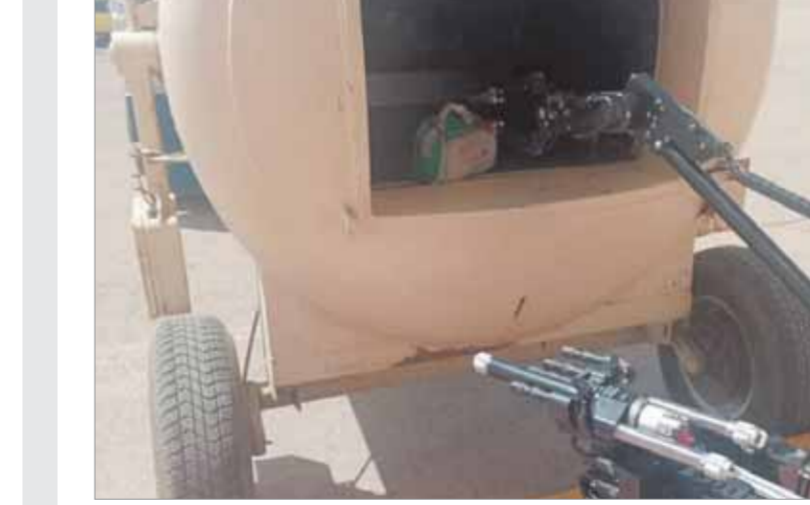
مرسى مطروح خلال تجربة الطوارئ وجزء من التجربة