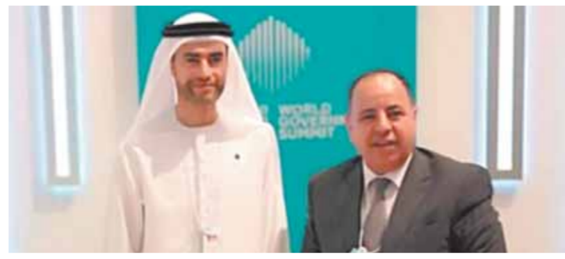
وزير المالية المصري محمد معيط والإماراتي محمد بن هادي الحسيني

التصنيف والتمويل الدولية، لافتاً إلى أن الدولة تولي اهتماماً كبيراً بتعزيز الاستثمارات في مصر، من خلال تذليل العقبات أمام المستثمرين، وتطوير البنية التحتية وميكنة الإجراءات والخدمات المالية ومنظومات الأعمال المرتبطة بمجالات الاستثمار المختلفة. أشار الوزير، إلى حرص مصر على تطوير علاقات التعاون مع الجانب الإماراتي خاصة في المجالات الاقتصادية والاستثمارية، مع التركيز على كل القطاعات التنموية والتكنولوجية، لتحقيق الاستقلال الأمثل لجميع الفرص المتاحة لتعزيز التكامل بينهما. أكد معالي محمد بن هادي الحسيني وزير