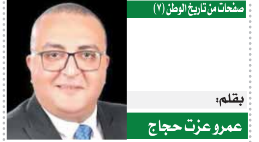
صنحات من تاريخ الوطن (١)

عضو مجلس الشيوخ عن تسيقية شباب الأحزاب والسياسيين عن حزب التجمع