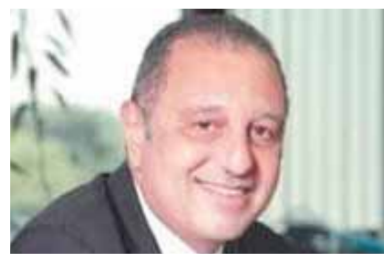
عمرو أبو العينين

في ضوء مشاركة وزارة الطيران المدني في المحفل العالمي EXPO DUBAI ٢٠٢٠ الذي تستمر فعالياته حتى نهاية الشهر الجاري، وتحت شعار الجناح المصري في العرض «عراقة عراقة» تبرز المستقبل، حرصت الشركة الوطنية مصر للطيران الناقل الوطني للوفود الرسمية المصرية في المعرض على مشاركة زائري الجناح المصري بمعرض EXPO DUBAI ٢٠٢٠ الاحتفال بمرور ٩٠ عاماً على إنشائها على مدار ثلاثة أيام قبل ختام المعرض. وصرح الطيار عمرو أبو العينين رئيس مجلس إدارة الشركة القابضة لمصر للطيران «إن مناسبة مرور ٩٠ عاماً على إنشاء مصر للطيران في السابع من مايو ١٩٢٢ هذا الصرح الوطني العظيم تعد تويجاً لجهود أجيال من العاملين الذين أسهموا في الارتقاء بهذه الشركة، وانطلاقاً من هذا التاريخ المشرف فإن طموحنا للتفوق بهذا المرفق الحيوي لن نتوقف عند هذا الحد، بل سنبدل كل الجهد من أجل المحافظة على المكانة المتميزة والعالمية التي وصلت إليها مصر للطيران والتي تليق باسم مصر ومكانتها بين دول العالم المختلفة».