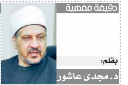
بقلم: د. مجدي عاشور

ومن يتأمل حال مجتمعاتنا في رمضان يجد أنها أفضل الله ملية بمظاهر الخير، ويجد التسابق إلى فعل الخيرات، سواء الغذائية أو غير ذلك.. مما يدل على حيوية المجتمع، وترسخ قيم الرحمة والعطاء فيه.. وكفى بذلك مرثية لهذا الشهر الكريم، ودرسا علينا أن نستصحبه طوال العام!