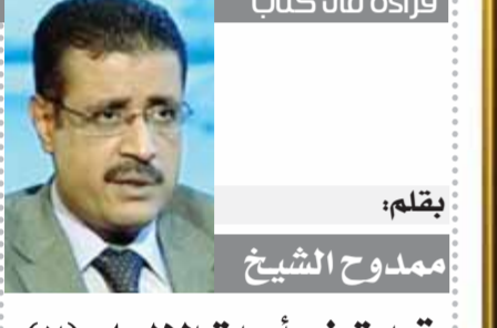
بقلم: مدوح الشيخ