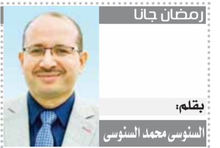
بقلم: السنوسي محمد السنوسي