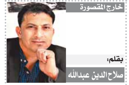
خارج المقصورة بِقلم: صلاح الدين عبدالله