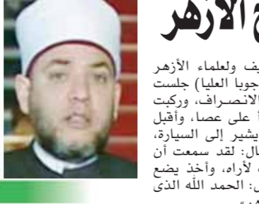
بقلم: الشيخ أحمد ربيع