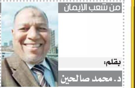
بقلم: د. محمد صالحين