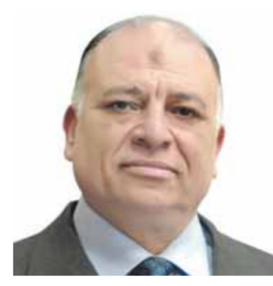
محمد سعيد محروس

نجح مطار الغردقة الدولي في اجتياز التدقيق الخارجي الخاص بمطالبيات المواصفة الدولية القياسية «ISO ٤٥٠٠١، ٢٠١٨» وجاء هذا الإنجاز ضمن الشهادات التي حصل عليها مطار الغردقة الدولي، حيث نجح المطار في اجتياز كافة المتطلبات الخاصة بالمواصفات الدولية القياسية، حيث حصل على شهادة نظام إدارة الجودة ISO ٩٠٠١، ٢٠١٥ ثم الحصول على شهادة نظام إدارة البيئة ISO ١٤٠٠١، ٢٠١٥ وتوجت بالحصول على شهادة نظام إدارة السلامة والصحة المهنية ISO ٤٥٠٠١، ٢٠١٨. ومن جانبه أكد المهندس محمد سعيد محروس رئيس الشركة القابضة للمطارات والملاحة الجوية أن نجاح مطار الغردقة في اجتياز كافة المتطلبات القياسية الدولية لنظم الجودة وإدارة السلامة والصحة المهنية والبيئة يعد إنجازاً كبيراً مهناً لجميع العاملين بالمطار ومثمناً لجهودهم المخالصة