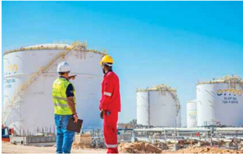
أنشطة عمّانية تعزز الاقتصاد