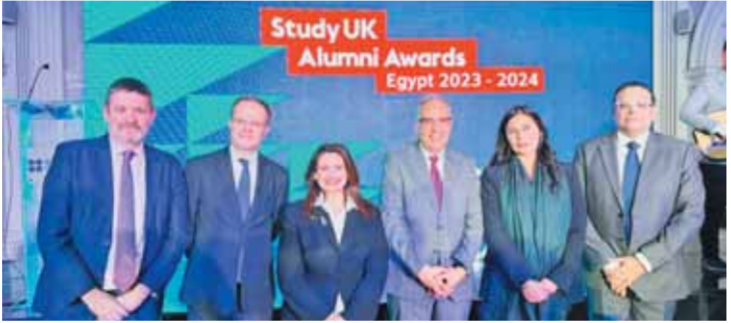
الوزيرة هجره تشارك في احتفالية تكريم المتميزين من المصريين خريجي الجامعات البريطانية

يبدسون أو درسوا في الخارج وأصبحوا خبراء ماهرين في مجالهم، كما حرصت على تأسيس مجلس الخبراء من شباب العلماء الذي يمكن لهم أن يقدموا المزيد من الإسهامات في حل ما يواجهه الوطن من تحديات ويسمون معه بدأ بيد لبائته وتحقيق ما يصبو إليه من إنجازات وتعليم مؤسسته بخبراتهم المفردة. وجه جاريث بايل، السفير البريطاني لدى مصر، حديثه للفائزين والحضور قائلاً: «أقدم بخالص التهاني إلى الأفراد الاستثنائيين الذين يتم تكريمهم الليلة لمساهماتهم المتميزة في مختلف المجالات، سواء في مجال المناخ أو التمويل أو الفنون أو العلوم، ومن الجدير بالذكر أن ثلاثة من الفائزين الأربعة اليوم بالإضافة إلى العديد من هؤلاء المناهلين للتصنيفات النهائية هم من الحاصلين على منحة تشيفينغ الدراسية، مما يساهم في تعزيز الدور المشترك بين المملكة المتحدة ومصر في تعزيز المواهب والخبرات، ولا تمكس إنجازاتهم تقانيم الشخصي فحسب، بل تظهر أيضاً نجاح التعاون بين بلدينا في مجال التعليم وتطوير القيادات».