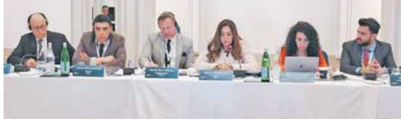
محافظ دمياط منال عوض تتولى منصب المحافظ

في الشرق الأوسط وشمال أفريقيا، التي عقدتها شبكة المدن القوية والمعهد الدولي للعدالة وسيادة القانون بمدينة فاليتا بمالطا. وأشارت «عوض» إلى أن المرأة أصبحت تقوم بشكل عام بحماية القيم الصحيحة ونقلها إلى الأجيال المقبلة، إلى جانب مشاركتها قيادية محلية داخل مدنها لدعم جهود الحكومات للدفاع عن المفاهيم الإيجابية ومكافحة التطرف والإرهاب، ونشر التوعية بتلك القضايا من خلال التعاون مع المؤسسات والهيئات، وفي هذا الإطار، أشارت إلى تنظيم محافظة دمياط عدداً من المبادرات في هذا الملف، من أبرزها التعاون مع وزارتي الأوقاف والهجرة المصرية، لعقد ندوات حول مواجهة التطرف ومناهضة الهجرة غير الشرعية وتنظيم دورات وورش عمل لدعم تلك القضايا من داخل المدينة الصديقة للنساء التي تم إنشاؤها بالتعاون مع المجلس القومي للمرأة، وتمويل من هيئة الأمم المتحدة للمرأة لتمكين المرأة على كافة المستويات.