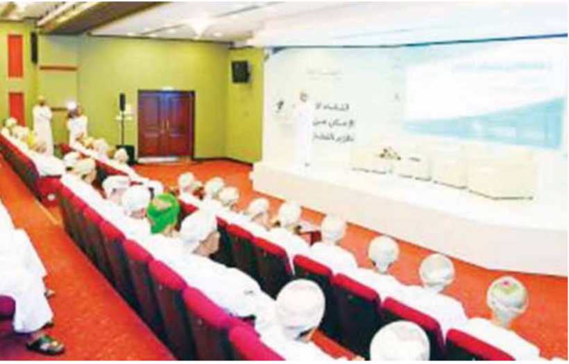
اللقاء الإعلامي للكشف عن تفاصيل البرنامج الوطني «استدامة»