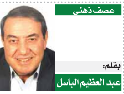
عصف ذهني بقلم: عبد العظيم الباسل

صدر حديثاً عن سلسلة الذخائر بالهيئة العامة لقصور الثقافة، برئاسة الفنان هشام عطوة، كتاب «طبقات الأطباء والحكماء» لأبي داود سليمان بن حسان الأندلسي، المعروف بابن جُلجل، ضمن إصدارات الهيئة بمعرض القاهرة الدولي للكتاب في دورته ٥٤ المنعقدة حالياً بمركز مصر للمعارض الدولية. يعد الكتاب -وفقاً لمقدمة المحقق- وثيقة مهمة في تاريخ العلوم وتطور حركة التأليف والترجمة في القرن الرابع الهجري الذي ازدهرت فيه الحضارة الإسلامية، وتمت، وبلغت غايتها من الإنتاج الواسع في مصرين والعرب والأجانب المنعنين بالترجمة عن العربية، وأيضاً نخبة من أهم الكتاب والأدباء المصريين الذين ترجمت أعمالهم إلى لغات مختلفة، ونخبة من الناشرين المصريين والدوليين المنعنين بعملية الترجمة والتعاون الدولي بين دور النشر، وتضمن المؤتمر المشاركين في عملية الترجمة كاملة من مسؤولين ومبدعين وناشرين ومترجمين، لتكتمل حلقة العمل، وتحقق نقاشات المؤتمر الهدف المطلوب منها، وهو مخرجات عملية وقابلة للتطبيق، كما شارك بحضور جلسات المؤتمر عمداً كليات الألسن واللغات والترجمة بمصر والمنعنين بالترجمة من المراكز والهيئات والناشرين والجهات المصرية والعربية والدولية.