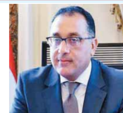
د. مصطفى مدبولي