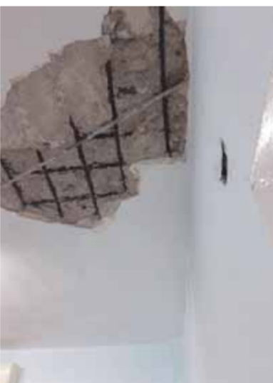
كتلة اسمنتية سقطت من السقف

أدى إلى انفجار لمبات الإضاءة وأدت إلى تلف الأجهزة الكهربائية، وتطور الأمر إلى كارثة حيث سقط جزء من سقف إحدى الحجرات ونجا أحد الأطفال من الموت، وجن جنون صاحب الشقة وأسرع بتحرير محضر في قسم العجوزة، برقم ١٠٧٩٢ إداري العجوزة لسنة ٢٠٢٢ ولم يجد رد فعل، ولجأ إلى أحد الأشخاص ليتوسط له لدى رئيس حى العجوزة لعه يتدخل، ويطلب منه أن ينزل الحى قال إن الحى أدى دوره، وهكذا هو القانون، وعليه أن يذهب للنهية ويستصدر القرار لتجبر الشرطة صاحب الشقة على إصلاح العطل. وما زال الوضع قائماً، المواطن وأسرتة يعيشون في رعب بعد أن تسببت المياه في خسائر جسيمة بالشقة، وألقت بظلالها على جدران العقار من الخارج. الأسرة المتضررة في انتظار تدخل عاجل من وزير التنمية المحلية أو محافظ الجيزة قبل أن تقع كارثة بالعقار الذي تزداد حالته سوءاً يوماً بعد يوم.