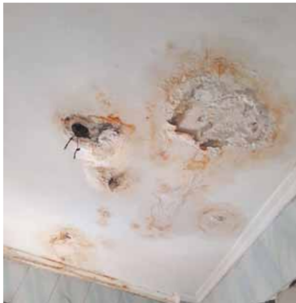
الشقة بلا اضاءة بعد انفجار اللبمبات