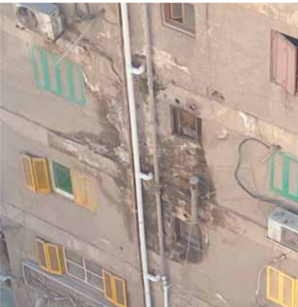
منظر العقار من الخارج