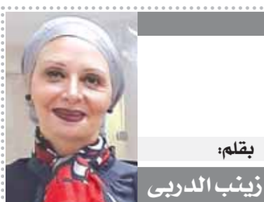
بقلم: زينب الدربي

وأشار إلى أن المنتخب المكسيكى حاول الضغط من أجل إحراز هدف ثالث أمام السعودية، بعدما تساوى مع بولندا، ولكن البطاقات الصفراء كانت ترجح كفة بولندا، وهو ما ساهم في فتح خطوط الدفاع واستقبال هدف قتل المباراة من سالم الدوسرى.