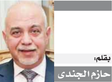
بقلم: حازم الجندى

أحدت من هذه الصفحات القاهرة، ومدير مركز السموم بجامعة القاهرة، كشفت عن وجود العديد من المواد الطائفة يستخدمها التجار لتلويح منتجاتهم، وهي تضاف لبعض الأطعمة والفواكه مثل البليخ والبلح، وتحتوي على سموم ضارة.