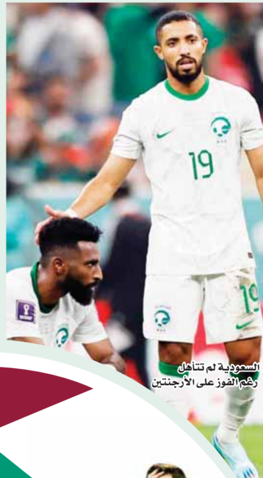
السعودية لم تتأهل رغم الفوز على الأرجنتين

وأعلن الاتحاد الفرنسي تقديم شكوى للفيفا ضد إلغاء هدف جريزمان، مشيرين إلى أنه لا يحق للحكم العودة إلى تقنية الفيديو لمراجعة اللعبة، بعد أن أطلق صافرة نهاية المباراة.