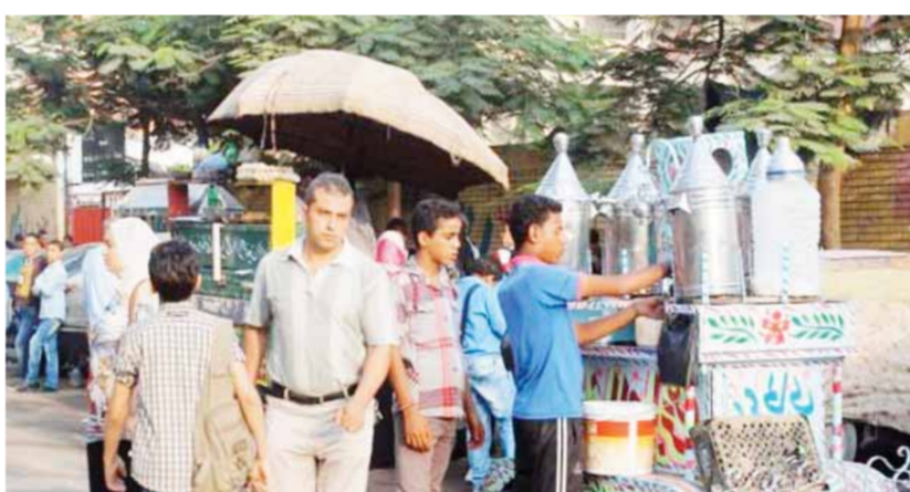
الموت بالألوان يحاصر التلاميذ

أحدت من هذه الصفحات القاهرة، ومدير مركز السموم بجامعة القاهرة، كشفت عن وجود العديد من المواد الطائفة يستخدمها التجار لتلويح منتجاتهم، وهي تضاف لبعض الأطعمة والفواكه مثل البليخ والبلح، وتحتوي على سموم ضارة.