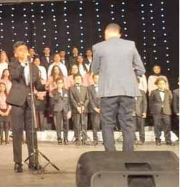
ملعب مطابع الأخبار