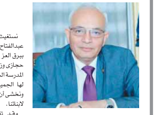
إشراف: طارق يوسف

نستغيت نحن أولياء الامور بمدرسة عبدالفتاح السيسى الرسمية المتميزة للغات ببرق العز التابعة لمركز المنصورة بالدكتور رضا حجازى وزير التربية والتعليم بسبب نقل مدرسة المدرسة الحالية والمعينة منذ عام ٢٠١٦. ويشهد لها الجميع بحسن الخلق والمهارة فى العمل ونخشى ان يؤثر هذا النقل على المستوى المتميز لابنائنا. وقد تقدمنا بالشكوى رقم ٦٩٦٢٢٤٤