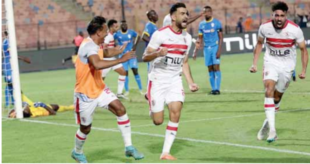
فرحة لاعبي الزمالك بتسجيل الهدف الرابع