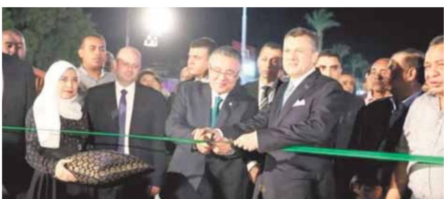
وزير السياحة ومحافظ البحر الأحمر يفتتحان الممشى

التطوير التى شهدتها هذا الممشى السياحى الهام، والذي يعد أحد أهم المعالم السياحية المميزة بالمدينة، لافتاً إلى حرص الدولة المصرية على إقامة العديد من المشروعات التجميلية والحضارية والترفيهية بالمقاصد والمدن السياحية المختلفة والتي يكون لها دور كبير في تطوير جودة الخدمات السياحية المقدمة للسائحين وتحسين التجربة السياحية لهم خلال زيارتهم لمصر. وأوضح أن محور تحسين التجربة السياحية للسائحين يعتبر أحد أبرز محاور الاستراتيجية الوطنية للسياحة المصرية والتي سيتم إطلاقها خلال الربع الأول من عام ٢٠٢٣ لزيادة أعداد السياح الوافدة لمصر وتقديم منتج وتجربة سياحية مختلفة للسائحين.