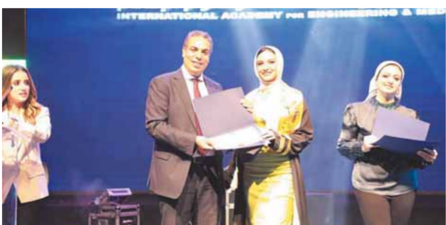
د. عادل عبدالغفار رئيس الأكاديمية أثناء تكريم الخريجين

وأولياء أمور الطلاب والطلاب، وفى كلمته، أكد د. عادل عبدالغفار رئيس الأكاديمية أن لحظة احتفال الطلاب بتخرجهم ستظل عالقة فى أذهانهم وأذهان أولياء أمورهم، فهي لحظات لا تنسى، كما أنها تعد بداية الانطلاق إلى الحياة المهنية والاعتماد على الذات والاستقلال فى الحياة، مثمناً الدور الكبير والدعم الذى قدمه الآباء والأمهات الذى أتى بشواره، مشيراً إلى أن تضحياتهم لم تذهب هباء، بل بارك الله لهم وشاهدوا لحظة تخرج أبنائهم. وأشاد رئيس الأكاديمية بإمكانات الأكاديمية التعليمية من مدرجات وقاعات واستديوهات ومعامل وإمكانات النشاط والتدريب غير المسبوقة، ووسائل التعليم المتاحة لطلابها بهوليود الشرق مدينة الإنتاج الإعلامى، والتي جعلتها قبلة للتعليم العالى فى مصر.