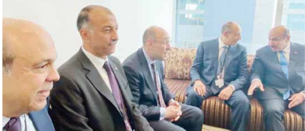
وزير الطيران المصري والوفد رفيع المستوى خلال لقاء وزير المواصلات القطري بالاكواب

بين مصر وقطر في مجال الطيران بما يعزز التعاون المشترك من أجل تنشيط الحركة الجوية والسياحية بينهما وذلك في ضوء ما تشهده الدولة المصرية من تنمية اقتصادية وتنموية في مختلف قطاعاتها وبخاصة تنفيذ العديد من المشروعات وإنشاء مطارات جديدة بقطاع الطيران المدني.