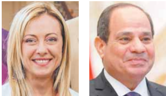
السيسي جورجيا ميلوني