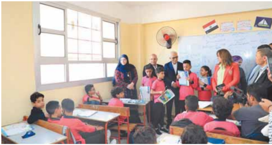
د رضا حجازي أثناء جولة تفقدية في مدارس دمياط

وأدار «حجازي» نقاشاً مع عدد من الطلاب حول اليوم الدراسي، موجها رسالة للطلاب والمعلمين أكد فيها ضرورة أن يكون العام الدراسي الجديد سعيداً على جميع