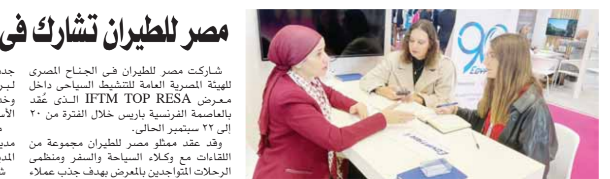
شاركت مصر للطيران في الجناح المصري للهيئة المصرية العامة لتنشيط السياحة داخل معرض IFTM TOP RESA الذي عُقد بالعاصمة الفرنسية باريس خلال الفترة من ٢٠ إلى ٢٢ سبتمبر الحالى. وقد فقد ممثلو مصر للطيران مجموعة من اللقاءات مع وكلاء السياحة والسفر ومنظمي الرحلات المتواجدين بالمعرض بهدف جذب عملاء