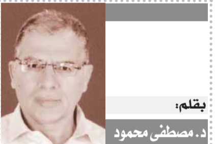
بمقام: د. مصطفى محمود