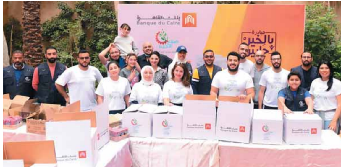
قافلة الخير لبنك القاهرة بصعيد مصر لسنة العاشرة