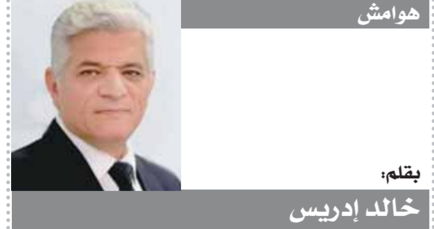
هوامش بقلم: خالد إدريس

كتبت - زينب الدربى وأحمد الأطرش؛ أعلنت روسيا وقف إطلاق النار فى مدينة ماريوبول الأوكرانية لإجلاء المدنيين، ومن جانبه صرح مساعد عمدة «ماريوبول» بأن محاولة الخروج من المدينة خطيرة جداً. وأعلن حاكم مقاطعة بيلجورود الروسية فياتشيسلاف غلادكوف، أمس الجمعة، تعرض منشأة تخزين وقود فى بيلجورود لهجوم شنته مروحيات عسكرية أوكرانية، فى هجوم هو الأول من نوعه لقوات حكومة كييف داخل الأراضى الروسية. وفى سياق آخر، نقلت صحيفة «ديلى ميل» البريطانية عما وصفته بجمعية حقوق الإنسان الأوكرانية أن القوات الروسية أجبرت ٥٠٠ شخص على حفر الخنادق وبناء التحصينات لها، ووصل الأمر إلى إصلاح العتاد العسكرى فى قرى تحيط بالعاصمة كييف، وذكرت «ديلى ميل» أنه جرى نقل نحو ٢٠ ألف شخص من مدينة ماريوبول الساحلية المحاصرة إلى داخل روسيا، حيث وضعوا داخل «مسكرات عمل»، وأشارت إلى أن الأسرى تعرضوا للتهديد بالنعف، إذا لم يفعلوا ما يقال لهم. كما أعلن الرئيس الأوكرانى فولوديمير زيلينسكى إقالة اثنين من كبار الجنرالات فى أجهزة الأمن بعد اتهامهما بالخيانة و«مناهضة الأبطال» على حد قوله، مشيراً إلى فقدان هذين الجنراليين لولاتهما العسكرى للثعب الأوكرانى مقرراً حرمانهما من رتبتهما العسكرية، باتى ذلك فى الوقت الذى تعددت فيه وقائع خيانة