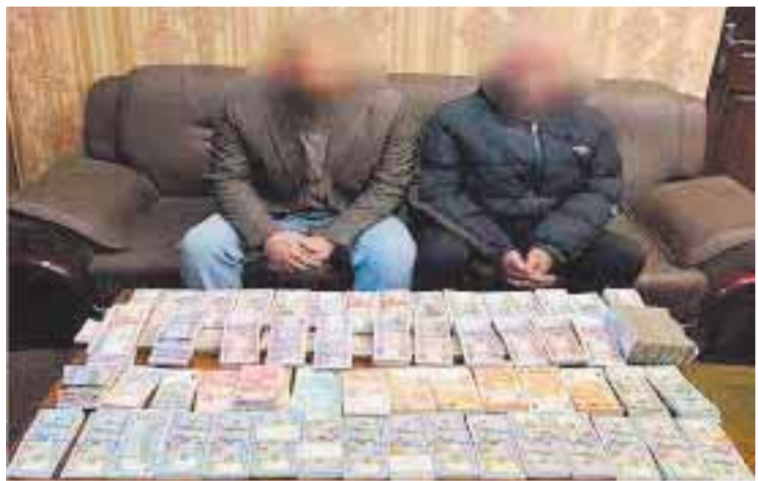
المتهمان بعد ضبطهما

استمرارا للجهود الأمنية المبذولة لضبط الخارجين على القانون والمخالفين، تمكنت مباحث القاهرة من ضبط عائلتين لممارستها نشاطا مجرما في الاتجار بالعمالات الأجنبية، متخذين محل لعب أطفال في منطقة الدرب الأحمر مكانا لإدارة تجارتهما غير المشروعة، وعثر داخل المكان على مبالغ مالية كبيرة وعمالات أجنبية، وأقر المتهمان بممارستهما الاتجار بالنقد الأجنبي، وتم إحالتهم إلى النيابة العامة لاتخاذ الإجراءات القانونية اللازمة حيالهما. تفاصيل الواقعة أكدتها معلومات وتحريات وحدة مباحث قسم شرطة الدرب الأحمر بمديرية أمن القاهرة، فمادها قيام مالك محل لعب أطفال، و«شريكه بذات المحل» كائنا بدائرة القسم، بمزاولة نشاط غير مشروع في مجال الاتجار بالنقد الأجنبي خارج نطاق السوق المصرى، متخذين من المحل ملكهما مسرحا لمزاولة نشاطهما الإجرامى، عقب تقنين الإجراءات تم استهدافهما وأمكن ضبطهما حال تواجدهما بالمحل، وبحوزتهما مبالغ مالية «عمالات محلية وأجنبية»، ماكينة عد نقود، وبمواجهتهما اعترفا بحيازتهما للمبالغ المالية بقصد الاتجار بها خارج نطاق السوق المصرى.