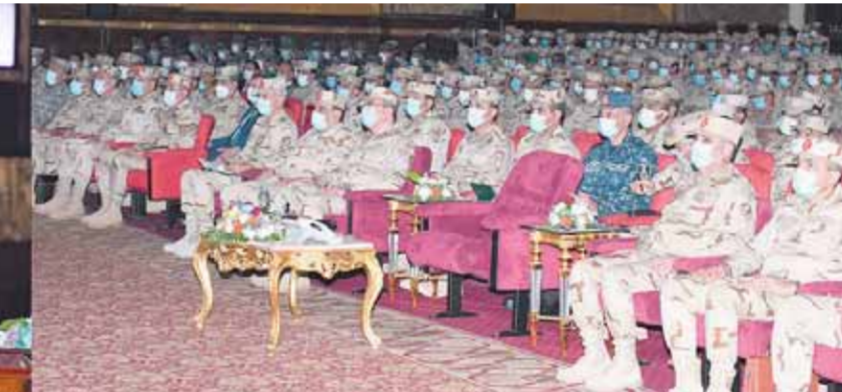
الفريق أول محمد زكى