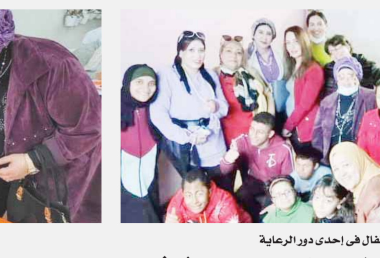
سيدات الوفد مع الأطفال في إحدى دور الرعاية