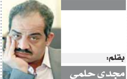
بقلم: مجدى حلمي

صدر في الثمانينيات باسم «ماليزيا ٢٠٢٠» وكان يتحدث عن رؤيته لبلاده في تلك الفترة خاصة أن ماليزيا كانت تشبه المستعمرات وكانت تصدر المطاط الطبيعي فقط وكان مهاتير محمد فخروًا جدًا كوني مسلمًا ووصلت تلك الدرجة من العلم. كيف يتم تصنيع الشرائح الإلكترونية؟ - تتم صناعة الشرائح الإلكترونية من رمل أبيض من نوع خاص، يتم تحويله إلى كريستال ثم يقشر إلى رقائق مثل شرايح وتضاف إلى كل قطعة الدوائر التي تحتاجها ويتم عمل اختبارات في منتهى الدقة لاستبعاد غير الصالح، والماكينات التي تصنع ذلك معقدة وأهم ما يصنعه اليابان وألمانيا وأمريكا، يعني مثلاً ماليزيا لا تصنعه وإنما تصنع «الميكروتشيبس» فقط وتستورد الماكينات جاهزة. كيف أسهمت في نهضة صناعة الإلكترونيات في ماليزيا؟ - كان ينقصهم تطبيق الأبحاث التي قاموا بعملها، لذلك كنت مشاركًا في تطبيق تلك الأبحاث وتفتيدها وبدت بعد ذلك في توطين صناعة «الميكروتشيبس»، بالإضافة إلى أنني تحدثت معهم في عدة أمور وكان أول ما يشغلهم