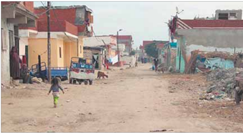
طرق القرية فى انتظار الصرف