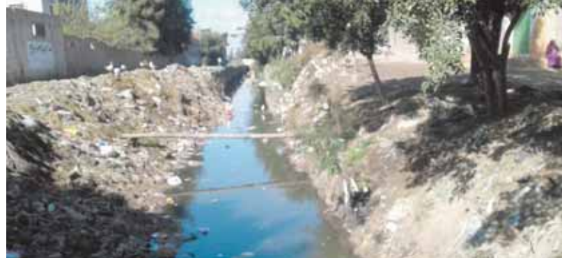
ترعة السعمرانية وباء يحاصر القرية

البحيرة - نصر اللقانى: يعانى الآلاف من أهالى قرى العرقوب بكفر الدوار، والتى تتكون من مجموعة عرب تابعة منها: القاضى، ويسرى، والدبابية، وأبوسعد، من عدم وجود الخدمات الأساسية ومنها اختفاء مياه الشرب، وعدم وجود مواصلات آدمية تربطها بمدينة كفر الدوار، وكذلك اختفاء مياه الري وتعرض آلاف الأفدنة إلى البوار، بسبب وقوعها فى نهايات ترعة السعمرانية. انتقلت «الوفد» إلى قرى العرقوب، والتى