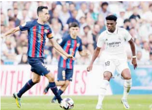
ريال مدريد وبرشلونة كلاسيكو على صفيح ساخن