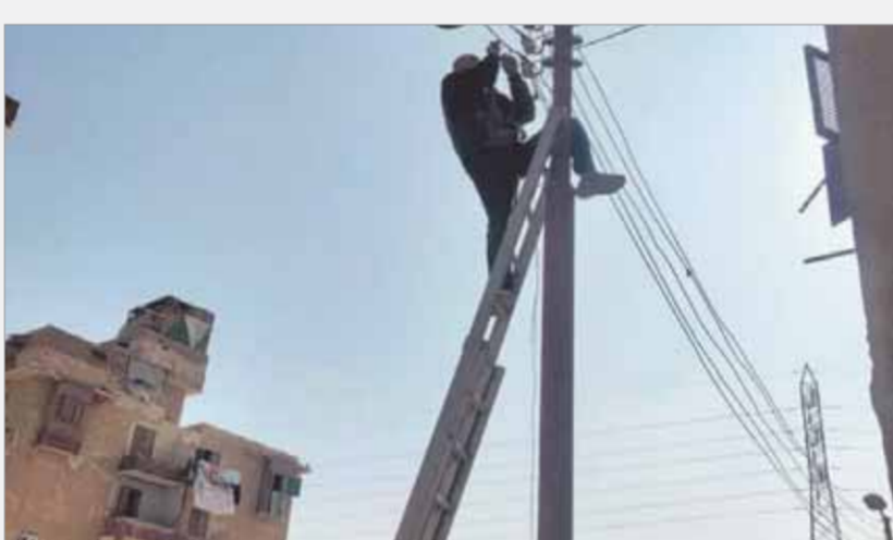
أعمدة الإنارة أكلها الصدا

ويضيف أحمد على من الأهالي بأنه لا يوجد رئيس للحي منذ عدة أشهر مع غياب تام لمنظمة النظافة وأصبحت خزانات الصرف التي تم إلغاؤها تعيق حركة السير بالطرق والشوارع، فضلاً عن انتشار البعوض والحشرات حول تجمعات المياه التي ينتج عنها رائحة كريهة والتي قد تساعد على انتشار الأمراض والأوبئة وتنتشر حولها الكلاب الضالة، وأقرب مستشفى للمساكن بدون طبيب ولا تقدم سوى الخدمات الإدارية فقط، وتمثل كارثة تصعد المباني الهائس الأكبر للسكان خوفاً على حياتهم، وعندما تم اكتشاف تصعد عدد من العمارات عام ٢٠١٨ لم يتم توفير سكن بديل لسائقي تلك العمارات بل طابيحهم حتى يتكفوا أعمال الصيانة والترميم، وتطالب الدكتور أحمد الأنصاري محافظ الفيوم بالتدخل العاجل لإنقاذ المنطقة وحل المشكلات التي تواجه الأهالي.