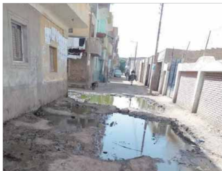
المياه الجوفية أزمة بلا حل

مفولها بعد ساعة من سحب المياه الجوفية، والحلول الجذرية تكمن في سرعة إقامة محطة صرف صحي.