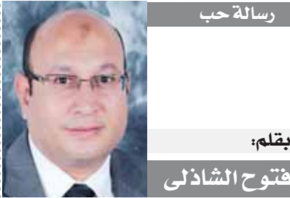
رسالة حب بقلم: فتوح الشاذلي

ومع انتشار جرائم العنف الأسرى والتتمتع والتحرش وهتك العرض، وبالرجوع إلى هذه الجرائم وتحقيقات النيابة العامة مع مرتكبيها نجد أن المرض النفسي هو العامل المشترك بينهم جميعاً. وكما أن المواطن المصري هو حجر الزاوية لخطط التنمية المستدامة والتنمية الاقتصادية