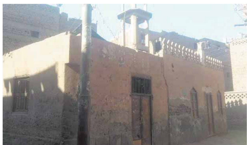
إحلال وتجديد المسجد مطلب الأهالي