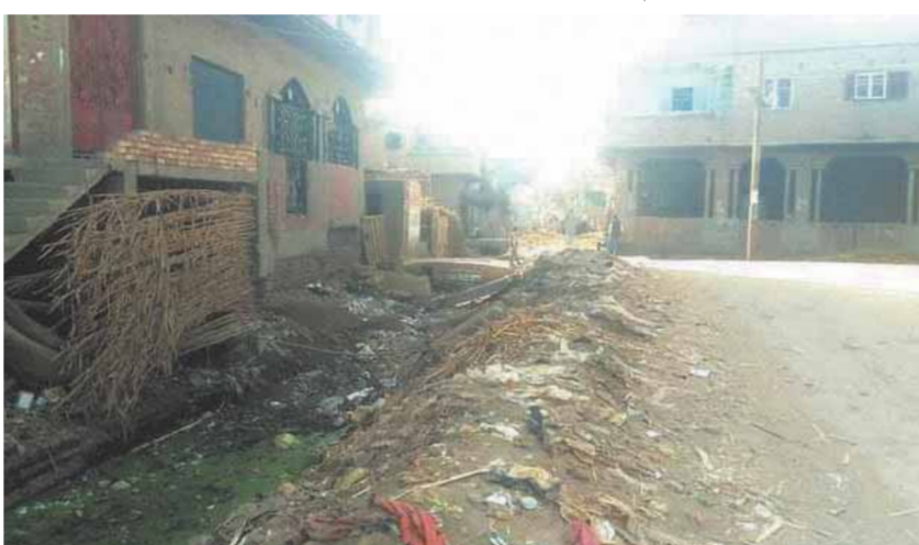
الكوبري بحاجة إلى صيانة والمدخل الرئيسي ينتظر الرصف