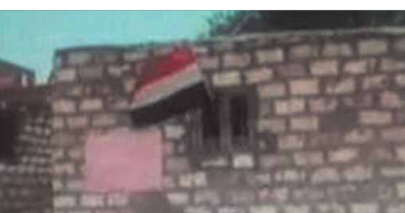
منازل القرية آيلة للسقوط

وطالب أهالي القرية المسئولين بالعمل على توفير حياة كريمة تلبي بالمواطن المصرى ورفع المعاناة عن كاهلهم وإدراج القرية ضمن مبادرة حياة كريمة وتوصيل كافة الخدمات من مياه شرب وصرف صحي وإنارة الطرق وتمهيدها.