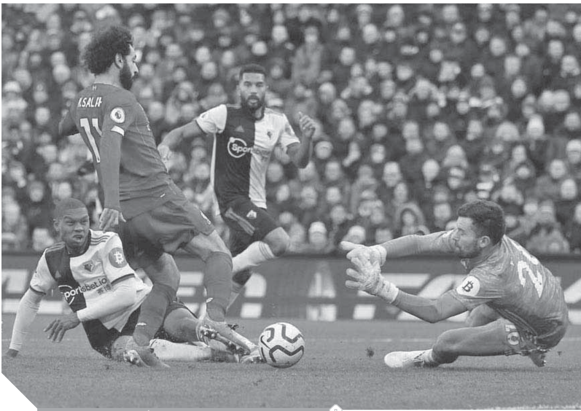
محمد صلاح يقود ليفربول أمام شيفيلد

وأضاف: «يجب أن تكون المباريات على ملعبنا ميزة كبيرة للفريق، المواجهة الأخيرة كانت معركة (ضد وولفرهامبتون)، ومن