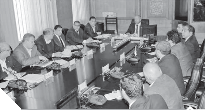
اجتماع المهندس كامل الوزير مع قيادات هيئة السكك الحديدية

وفى ختام الاجتماع استعرض الوزير خطة تطوير ورش السكة الحديد وتطوير بنيتها التحتية وتوفير المعدات الحديثة والأجهزة وقطع الغيار الأصلية، مؤكداً أن هذا التطوير يعتبر من أهم عوامل تطوير منظومة السكة الحديد.