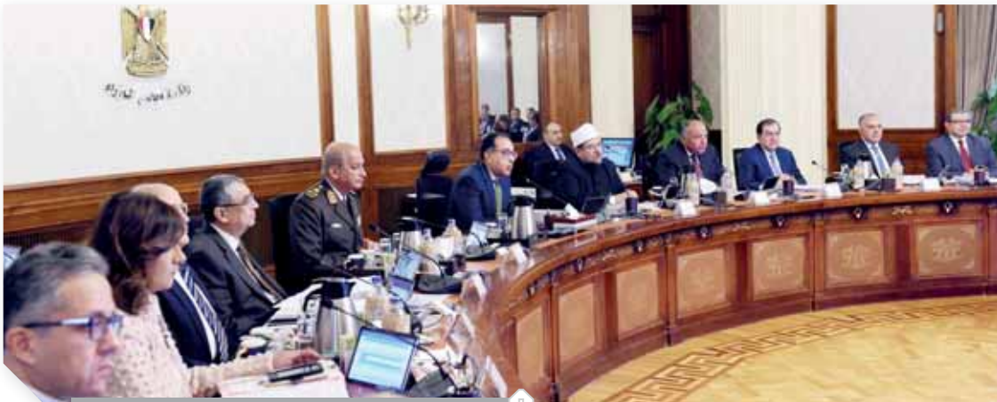
اجتماع مجلس الوزراء برئاسة الدكتور مصطفى مدبولى

أكد الدكتور مصطفى مدبولى، رئيس مجلس الوزراء، أن عام ٢٠٢٠ سيكون عاما محوريا، ويتطلب منا جهداً غير مسبوق، مشيراً إلى أن هناك مشروعات كبرى وملفات كثيرة نأمل أن تنتهى فى هذا العام، ويأتى مشروع انتقال الحكومة إلى العاصمة الإدارية الجديدة على رأس هذه المشروعات، مشدداً على ضرورة إيلاء جميع الوزراء الأهمية القصوى لهذا الملف، وتقدم رئيس الوزراء بخالص التهنية للرئيس عبدالفتاح السيسى، رئيس الجمهورية، بمناسبة العام الميلادى الجديد ٢٠٢٠، كما هنأ الوزراء وجمعوم الشعب المصرى، كما قدم التهنية خاصة للأخوة المسيحيين بمناسبة أعيادهم. وأوضح الدكتور مصطفى مدبولى خلال اجتماع الحكومة الأسبوعي برئاسة أسس أن هذا الملف يشهد ثباتا واستقرارا، وسيشهد انطلاقاً بأذن الله لتفطاق أوسع وأرحب فى العام الجديد، مشيراً إلى أن مؤشرات نتائج حملة ملف تحديث الصناعة على أجندة الأولويات، كما نعمل فى الوقت ذاته على الانتهاء من ملف التشايكات المالية بين الجهات المختلفة. وأكد رئيس الوزراء أن الحكومة ستعمل على تحقيق أقصى استفادة ممكنة من مواردها المائية، سواء باستخدام نظم الرى الحديث، أو ترشيد الاستهلاك، لافتاً إلى أن هناك خلطاً يتم تنفيذها حالياً لتحقيق هذه الأهداف.