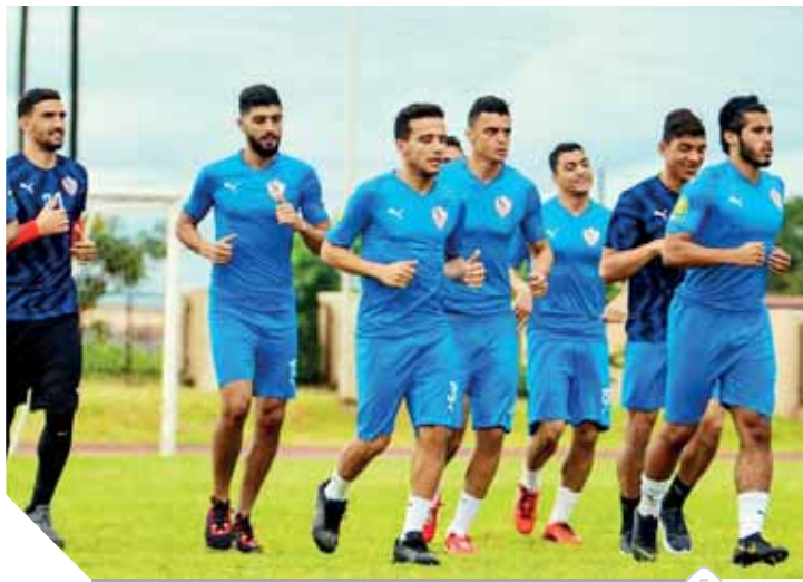
استعدادات الزمالك قبل لقاء أسوان

الليلة.. الزمالك يسعى لتصحيح أوضاعه على حساب أسوان ليفربول يتحضر لـ «شيفلد يونايتد»