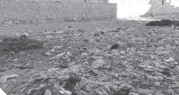
القمامة تحاصر قرية نؤارة