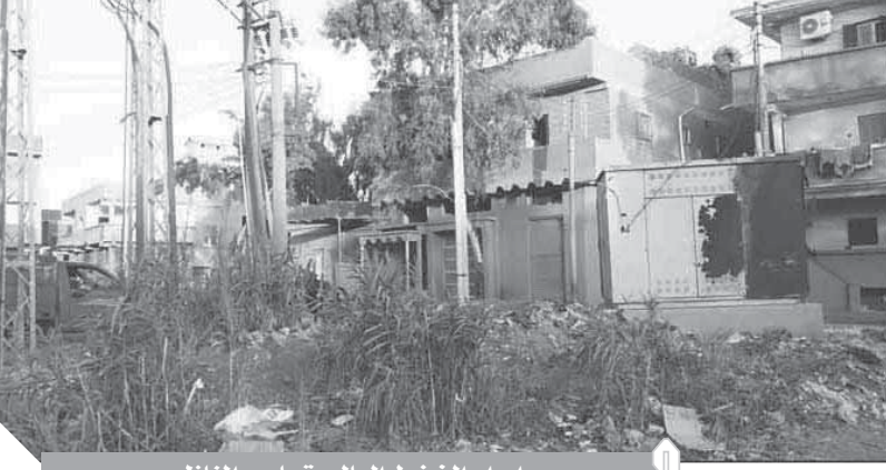
ابراج الضغط العالي تحاصر المنازل

وطالب أهالى القرية من اللواء طارق رضى محافظ الغربية بعمل كوبرى مشاة ليتسكن تلاميذ المدرسة الابتدائية التجريبية والثانوية من الذهاب لمدارسهم بأمان نظرا للازدحام المرورى الكبير بتلك المنطقة مما يهدد حياة الطلاب للخطر.