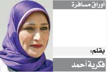
عندما نقش الجلال (١)

في التصعيد ضد الكاف، وواصل موسيمانى لوجاريتماته بالتهرب من تحمل مسؤولية خسارة النهائي، بتوجيه اللوم للاتحاد الإفريقي لإقامة اللقاء في المغرب «معمل الوداد»، ولكنني أذكرهم المباراة في المغرب سعيد بهذه النتيجة بالتأكيد، ولا يجب الحديث عن المكسب والخسارة، قبل اللعب في ملعب محايد ويجتاحه متساو».