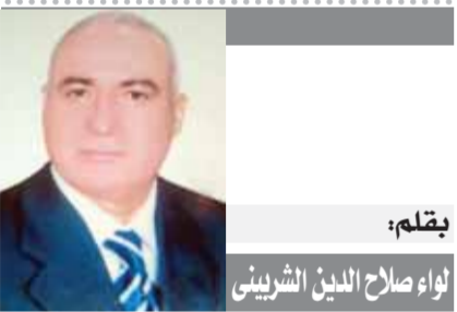
لقلم: لواء صلاح الدين الشرينى