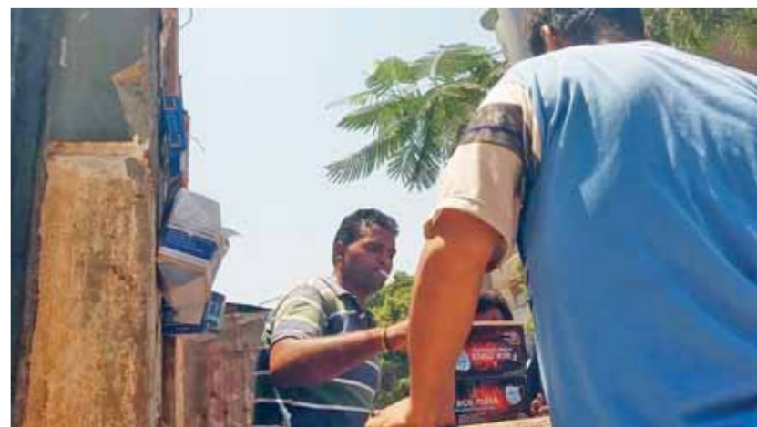
بيع الأدوات الطبية على أبواب مستشفى أم المصريين