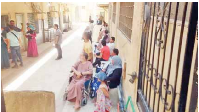
تكدى فى ساحة المستشفى بسبب قلة الموظفين

بجرح قطعى فنزف دماء كثيرة، وتدخل بعض زملائه العاملين بنفس المعلم لوقف النزيف ولكن لم يستطع أحد السيطرة على الدم المتدفق، وعلى الفور توجهوا به إلى قسم طوارئ مستشفى أم المصريين لإسعافه.