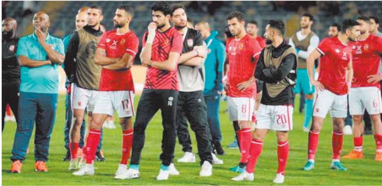
آثار الهزيمة واضحة على لاعبي الأهلي