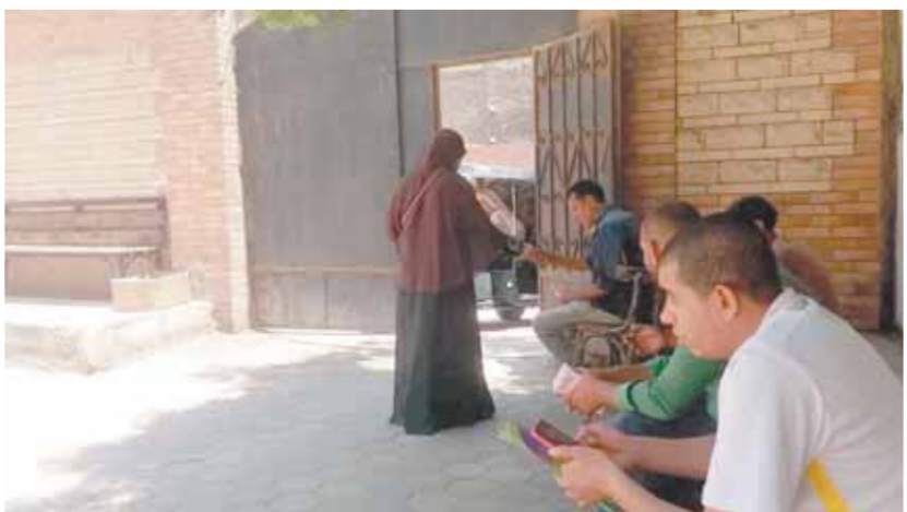
إتاوات على باب طوارئ مستشفى أم المصريين