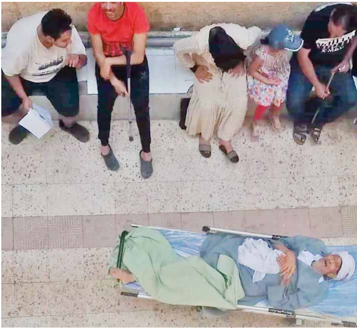
مريض ملقى على ترولى بممر المستشفى