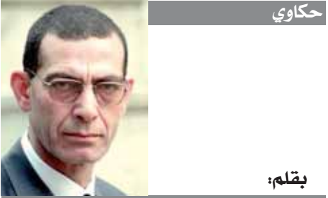
بحكم: د. وجدى زين الدين

كتب- عبدالخالق خليفة وأمانى سلامة ونغم هلال: عقدت الدكتورة ياسمين فؤاد وزيرة البيئة والدكتور محمد عبدالعاطي وزير الموارد المائية والرّي اجتماعاً موسعاً لمناقشة التجهيزات الخاصة بإعداد لعقد مؤتمر المناخ لعام ٢٠٢٢ (COP٢٧)، وجنح المياه المقام على هامش المؤتمر والمزمع عقده في شهر نوفمبر المقبل، والذي ستضيفه مصر ممثلة عن القارة الإفريقية، ومناقشة آلية تضمين قضايا المياه في فعاليات المؤتمر المختلفة، وذلك بحضور عدد من قيادات الوزارتين المعنيةين. وأكدت الدكتورة ياسمين فؤاد وزيرة البيئة وضع أهمية موضوعات المياه وعلاقتها بالتغيرات المناخية على أجندة مؤتمر COP٢٧، وأن يتم تناوله في مفاوضات المناخ القادمة، نظراً لأهميتها لدى العديد من دول العالم. وأوضحت وزيرة البيئة أنه لا بد من العمل على تشكيل فريق عمل مشترك من وزارتي البيئة والموارد المائية والرّي ووزارة الخارجية للاطلاع على الموضوعات الخاصة بالمياه والتي سيتم تناولها خلال المؤتمر، وتحديد حزمة من المشروعات التنكيفية التي ترغب في الحصول على تمويل لها. وأوضحت «فؤاد» خلال الاجتماع أن مصر تهدف من خلال مؤتمر المناخ القادم إلى العمل على زيادة التمويل المقدم من قبل الدول