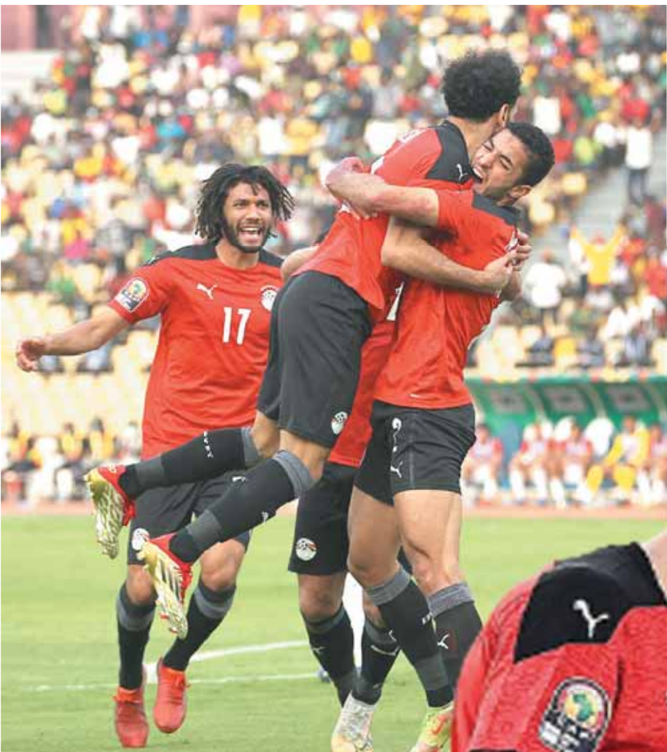
فرحة لاعبي المنتخب بالفوز على المغرب