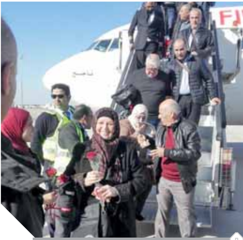
وصول أولى الرحلات الاردنية لمطار سفنكس

ويعد مطار سفنكس الدولى الذى يقع غرب القاهرة ويقدم خدماته لمنطقة الجزيرة والهرم وأكتوبر ومحافظات بنى سويف والفيوم من المطارات التى سيكون لها دور كبير فى تشجيع حركة السياحة الثقافية والأثرية وسياحة اليوم الواحد، خاصة مع قرب افتتاح المتحف الكبير، حيث يبعد ١٢ كيلومترا عن منطقة الأهرامات، ويحظى المطار بأهمية جغرافية متميزة لوجوده قرب المزارات السياحية فى القاهرة والجزيرة،