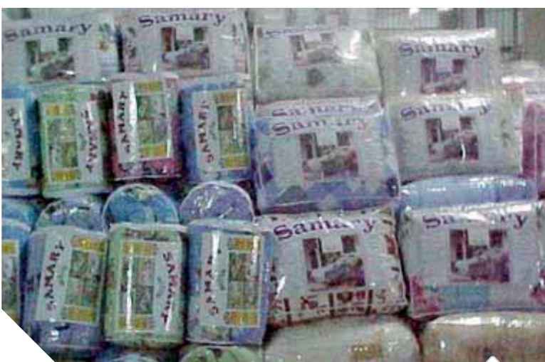
صناعة البطاطن المحلية تواجه الإغراق الأجنبي

إلى أن قطاع المعالجات التجارية بالوزارة قام بالدفاع عن الصناعة والصادرات المصرية في ١٣ قضية منها ٧ قضايا وقائية، و٥ قضايا إغراق، وقضيتين في مجال الدعم.