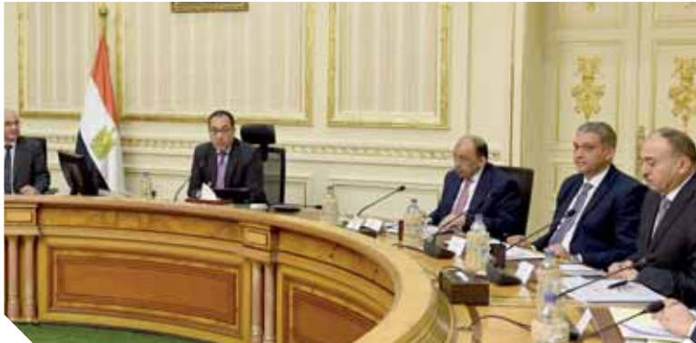
رئيس الوزراء يترأس اجتماع اللجنة الرئيسية لتقنين أوضاع الكنائس تصوير: سليمان العطيفى

كتب - عبد الرحيم أبوشامة: أعلن المستشار نادر سعد المتحدث الرسمى باسم مجلس الوزراء أمس الموافقة على تقنين أوضاع ٩٠ كنيسة جديدة قبل أعياد الميلاد بإجمالى ١٤١٢ كنيسة ومبنى تابعاً. كما أعلن اعتزام الحكومة تنفيذ المزيد من مشروعات الإسكان للمواطنين غير الآمنة. وكانت اللجنة الرئيسية لتقنين أوضاع الكنائس وافقت فى اجتماعها برئاسة الدكتور مصطفى مدبولى رئيس مجلس الوزراء، وحضور وزراء العدل والتنمية المحلية والإسكان والمرافق والمجتمعات العمرانية وشئون مجلس النواب، وممثلى الجهات المعنية على تقنين أوضاع ٩٠ كنيسة ومبنى تابعاً جديداً، ووجه رئيس الوزراء التهنئة لجموع الشعب المصرى بالعام الجديد، والتهنئة للأخوة الأقباط بقرب حلول عيد الميلاد المجيد، متمنياً لمصرنا الحبيبة دوام الخير والرفعة. وأعرب «مدبولى» عن سعادته بأن يتصادف اجتماع اللجنة