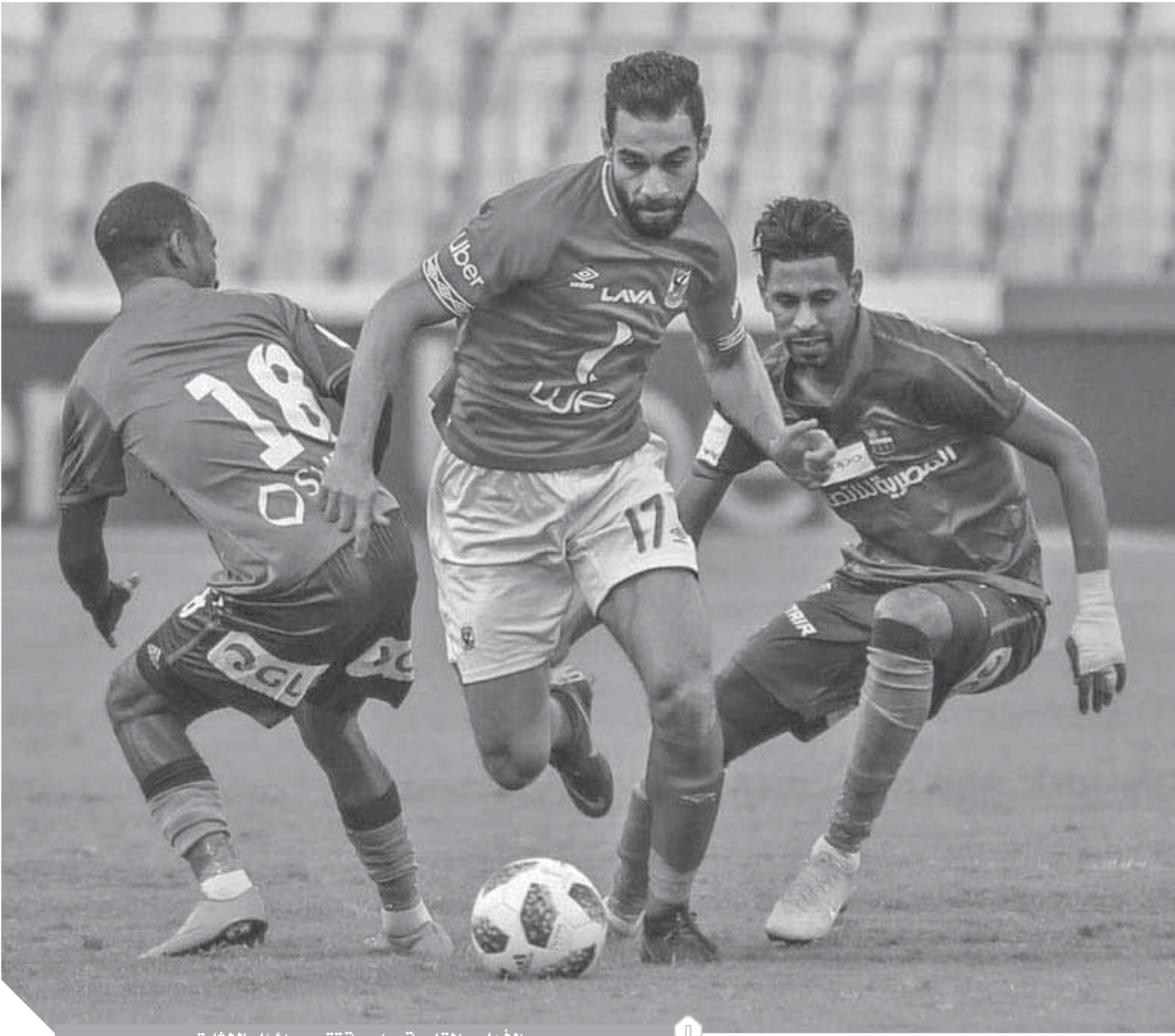
الأهلى والمقاصة مواجهة تتسم دائما بالإثارة