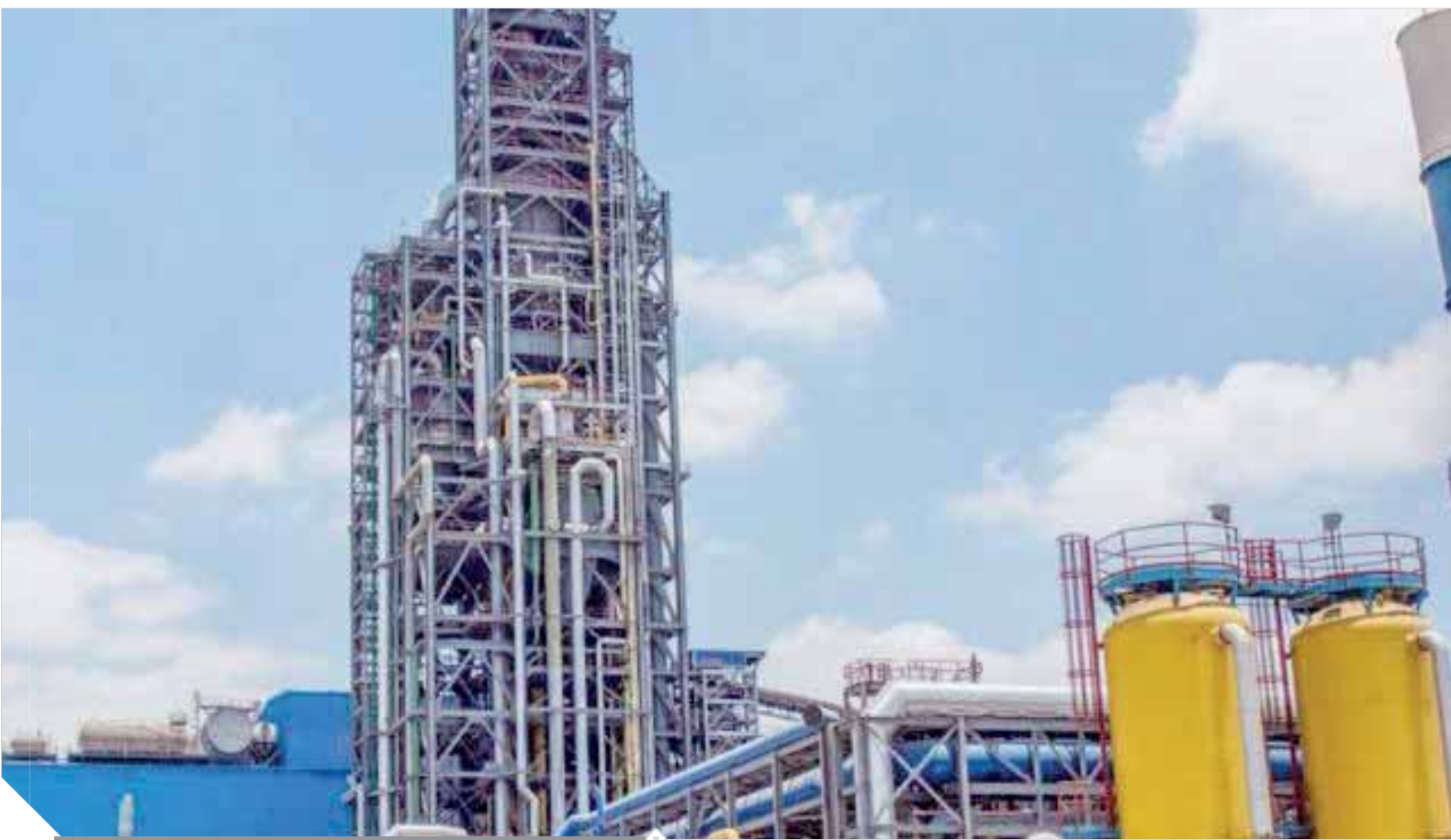
صناعة الصلب الوطنية تعاني تحديات كبيرة عام ٢٠٢٠