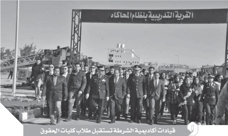
قيادات أكاديمية الشرطة تستقبل طلاب كليات الحقوق