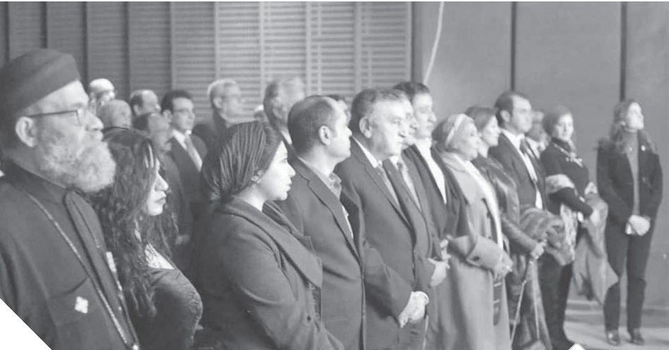
الحاضرون فى الملتقى أثناء عزف السلام الجمهورى