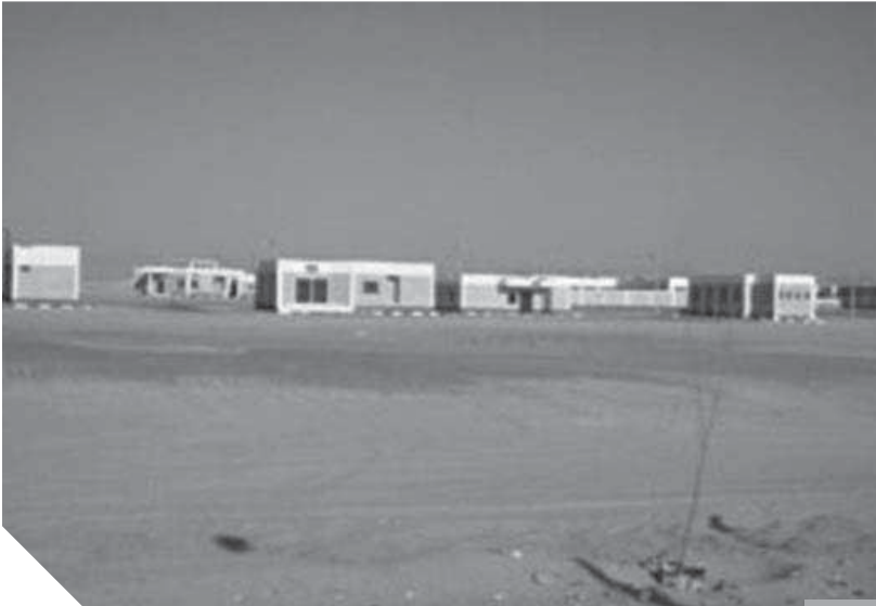
قرى الظهير الصحراوى بالصعيد بلا سكان