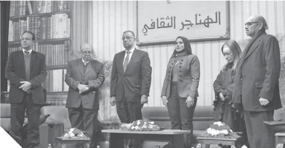
المتحدثون فى الملتقى

□ ناهـد عبد الحميد: القوى المصرية ساعدت على تماسك البنيان الإنسانى للشعوب العربية