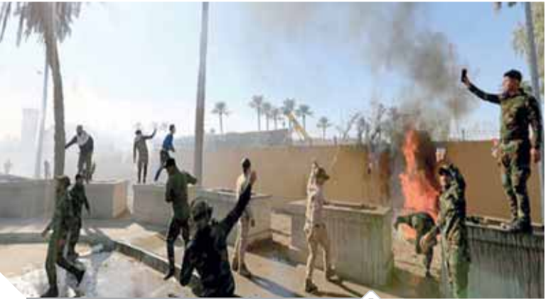
جانب من احتجاج العراقيين

السفارة لمنعهم من الوصول إليها، فيما لجأ المتظاهرون إلى القوة من أجل الوصول إلى المكان. وقالت صحيفة (واشنطن بوست) الأمريكية إن حالة التوتر تصاعدت بين واشنطن وبغداد، بعدما تبادل مسئولو البلدين الاتهامات بشأن الضربات الجوية الأمريكية ضد كاتائب (حزب الله) المدعومة من إيران فى العراق وسوريا، مما أسفر عن مقتل ٢٥ فرداً منها وإصابة أكثر من ٥٠ شخصاً. وأشارت الصحيفة إلى أن الهجمات