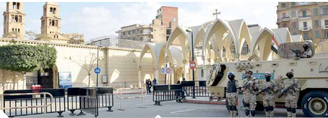
تأمين دور العبادة خلال الاحتفالات بأعياد الميلاد

يأتى ذلك فى إطار احتفالات الشعب المصرى بالعام الميلادى الجديد وتنفيذاً لتوجيهات القيادة العامة للقوات المسلحة.