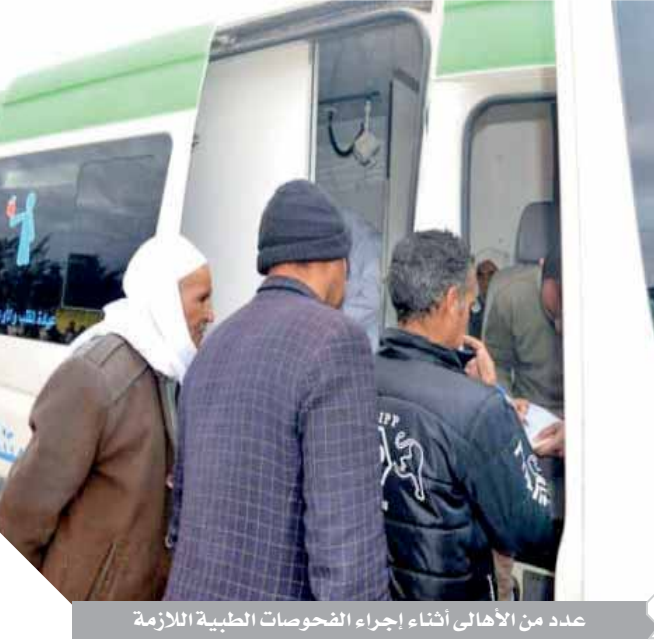
عدد من الأهالى أثناء إجراء الفحوصات الطبية اللازمة

لدمع ومعاونة أهالى الصعيد وتوفير سبل الراحة وكل الخدمات والاحتياجات الأساسية لهم وفى إطار الاهتمام بالمناطق والقرى الأكثر احتياجاً لتوفير أوجه الرعاية المختلفة والتواصل المستمر بين القوات المسلحة للمواطنين