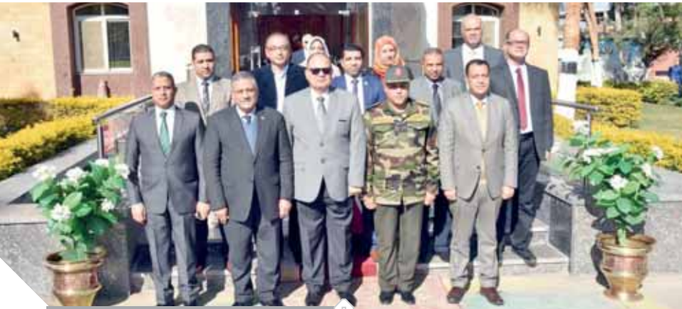
أ جانب من قيادات المشاركة فى القافلة التنموية

● إذا الأمر واضح، فالتسارع التركى، لإرسال قوات تركية «ظاهرياً» وتهريب ميليشيات إرهابية «فعلياً» قد يؤدى إلى إحراق المنطقة بأكملها، وليس أمامنا سوى مواجهة هذا المخطط بكل حسم، لأن الأمن القومى المصرى خط أحمر لا يقبل الجدل.