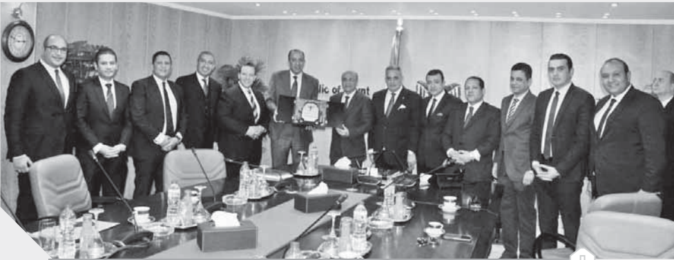
المستشار عمر مروان يستقبل وفد المحكمة الدستورية برئاسة المستشار سعيد مرعى